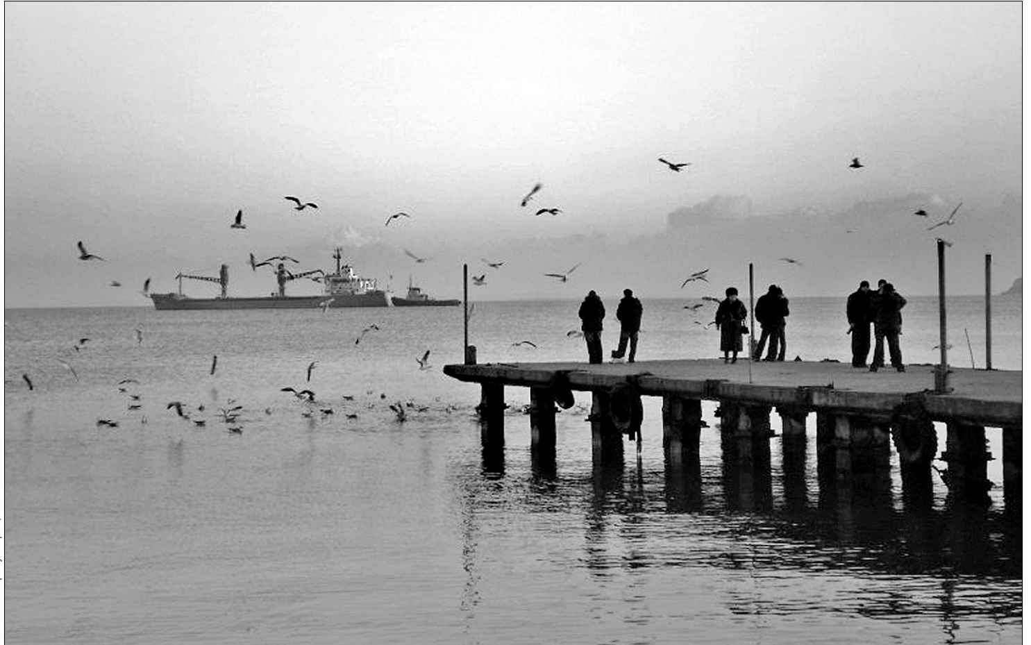
Небезпечний вантаж не хоче відпливати від українських берегів