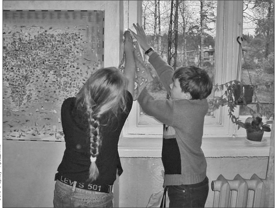
Окрім капітальних ремонтів покрівель та мереж, до зими в місті утеплюватимуть вікна та двері

Як зазначено у розпорядженні, до 25 вересня районні адміністрації повинні