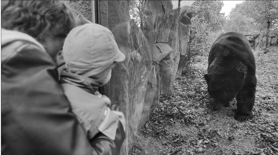
У Київському зоопарку відвідувачі зможуть дізнатися про поведінку і спосіб життя найбільшого за розміром хижака України — карпатського ведмедя

Завтра у столичному зоопарку відзначають День ведмедя