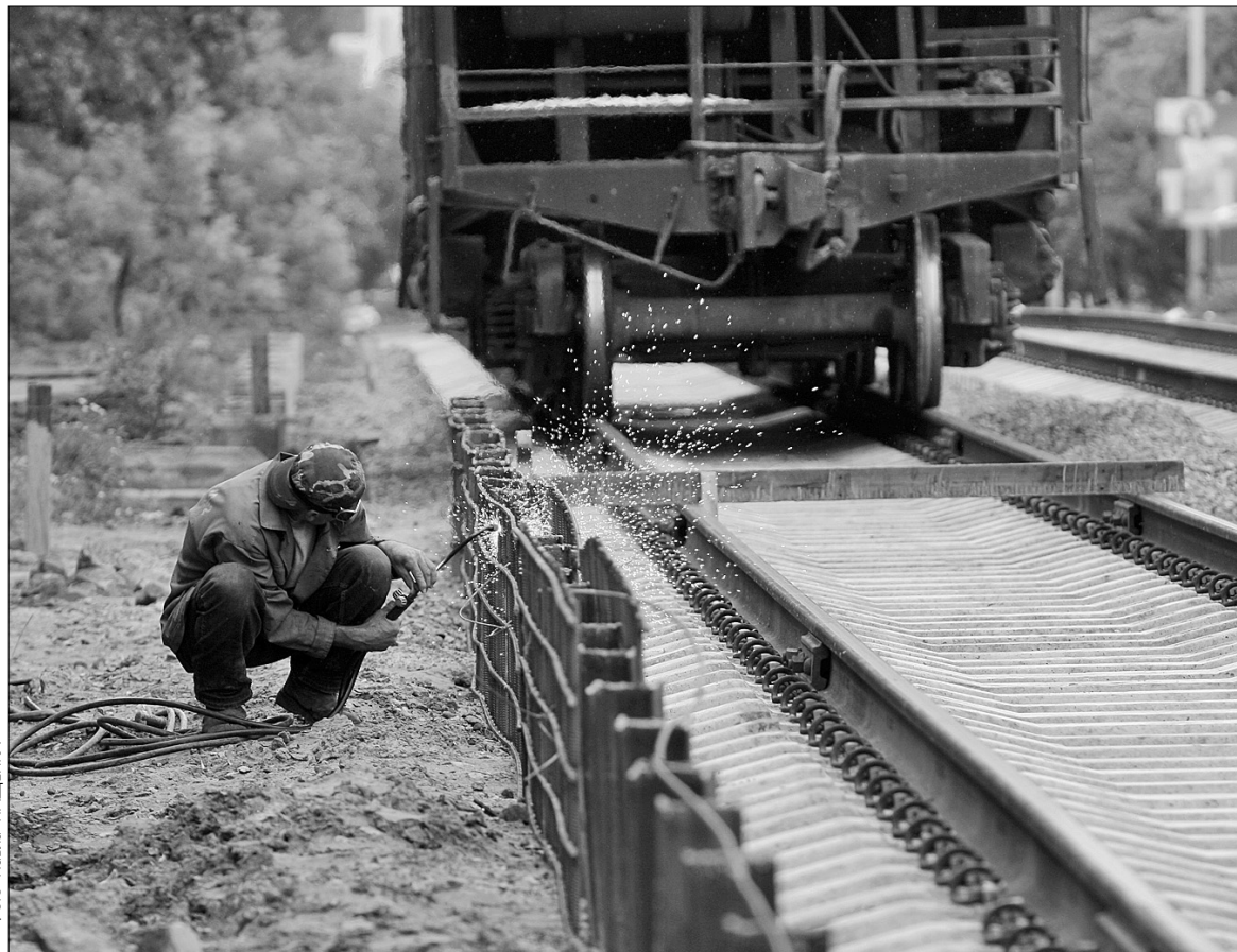
Після реконструкції від площі Перемоги до Борщагівки швидкісним трамваем можна буде дістатися за 23 хвилини, а не за 40, як нині