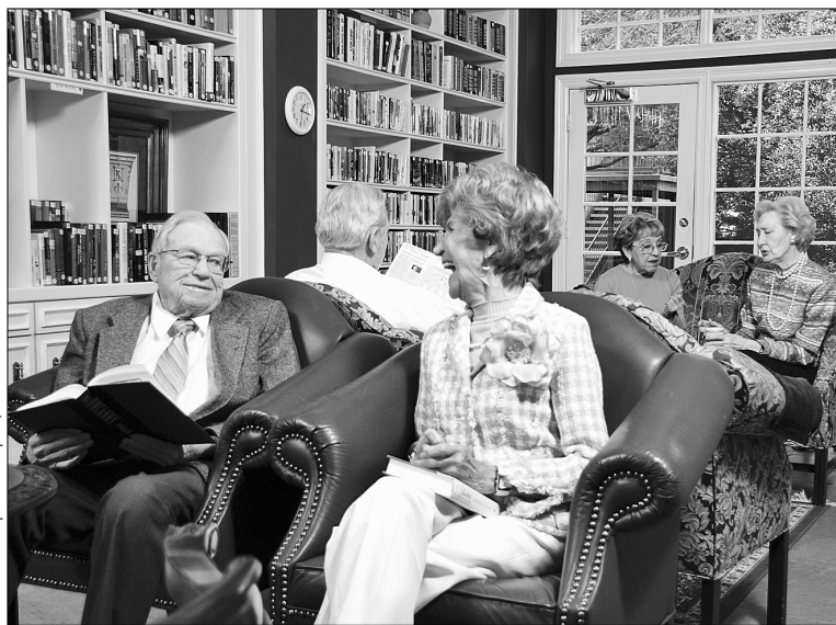
Гериатрические пансионаты становятся новым домом для пожилых людей

дей главной их проблемой является не столько добыча пропитания, сколько "невостребованность в обществе". Поэтому большинство из них часто подвержены депрессиям, теряют интерес к жизни. После выхода на пенсию, оставшись без любимого дела, многие вскоре умирают. В советские времена одиноким людям предоставляли места в домах престарелых. Но для большинства из них переселиться туда было стыдно, в этом случае они считали себя никому не нужными изгоями. Этого не скажешь об их зарубежных сверстниках. В странах Европы и Америки для них строят гериатрические пансионаты. Пенсионерам предоставлена возможность не дожидаясь оставшихся годы, а продолжать жизнь и наслаждаться ею. Ведь там они могут заниматься делом, посещать интересующие их мероприятия, вдоволь общаться.