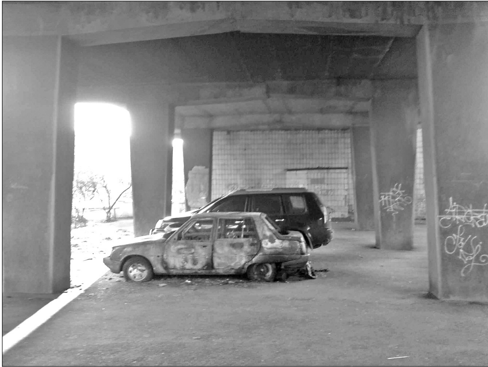
Так виглядає ніша під будинком зараз

Таку суму вимагають із забудовника за припинення протестів проти забудови першого поверху будинку на палях на Бучми, 8