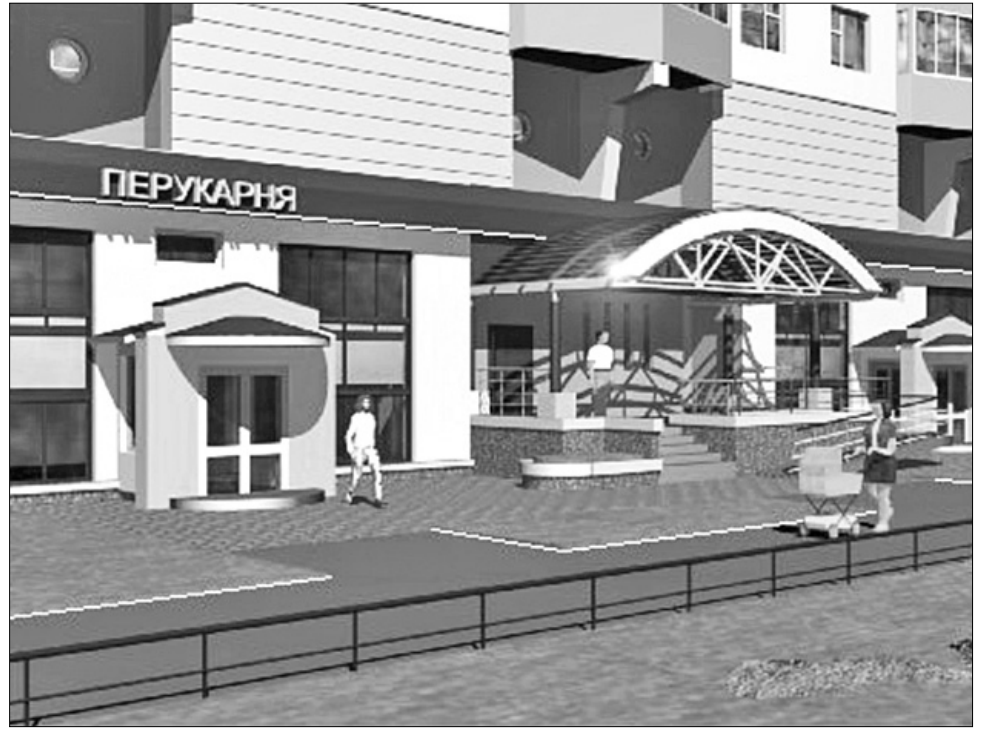
Так вона може виглядати вже незабаром

Нагадаємо основні етапи конфлікту з урахуванням нових обставин та документів. У 2003 році будівельна компанія "Албо" планує звести приміщення на першому поверсі будинку на Бучми, 8. Частина жителів будинку (втім, невелика — активні під час акцій 10—15 осіб, а в будинку — 384 квартири) певна: оскільки будівлі майже 40 років, будь-яке втручання може призвести до її руйнування. Однак експерти та архітектори, виявляється, з ними не згодні. Вони, навпаки, переконані, що спорудження під висоткою, зокрема перукарень та офісів, навіть укріпить будинок. Зокрема, ще у 2004 році експертизи цього будинку проводили спеціалісти Державного науково-дослідного інституту будівельних конструкцій. Тоді вони визнали стан будинку задовільним, але відзначили, що він з кожним днем погіршується. В документах експертизи є рекомендація, яку маємо процитувати дослівно: "Для поліпшення