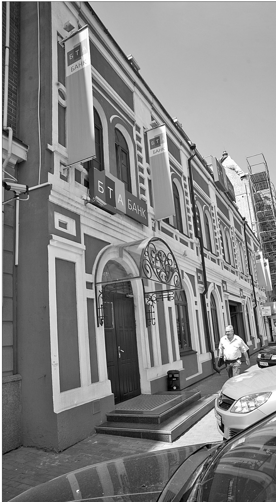
Логотип “БТА Банку” незабаром зникне зі столичних вулиць

Так само рейтингове агентство “Кредит-Рейтинг” підтвердило кредитний довгостроковий рейтинг “БТА Банк” на рівні uaBBB. Прогноз кредитного рейтингу стабільний. Це означає, що в довгостроковій