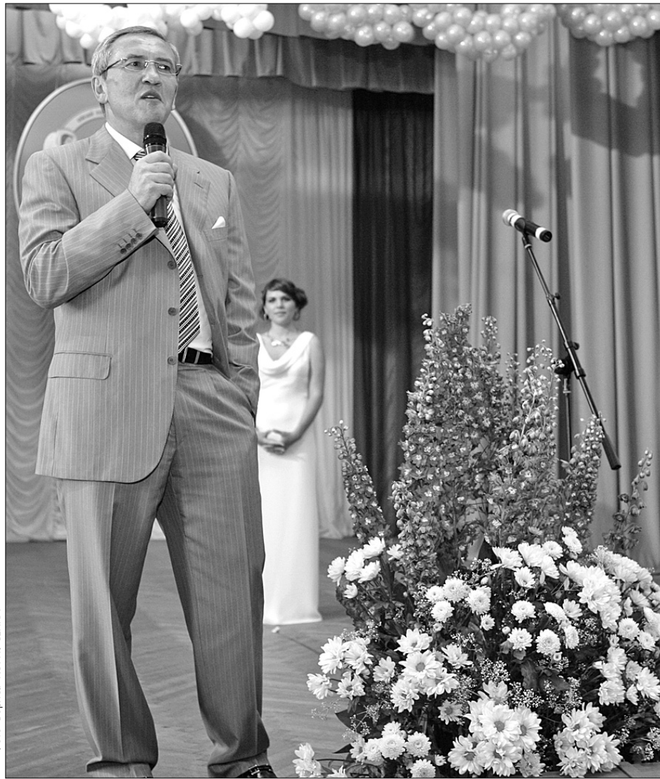
Міський голова Леонід Черновецький побажав столичним випускникам у дорослому житті досягти небачених висот