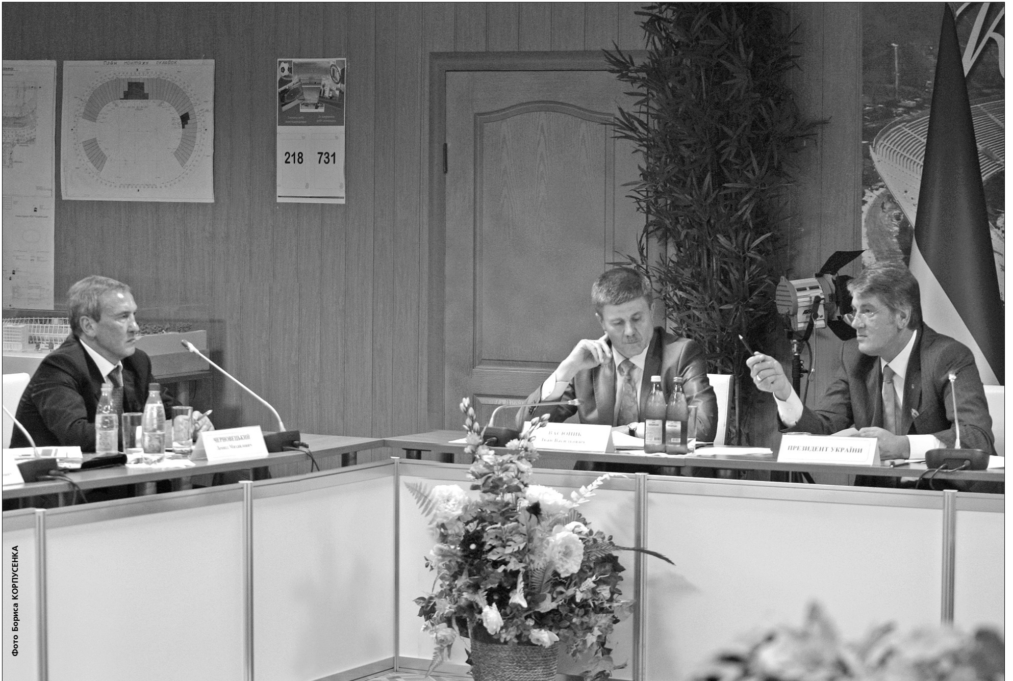
Учора Президент Віктор Ющенко багато в чому погоджувався з мером столиці Леонідом Черновецьким

Президент України і мер Києва проситимуть уряд повернути кошти, вилучені у столиці до державного бюджету