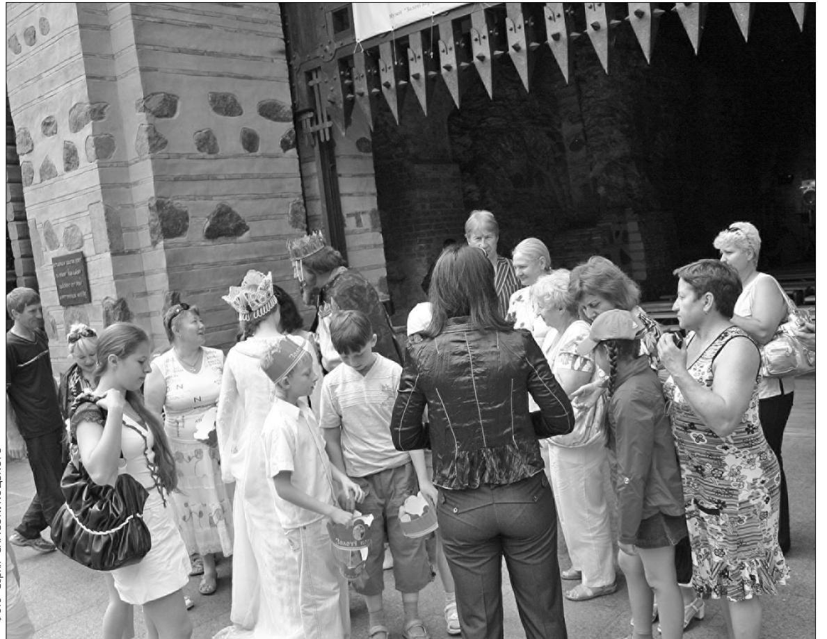
Завдяки музичному проекту “Золоті ворота відкривають Герсу” головна брама стародавнього Києва щоп’ятниці перетворюватиметься на справжній концертний майданчик

Перед кожним концертом усі очі матимуть нагоду оглянути експозицію коштовного каміння “Український бурштиновий світ”