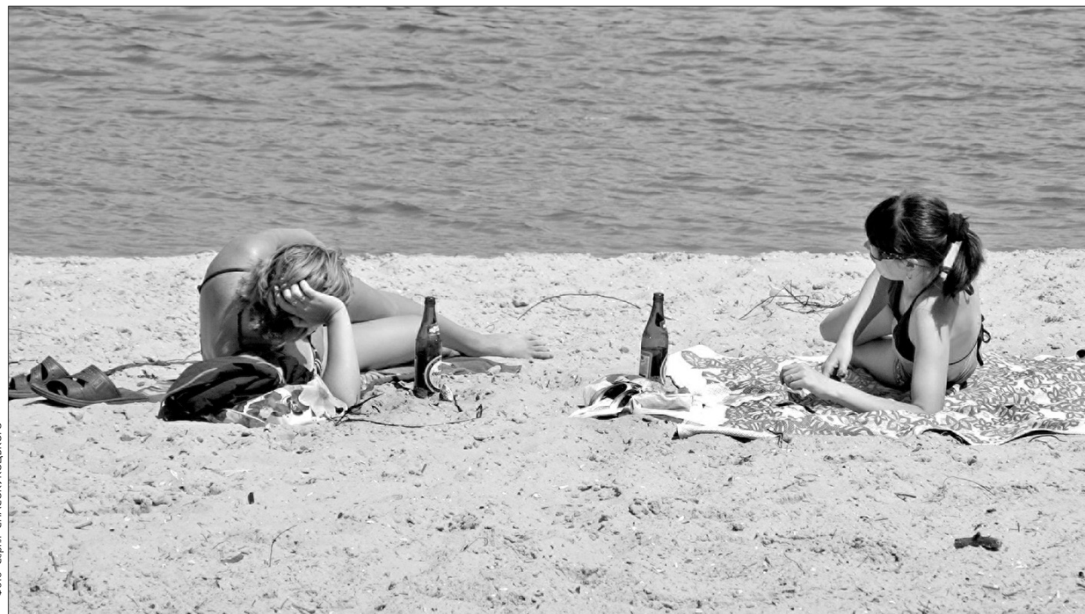
Якщо ініціативу депутатів буде підтримано, відпочивати на пляжі доведеться без пива

Ініціатива Блоку Леоніда Черновецького знайшла підтримку і в інших фракціях. На минулому засіданні депутати звернулися до Верховної Ради, Кабінету Міністрів і Президента з проханням зарахувати слабоалкогольні напої до алкогольних. За це звернення