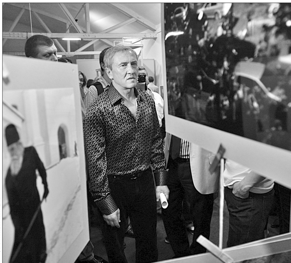
Леонід Черновецький урочисто відкрив виставку "Київ очима киян", яка відбулася в рамках фестивалю міської культури "I love Kiev", на конкурс мер надав кілька своїх фоторобіт