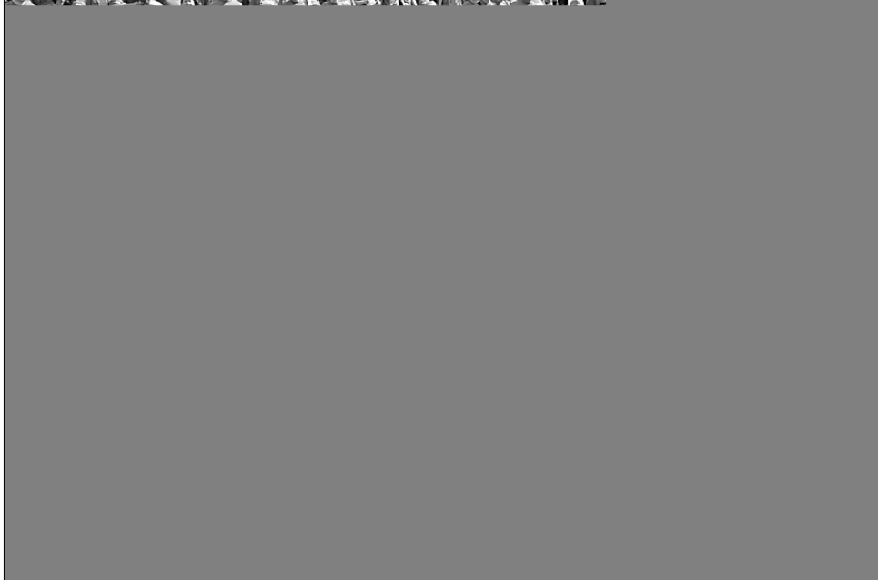
Учасники 17-го щорічного "Пробігу під каштанами" подолали 5-кілометрову дистанцію: від майдану Незалежності пробігли Хрещатиком, через площу Льва Толстого Великою Васильківською до планетарію, а звідти — у зворотному напрямку