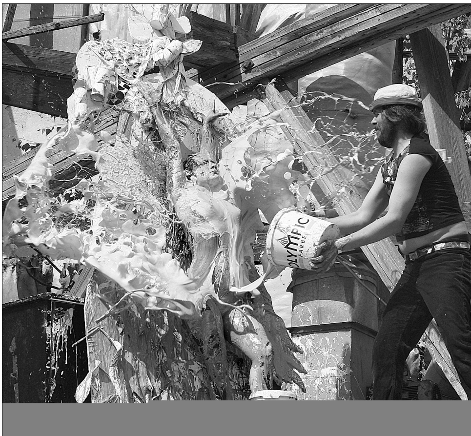
Під час перформансу Геннадія Гутгарца "Action painting", який показали на фестивалі "I love Kiev", моделей облили фарбою