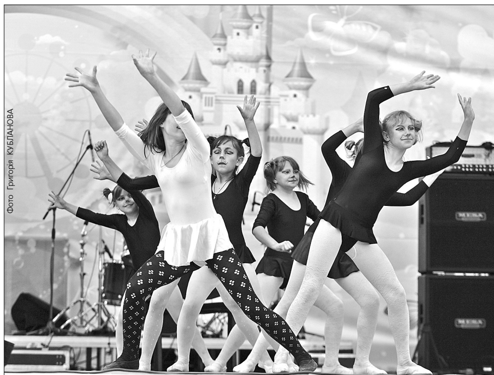
Тим часом на Співочому полі підбили підсумки фестивалю дитячої творчості "Назустріч мрії"