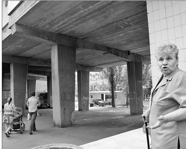
Мешканці будинку на вулиці Бучми, 8 впевнені, що будь яке втручання в архітектуру будинку, може знешкодити його

Представники забудовника заспокоювали громадян — спорудження під висоткою перукарень та офісних приміщень навіть зміцнить будинок. Мовляв, несучі конструкції треба забудувати докола, аби забезпечити належний температурний режим для комунікацій. Проте спеціалісти стверджують протилежне: експериментальний будинок не потребує жодної додаткової підтримки. "Березняки і Русанівку, — пояснив на-