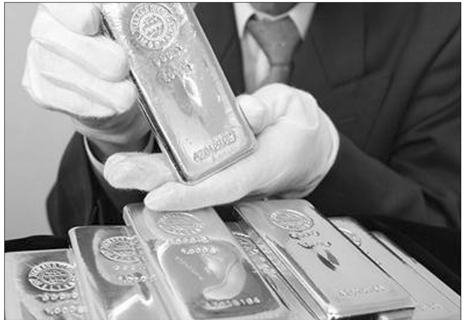
Купівля благородного металу може не лише врятувати від інфляції, а й принести несподівані прибутки

Ціна золота на ринку на початку тижня зростала. Так, у вівторок збільшення становило 355,54 грн до рівня 70859,97 грн за унцію. В середу, 20 травня, курс зменшився до рівня 70225,67 грн за унцію. До 22 травня знову тривало збільшення курсу, в п'ятницю він становив 71591,34 грн за унцію.