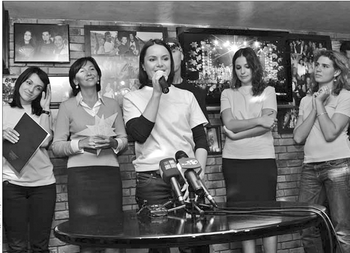
Цього року до організації і проведення фестивалю долучилася гімнастка Лілія Подкопаєва, яка увійшла до складу журі

Фестиваль "Назустріч мрії" в Україні відбувається втретє. Перші два рази він проходив у Криму і залучив більш ніж півтори тисячі дітей із дитячих будинків і шкіл-інтернатів. Цього року фестиваль відбудеться в Пущі-Водиці, на території дитячого табору "Лісний", і пройде під патронатом Київської міської адміністрації. Він триватиме до 31 травня включно. Організатори, міжнародна громадська організація "Назустріч мрії" на чолі з її головою Іриною Волгіною та Міжнародна