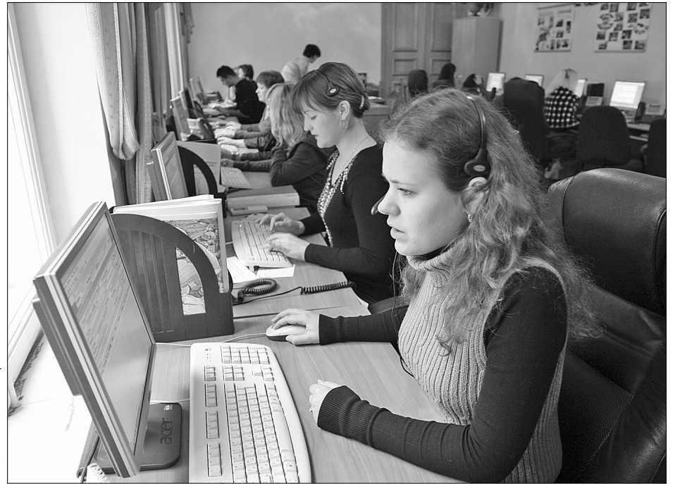
160 операторів Call-центру щодня вислуховують скарги киян та змушують чиновників вирішувати усі міські проблеми

Добросовісні працівники комунальних служб швидко розв'язували проблеми киян. Ті, хто не реагував на звернення і не виконував своїх обов'язків, були звільнені або попереджені про санкції. "Спочатку нас ніхто серйозно не сприймав. Бувало, що наші вимоги просто ігнорували. Але потроху з чиновниками вдалося налагодити співпрацю і переконати їх працювати на киян. У цьому нам допо-