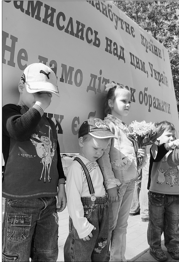
Юні мушкетери просять захисту від чиновників

Учора зранку адміністрацію Шевченківського району пікетували сотні обурених батьків дітей, які займаються у клубі "Юний мушкетер". Виявляється, маленьких спортсменів уже тиждень не пускають до приміщення клубу дорослі, які представляють співробітниками комунального підприємства "Дитячі мрії", створеного райдержадміністрацією під проводом Віктора Пилипишина. Учасники пікетування звинувачують районну владу в намаганні відібрати у них та їхніх дітей приміщення клубу, де безплатно займалися не одне покоління мешканців столиці. Голова Шевченківської адміністрації Віктор Пилипишин учора пообіцяв пікетувальникам розібратися з цим питанням.