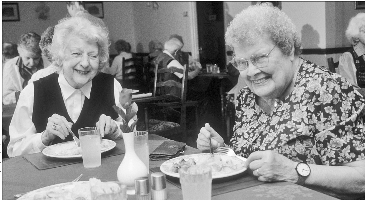
Щаслива і безтурботна старість — мрія будь-якої людини літнього віку

Справжній бум у цій сфері розпочався після Другої світової війни. Тоді кількість самотніх літніх людей різко зросла. Радянські будинки так і залишилися на старій німецькій системі (деякі навіть дістали цілком "рейхівські" назви — будинки ветеранів). Західна Європа і Америка пішли далі — вони ввели будинки для літніх людей у побут кожної сім'ї. Вони стали звичними установами для багатьох людей разом зі школою, дитячим садком і роботою.