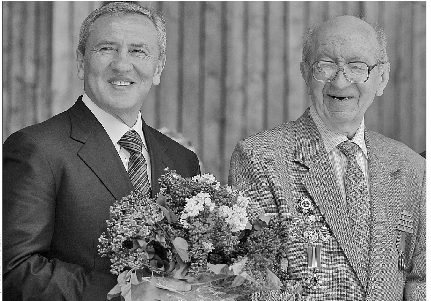
За відвоювану країну міський голова Леонід Черновецький подякував ветеранам та пообіцяв особисту підтримку

Леонід Черновецький подякував фронтовикам за перемогу