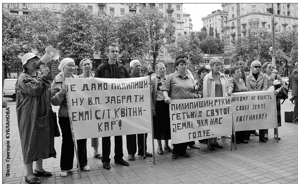
Еміль КРУПНИК спеціально для "Хрещатика"

Кияни вимагають повернути земельну ділянку, відібрану за часів Олександра Омельченка