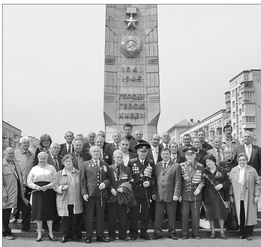
Ветерани-співробітники Генеральної дирекції з обслуговування іноземних представництв (фото 2007 року)