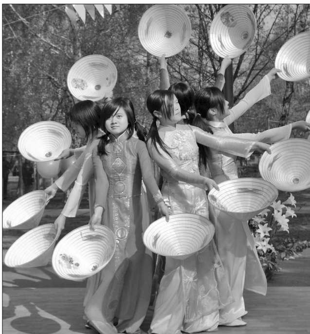
На святкування Дня дитини до Києва з’їхалися діти багатьох країн, аби мовою мистецтва говорити зі своїми однолітками

Цьогоріч, завдяки організаторам, свята відбулося в Києві. З’їхалися діти не