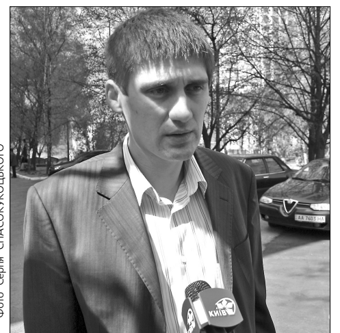
Представник Генпрокуратури відмовився називати своє ім'я та мету візиту