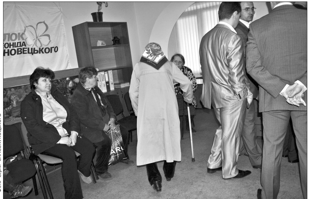
Слідчі прокуратури позбавили літніх людей надії на пораду і допомогу

хібна практика правоохоронних органів. Ми оскаржуватимемо такі дії", — наголосив депутат. Він розповів, що слідчі поїхали, не знайшовши жодного криміналу. Учорашній обшук представники Блоку Черновецького називають політичним тиском та беззаконням.