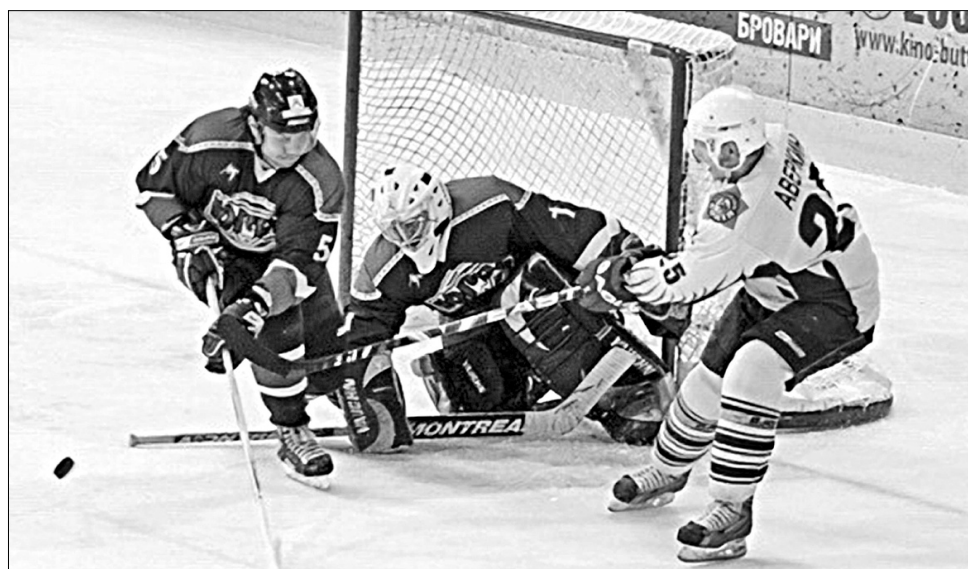
У другому поєдинку хокеїсти "Сокола" були на голову сильнішими за гостей з далекого Ханти-Мансійська

Удруге в історії виступів у плей-оф Вищої ліги Відкритого чемпіонату Росії київський "Сокил" натрапляє на команду з іншого дивізіону. Перша спроба у минулорічному протистоянні з "Казахмисом" із Саптаєва виявилася невдалою — український клуб поступився у кожній з трьох зустрічей. Цього разу кияни натрапили не на казахську команду, а на представника Росії — "Югру" з Ханти-Мансійська. Напевно, прихильники спорту, почувши назву цього міста, яке знаходиться у Західному Сибіру, одразу подумали про ще один видовищний вид спорту, а саме: біатлон. Справді, у Ханти-Мансій-