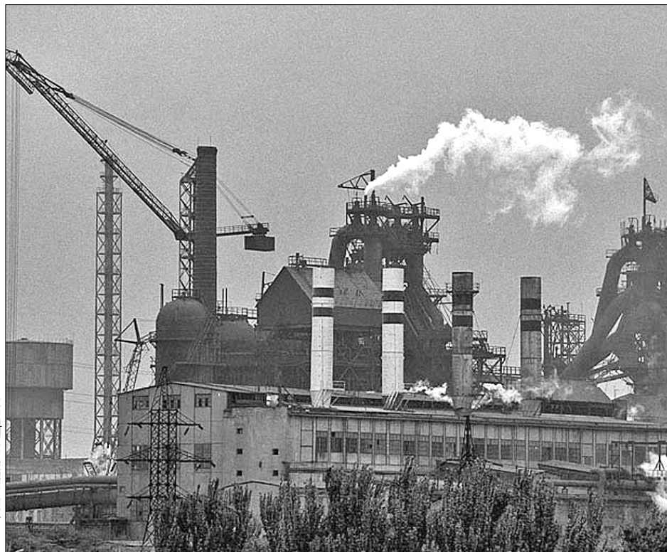
Експерти не виключають зростання вартості українських підприємств через стабілізацію фондового ринку