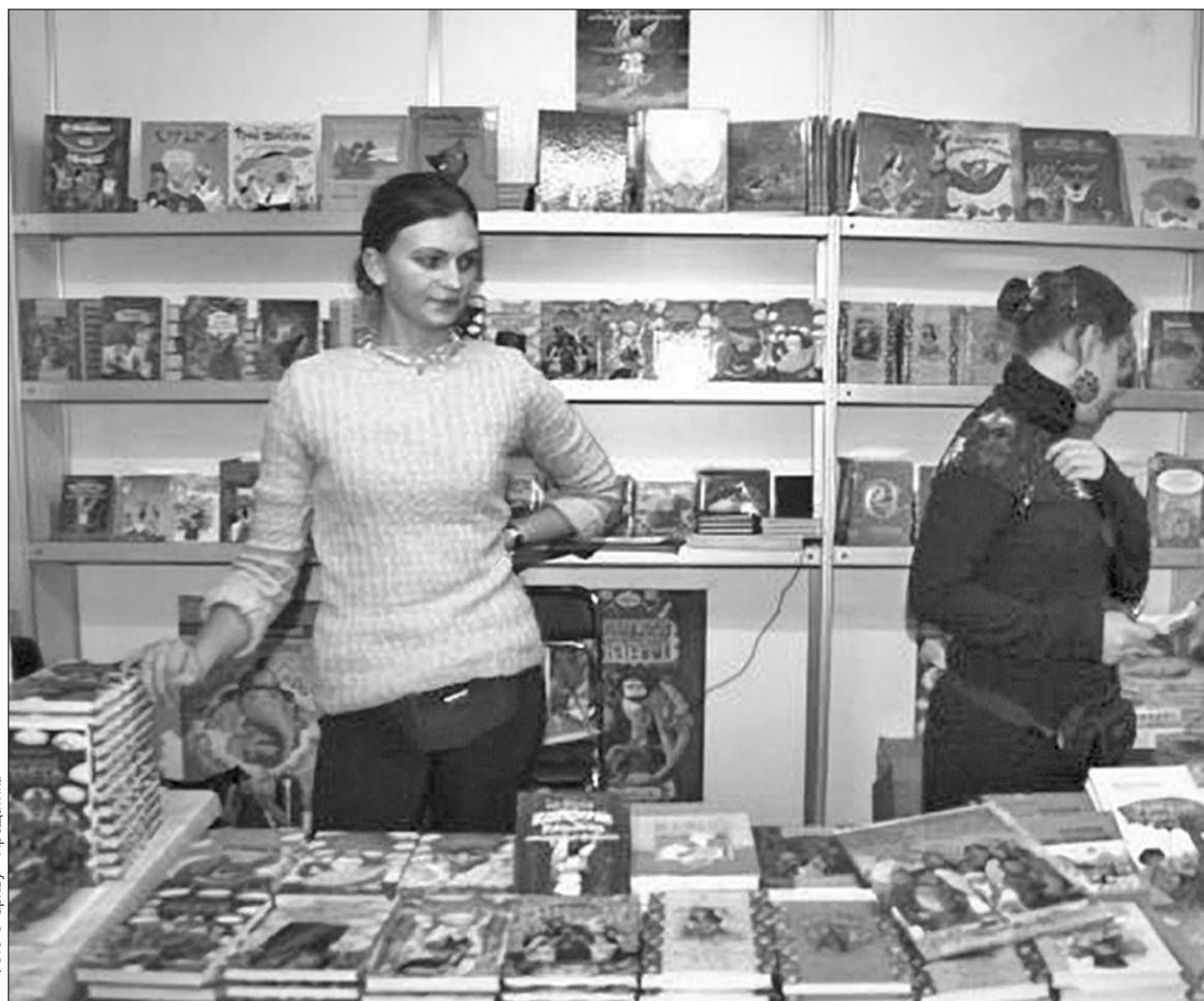
Поповнити книжкову полицю пропонують на весняному Київському книжковому ярмарку, в асортименті видавництв — література від дитячої до наукової і фантастичної

Книжкові видавці б'ють на сполох. За словами президента Української асоціації видавців і книгорозповсюджувачів Олександра Афоніна, у цьому році прогнозують зниження кількості виданих книжок удвічі (за назвами і за накладом). Це пов'язано в першу чергу з подорожчанням поліграфічної продукції та нестачею коштів у видавництвах. Однак 2-го квітня відкривається вже вчетверте весняний книжковий ярмарок "Медвін". На ньому мешканцям столиці останні книжки представлять понад 300 видавництв України, Росії та Білорусі. Книжки продаватимуть за цінами виробників. "Бачу виставку як один із антикризових заходів у нинішній ситуації, можливість долучитися до книжки, — зауважив Олександр Афонін. — Ми запрошуємо якомога більше киян: учнів, студентів, дорослих подивитися книжки та взяти