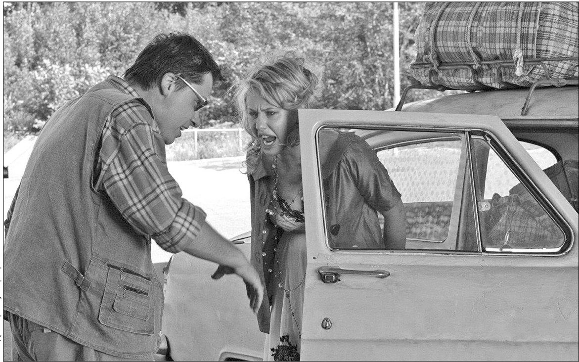
Кадр з фільму "Артефакт"

Про фільм хочеться сказати щось добре, але немає чого: такої невразної, бездарної режи-