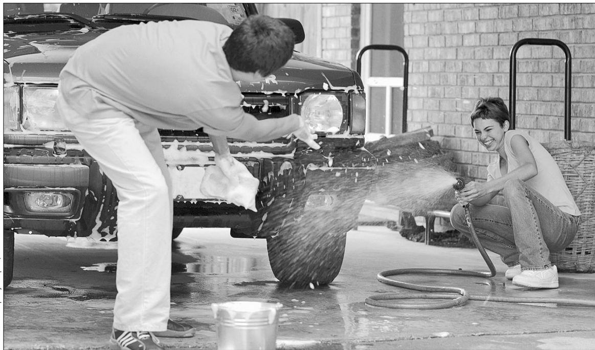
Від штрафу не вдається відбитися навіть за допомогою шлангу