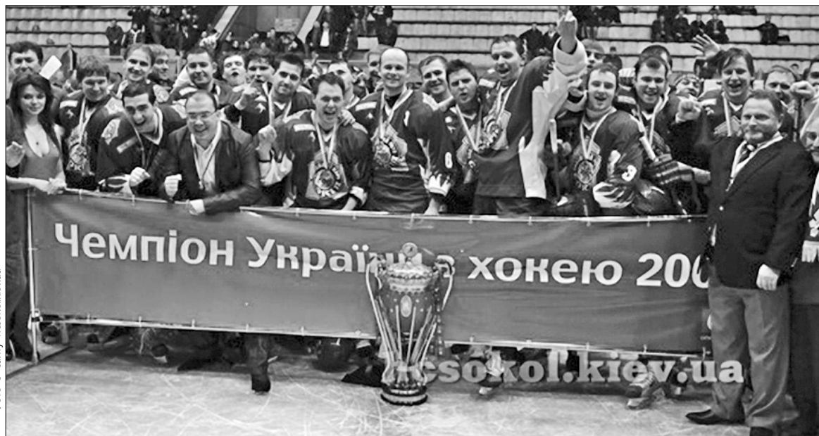
Хокеїсти київського “Сокола” святкують здобуття одинадцятого в історії титулу кращої команди України

Сімнадцятий за ліком чемпіонат України з хокею зібрав рекордну кількість команд — тринадцять. Їх могло бути на дві більше, але хокейні клуби “Луцьк” і “Рівне” відмовилися від участі в першості. Учасників змагань було розбито на три дивізіони: центральний (п’ять команд), західний (три) та східний (п’ять), у яких спочатку зіграли матчі регулярного чемпіонату. Після його закінчення клуби західного і східного дивізіонів провели матчі першого і другого кваліфікаційних раундів, за результатами