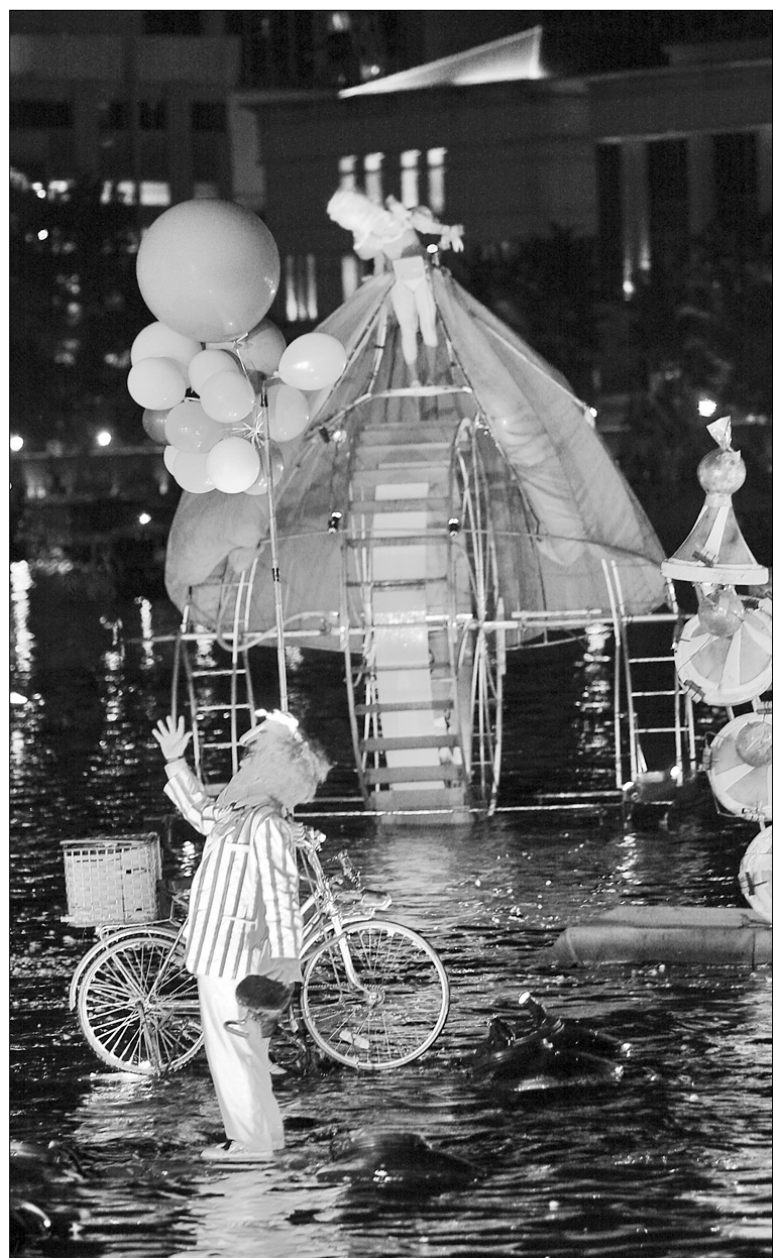
Цього року дійство, яке представить французький театр “Ілтопі”, розгорнеться на воді

Кінопрограма складатиметься із “Фестивалю допрем'єрних показів”, де покажуть п'ять новинок французького кіновиробництва. Він проходитиме з 9 по 13 квітня в кінотеатрі “Україна”. А для справжніх кіногурманів запропонують нічний 6-годинний сеанс найсвіжіших професійних і студентських короткометражок “Довга ніч... короткого метражу”. Також у рамках фестивалю відбудеться ретроспектива фільмів кінокласика Жака Демі. Окрім його найвідоміших стрічок, таких як “Шербурзькі парасольки” із Катрін Денюв у головній ролі, “Дівчата з Рошфора” 1966 року, “Франція” 1970, покажуть фільм дружини Демі Аньєс Варда “Малий Жак із Нанта”, присвячену життю і творчості чоловіка. Серед літературних заходів заплановано зустріч із поетом Жоелем Верне, з письменницею Мартін Ле Коз, а також презентація українського перекладу роману Маргарити Дюрас “Коханець”. Отже, програма фестивалю “Французька весна в Україні” обіцяє задовольнити найвибагливіші мистецькі смаки. Залишається тільки її дочекатися ●