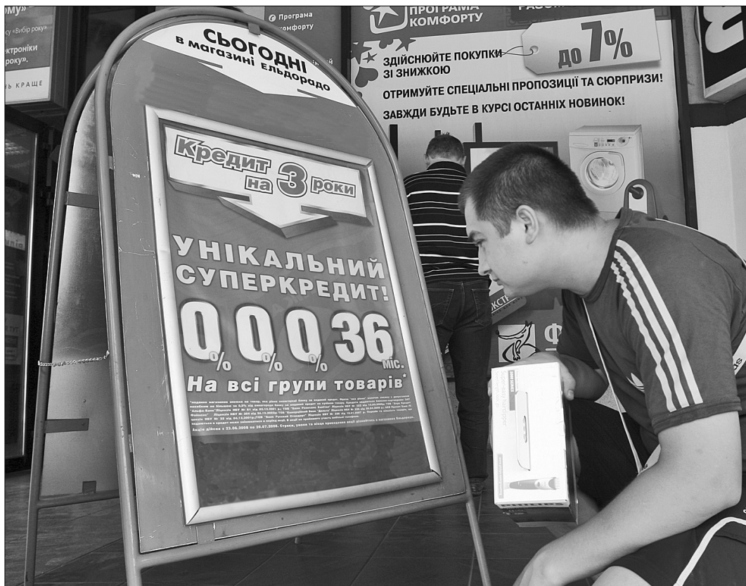
Про дешеві кредити містянам можна забути до кінця цього року