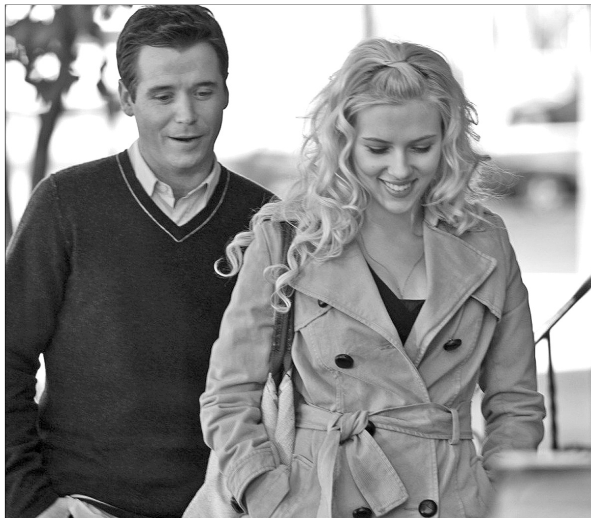
Стрічка рекордна бодай тому, що тут кожен третій актор — голлівудська кінозірка

У фільмі три сюжетні лінії, що доволі слабко переплітаються. У першій йдеться про те, як одружений чоловік випадково знайомиться в супермаркеті з білявою вчителькою йоги і, звісно, піддається спокусі зрадити дружину, котра колись змусила його одружитися, а тепер цілком зайнята ремонтом квартири. Друга історія про молодого жінку, котра залишила свого хлопця — за сім років спільного життя він так і не освідчився їй — не розуміючи, як штамп у паспорті може щось змінити у їхніх стосунках. Нарешті третя сюжетна лінія описує, як шукає свою половинку