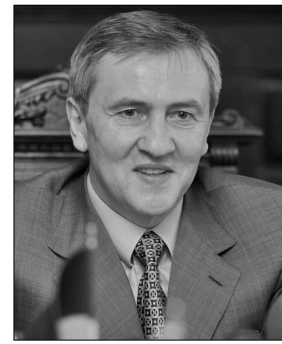
Київський міський голова Леонід Черновецький