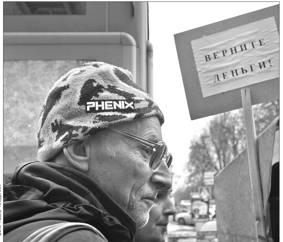
Громадяни України готові відстоювати свої права

Акції під проводом антикризового центру відбувалися в три етапи. Спершу громадськість вимагала через своїх представників ухвалення надзвичайної програми порятунку внесків населення у банках і прямого президентського правління, потім 13 березня у столиці відбувся масовий антикризовий марш, учасники якого подали органам свої вимоги. Серед