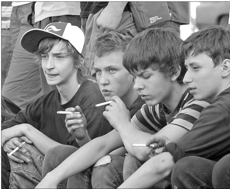
Місто хоче захистити дітей від шкідливого впливу дорослих

За словами начальника Головного управління з питань торгівлі та побуту Василя Щербенка, нині в місті зареєстровано 5 виробників алкогольних напоїв, 63 суб'єкти підприємницької діяльності, які мають ліцензії на торгівлю алкогольними напоями. То-