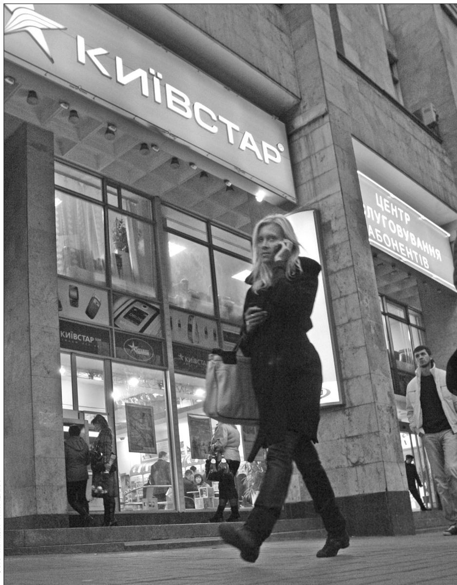
Пересічні споживачі не дуже переймаються протистоянням між акціонерами "Київстару"