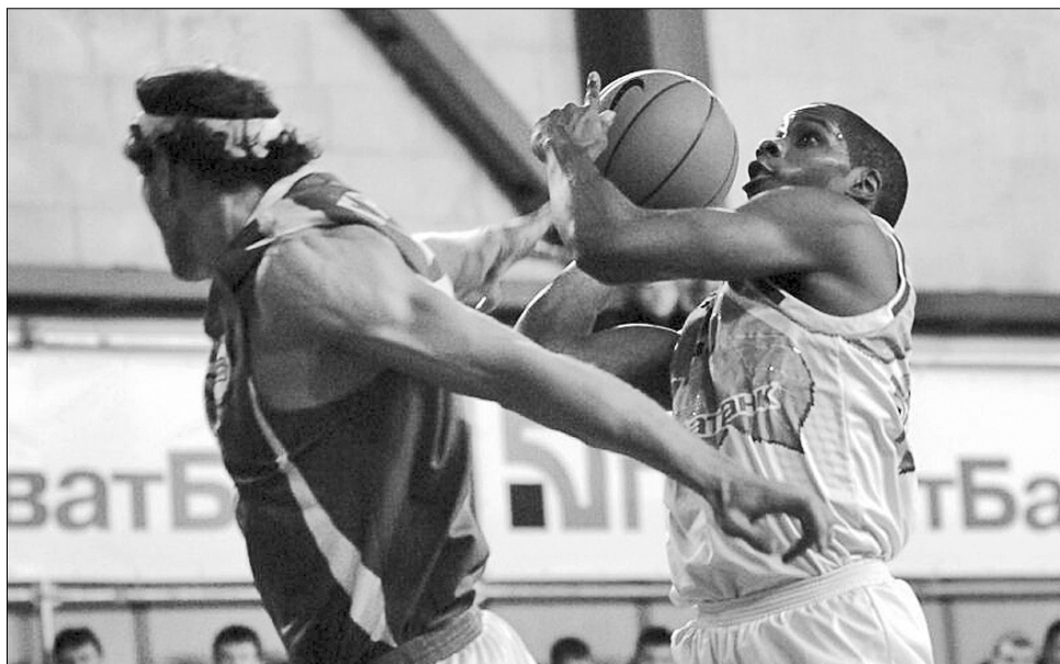
У матчі "Будівельник" — "Політехніка — Галичина" пристрасті часом били через край