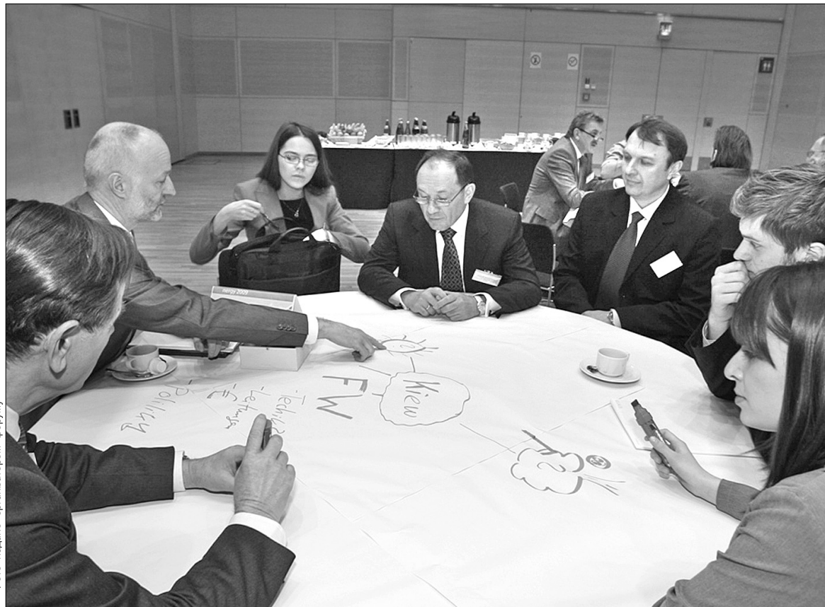
Перший заступник київського мера Анатолій Голубченко розповів закордонним колегам про ситуацію у Києві

Темою Віденського міжнародного форуму Viennegy-2009 цього року стало фінансування муніципальної енергетичної інфраструктури. Учасники — представники профільних енергетичних підприємств та органів місцевого управління Австрії, Німеччини, Угорщини, Бельгії, Франції, Словаччини — презентували власні енергозбережні проекти. Нині Європа зіштовхнулася зі зростанням енергоспоживання: згідно з даними досліджень, до 2020 року використання цього ресурсу збільшиться на 25 відсотків. "Європа сьогодні живе тими ж проблемами, що і Київ", — підсумував результат форуму очільник делегації — перший заступник голови КМДА Анатолій Голубченко. — "Сьогодні увесь світ ступив на стежку екологічної без-