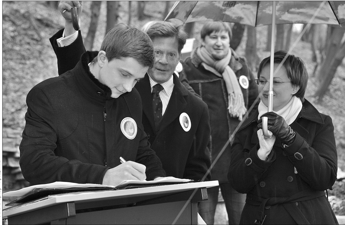
Секретар Київради Олесь Довгий підтримав акцію особистою участю

6 березня у Києві відбулося урочисте відкриття першого відновленого природного джерела в рамках міжнародного екологічного проекту "Кожна краплина має значення". Джерело віднайдено в Голосіївському районі Києва на вулиці Кайсарова. Воно має важливу історичну цінність, адже живить підземний басейн річки Либідь. Секретар Київради Олесь Довгий переконаний, що акція, яка відбулася в столиці, стане взірцем співпраці міжнародної організації, міської влади та соціально відповідального бізнесу.