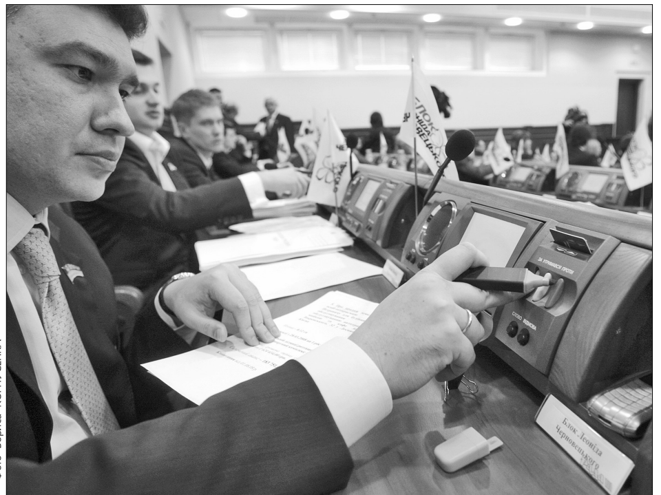
Бюджет Києва на 2009 рік — в добру путь