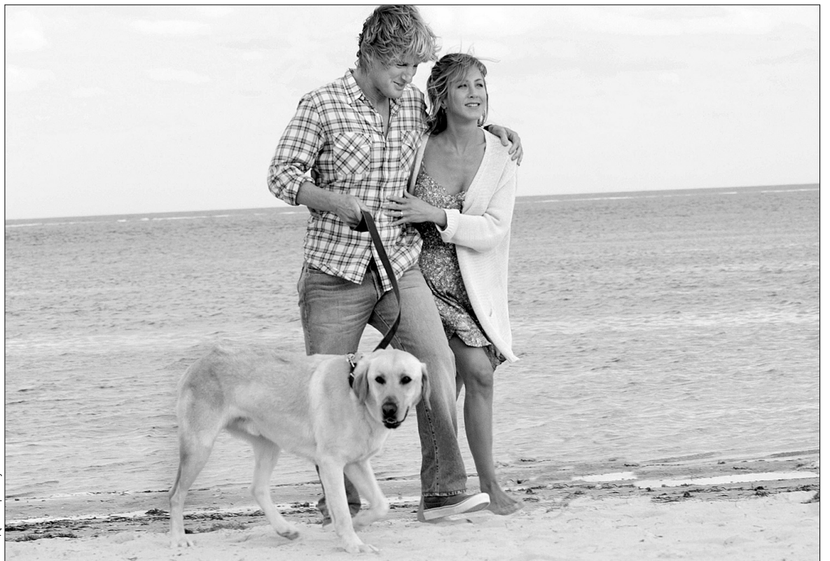
Кадр із фільму

У фільмі переважає сентиментальний тон, і це закономірно: в основу сценарію покладений проникливий мемуар-бестселер Джона Грогена, американського журналіста і публіциста, який надзвичайно душевно описав своє спільне життя з домашнім улюбленцем. За екранізацію книги узявся Девід Френкел, чий “Диявол носить Prada” став одним з головних успіхів 2006 року. Але найбільша приманка цього фільму — це актори, задіяні в головних ролях: Дженніфер Еністон і Оуен Уїлсон. Зірка серіалу “Друзі” не знімалася в кіно вже майже три роки, і глядачі встигли неабияк за нею скучити. З Уїлсоном історія інша — “Марлі