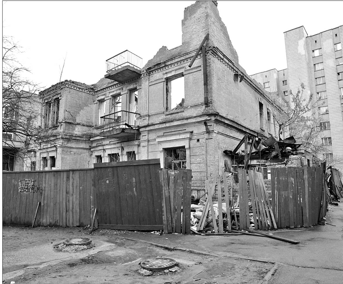
На місці напівзруйнованої аварійної будівлі на вулиці Панаса Мирного, 22 незабаром зведуть сучасну офісну шестиповерхівку