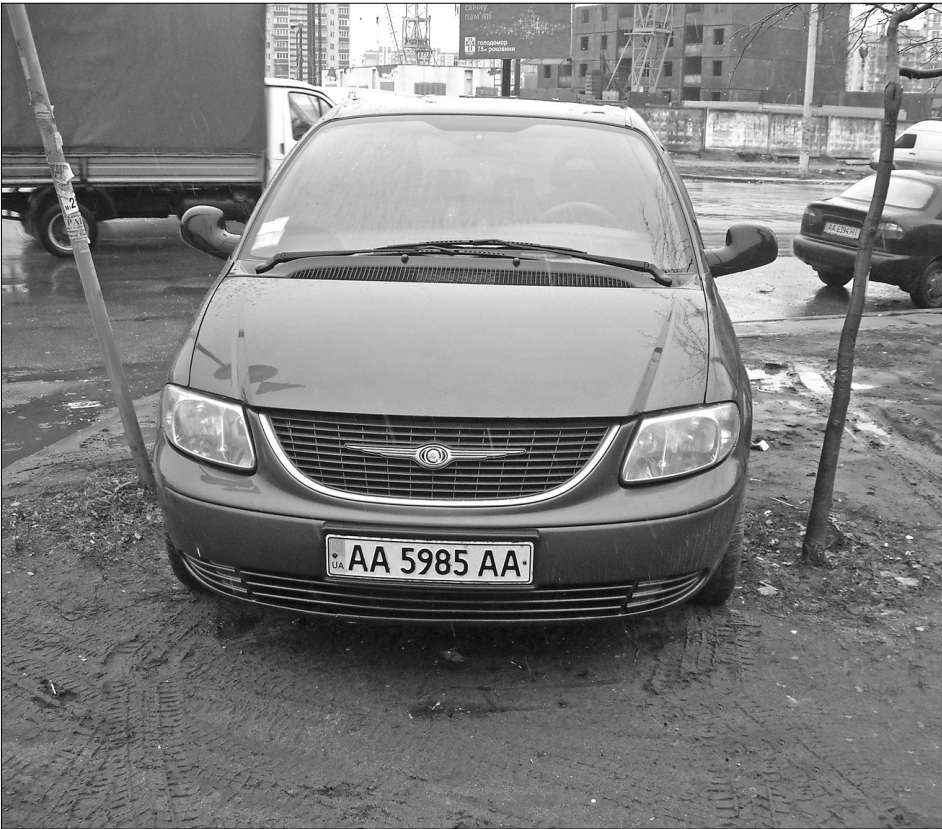
Деякі водії вирулюють на газони навіть попри те, що доводиться "втискатися" поміж молодими деревами та стовпчиками дорожніх знаків

За припарковане авто в зоні зелених насаджень штрафуватимуть на 450 грн