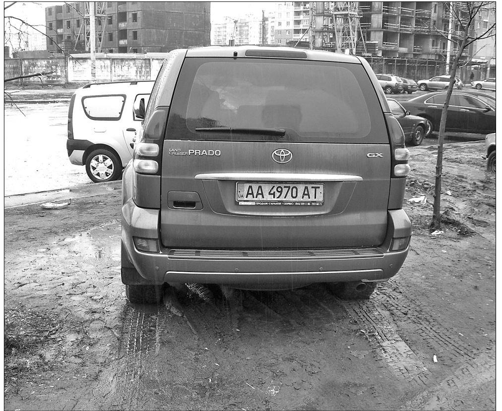
Власники розкішних джипів полюбляють паркуватися не на пристойних парковках, а в нещодавно насаджених зелених зонах