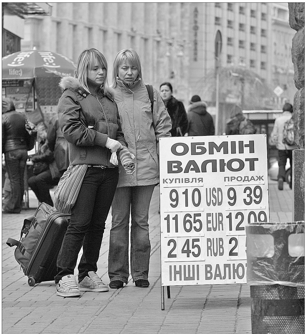
Нестабільність курсових коливань не додає оптимізму містянам