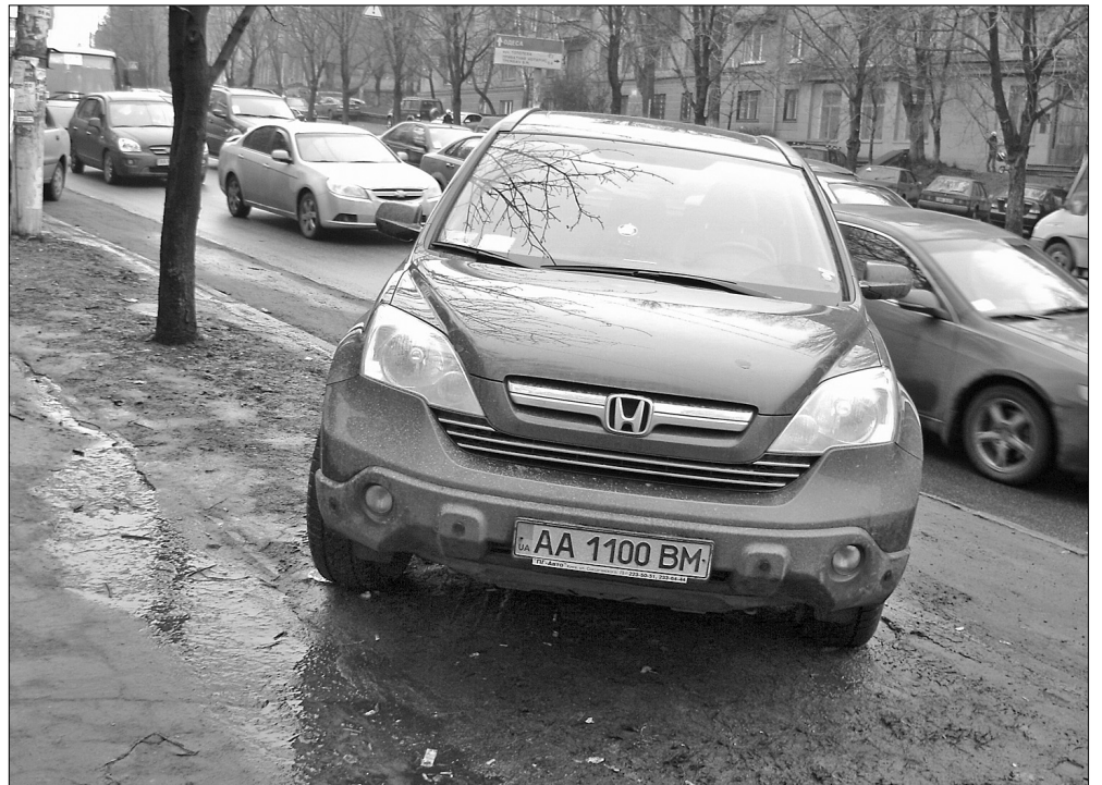
Найбільше страждають від порушників паркування зелені "доріжки" поміж трасою та тротуаром