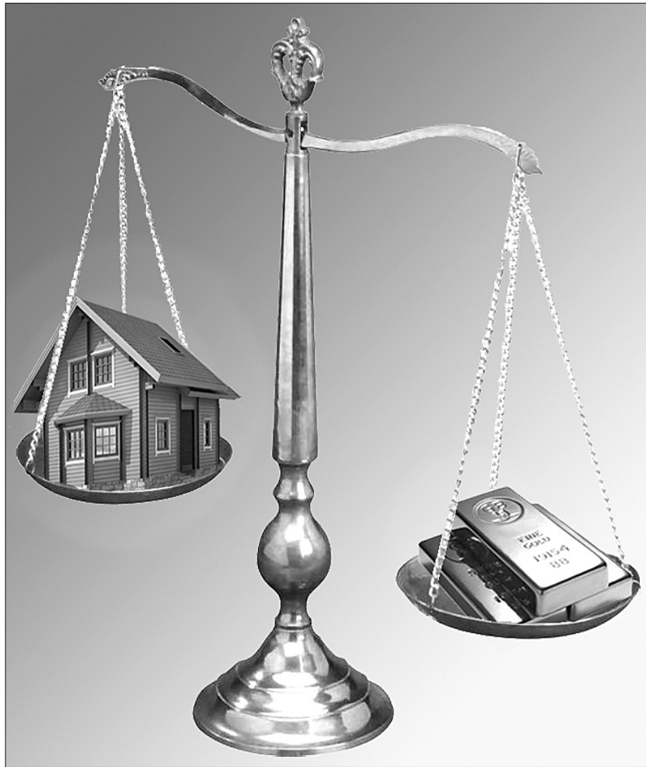
Експерти радять вкладати кошти саме в золото — далі воно лише дорожчатиме

"Імперія успіху", найближчими роками вартість однієї унції золота може зрости не до $900 — 1200, як передбачалося раніше, а до $5 тис. і навіть більше. Такий розвиток подій може спричинити скуповування золота інвестором, які прагнуть захиститися від зростання інфляції, що вже спостерігається.