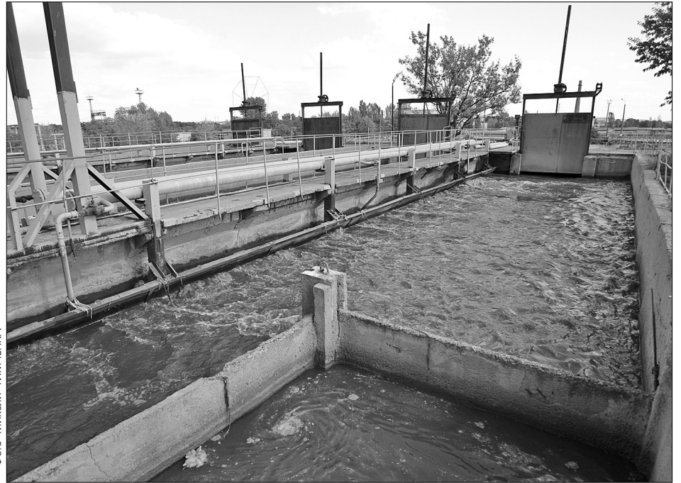
Через застаріле обладнання на Бортницькій станції аерації постійно трапляються прориви та витік стічних вод