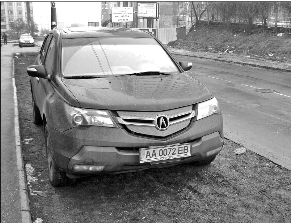
Дехто просто "сплутав" газон із власною парковкою і зайняв на травичку чотирма колесами