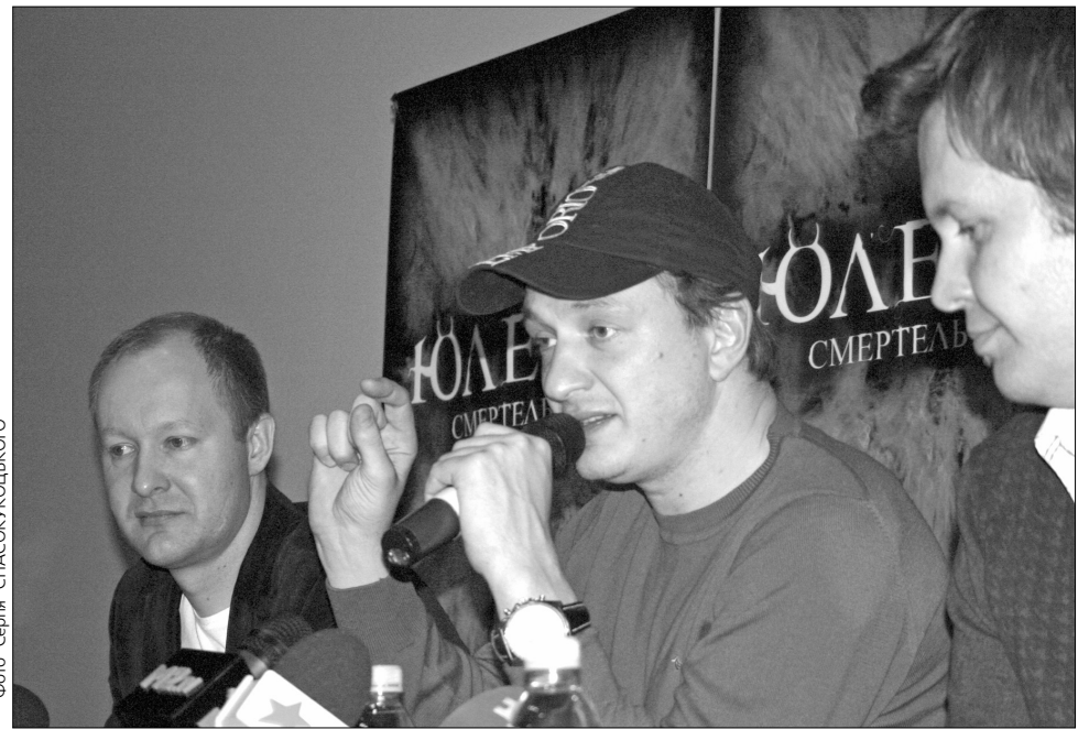
Марат Башаров на прем'єрі в Києві не втомлювався повторювати, що головне завдання "Юленьки" — застерегти людей від зради, яка приносить горе рідним та близьким

Фільм знімали в Ялті. За сюжетом через хворобу дружини Лери (Оксана Лаврентьева) герой Марата Башарова Андрій Белов переїздить із сім'єю у провінцію. Колишній професор столичного університету тут влаштовується викладачем у жіночу гімназію. Згодом дізнається, що в класі, де його призначено керівником, не так давно загинула дівчинка. Намагаючись з'ясувати подробиці загадкової смерті, Белов виявляє не менш цікавий феномен: най-