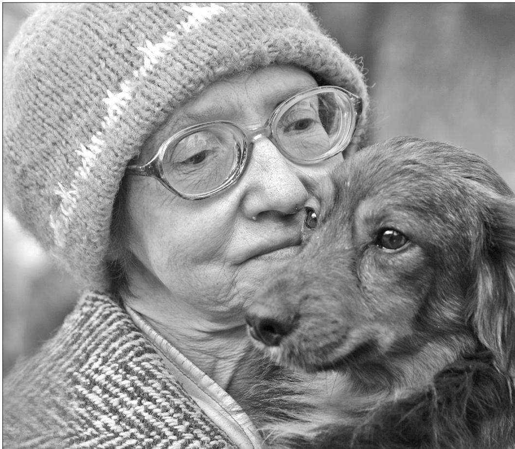
Економічна криза та помилки уряду можуть призвести до зубожіння та злиднів більшості громадян

Як стало відомо "Хрещатику", реальний спад ВВП в нинішньому році може становити майже 20 % ВВП. Попри заяви прем'єр-міністра про стабілізацію ситуації в економіці країни та перевиконання показників Державного бюджету-2009 з початку року, макроекономічна динаміка продовжує погіршуватися. А спад виробництва вже за окремими показниками побив історичні рекорди. Експерти припускають, якщо така ситуація триватиме і надалі, через розбалансованість державного бюджету, країну можуть оголосити банкрутом.