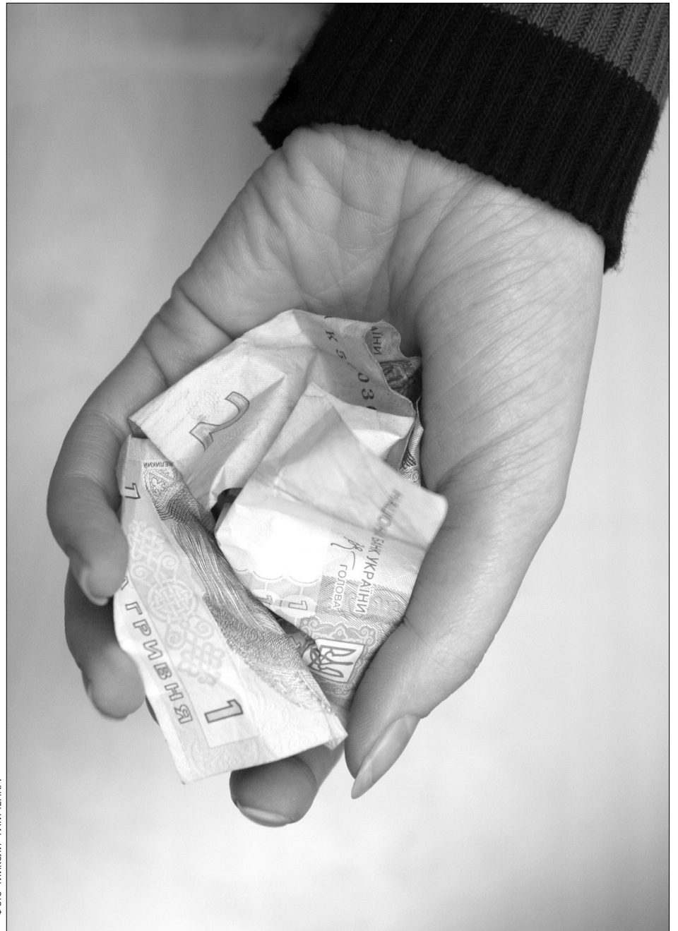
Через поглиблення кризи триває зниження національної валюти