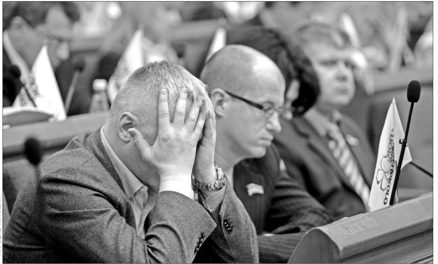
Депутатам довелося довго міркувати, як правильно розподілити "пошматований" урядом столичний бюджет