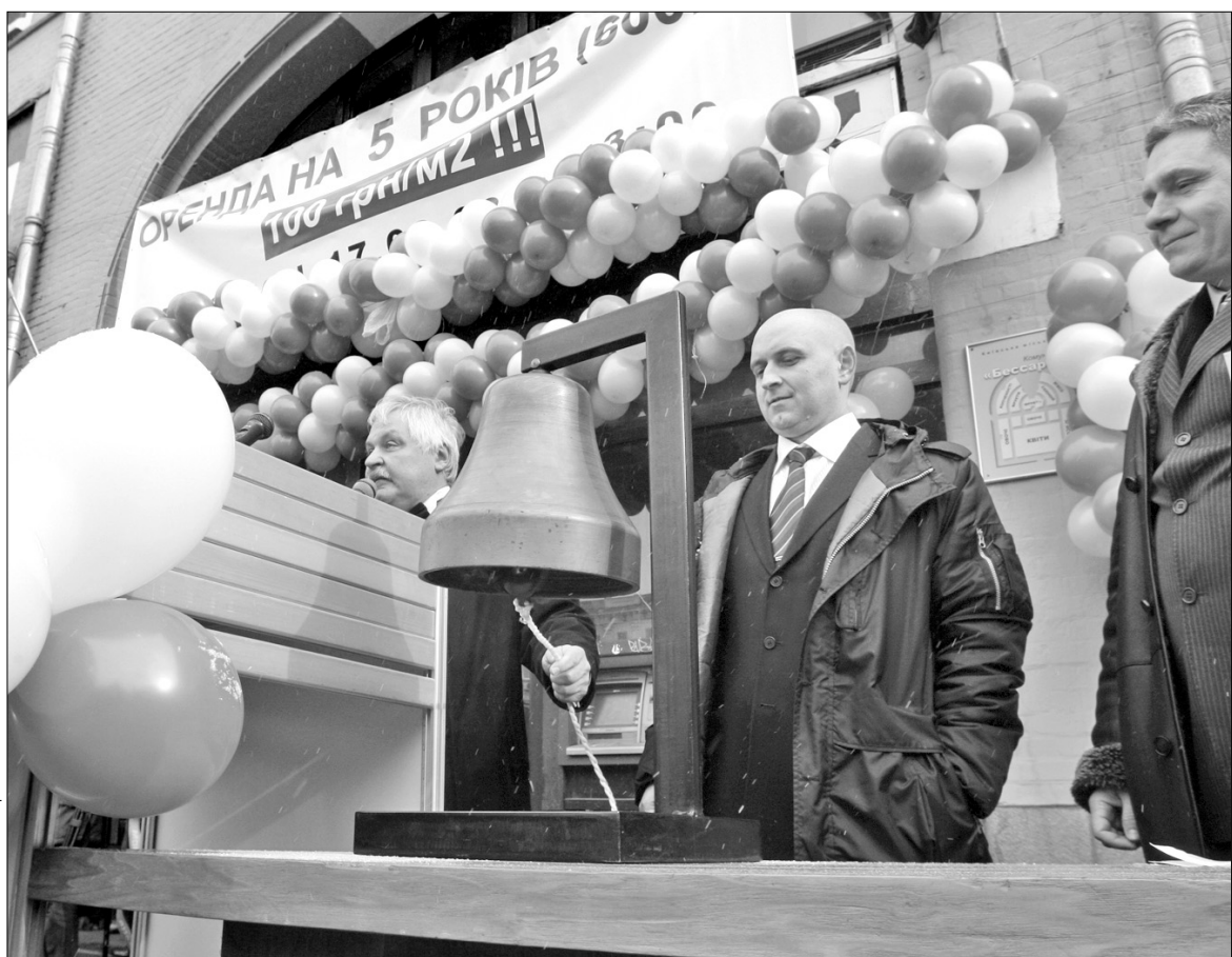
Аукціон на право оренди частини Бессарабського ринку в центрі столиці для створення продуктового магазину пройшов у святковому настрої

Стартова ціна частини Бессарабки становила 800 тис. грн. Але це гроші лише за право орендувати приміщення. За саму ж оренду доведеться платити щомі-