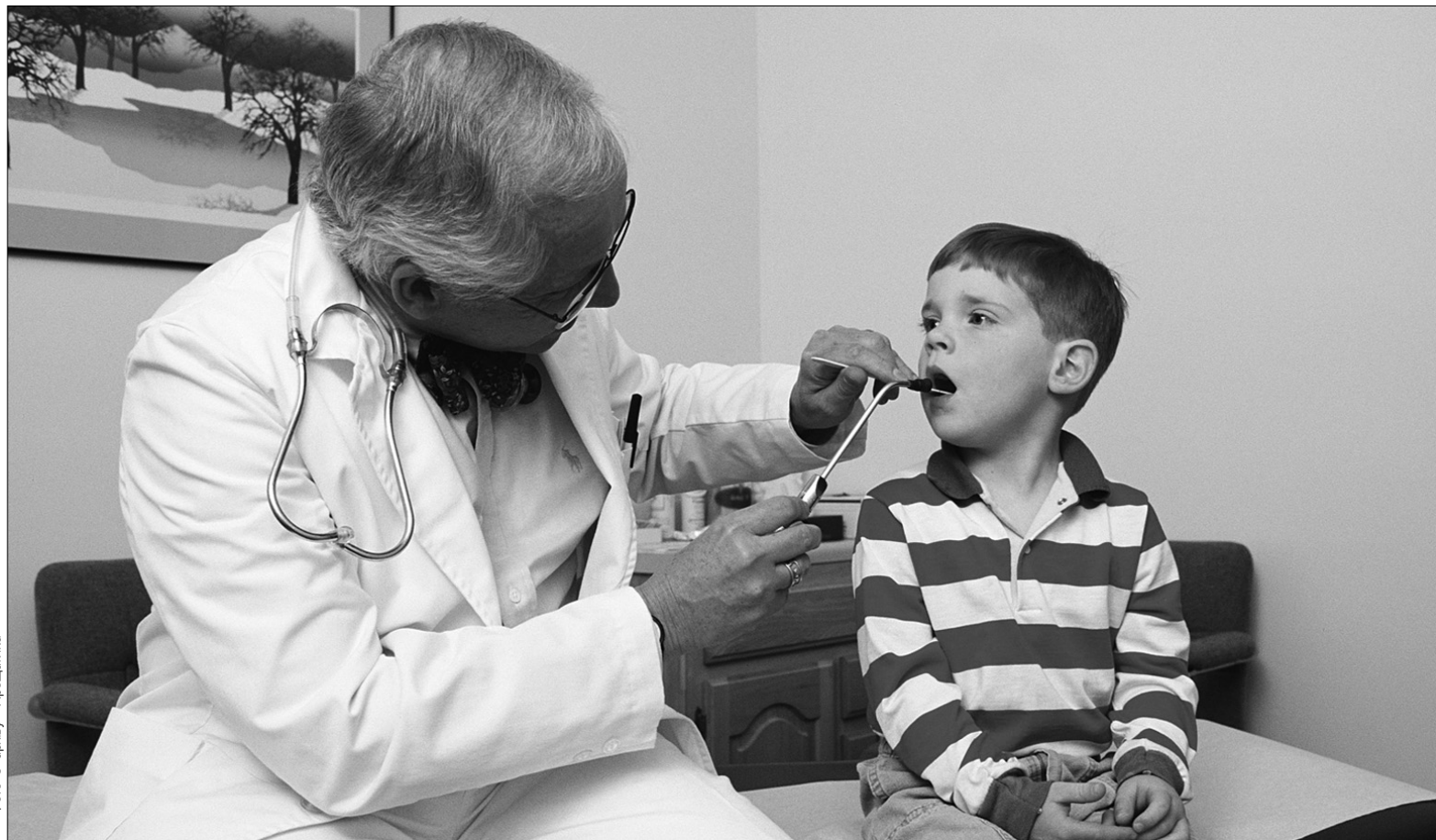
У разі з'яви перших симптомів хвороби викликайте лікаря і не займайтеся самолікуванням

Пийте багато рідини. Її рекомендують випивати не менше двох літрів на добу. Найкраще вживати теплі кислуваті напої — компоти, соки, морси, чай з лимоном, відвар шипшини. Велика кількість рідини зменшить інтоксикацію — продукти життєдіяльності вірусів, що викликають слабкість, біль у м'язах і головний біль, виводяться з рідиною через нирки. Рідина також допомагає розрідити мокротиння і компенсувати втрату води. Якщо, знижуючи температуру, ви п'єте чай з малиною (а це найкращий натуральний жарознижувачий засіб), то й інших напоїв повинно бути в достатній кількості, оскільки малина провокує сильне потовиділення, і важливо не допустити зневоднення організму. Під час кашлю добре допомагає тепле молоко з лужною мінеральною водою без газу, а також молоко у поєднанні з шавлією чи маслом какао.