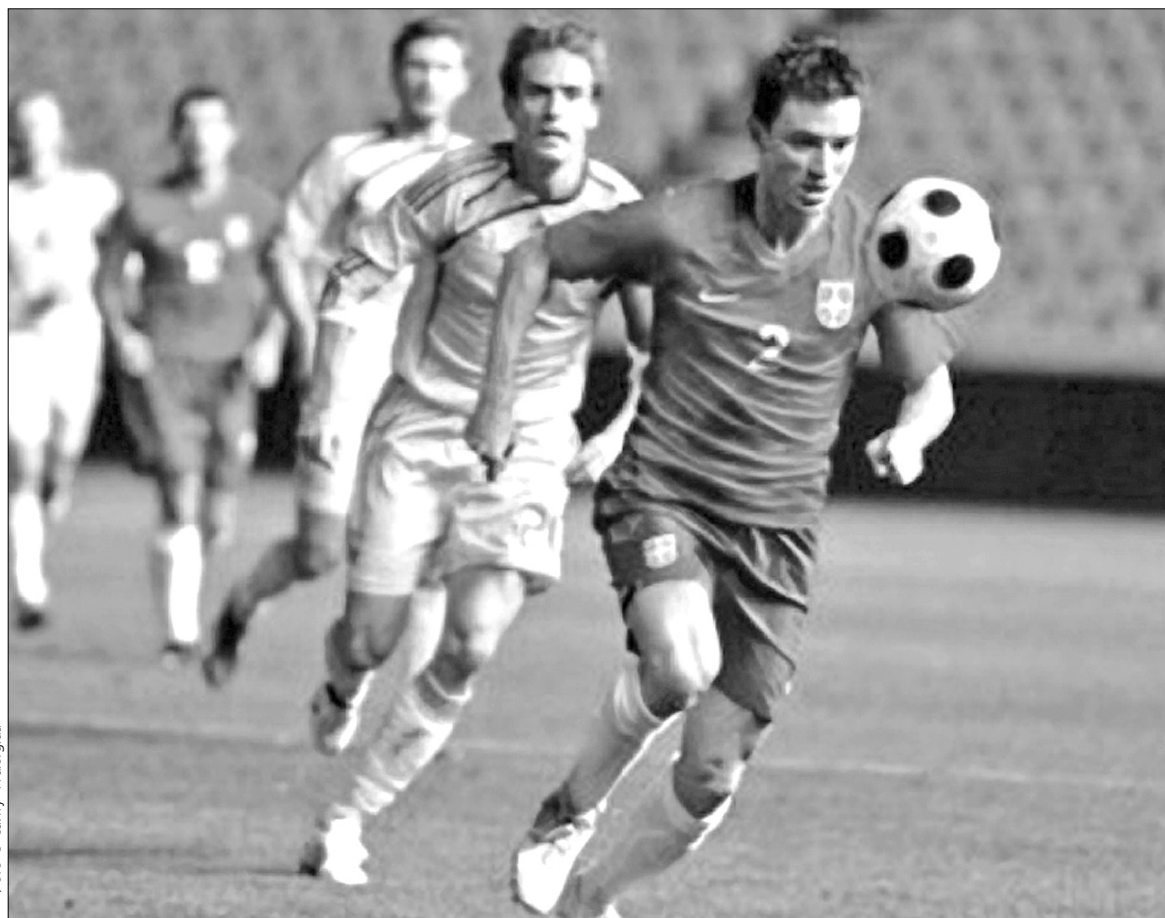
У зустрічі з Сербією українські футболісти добряче поганяли суперників із Балкан