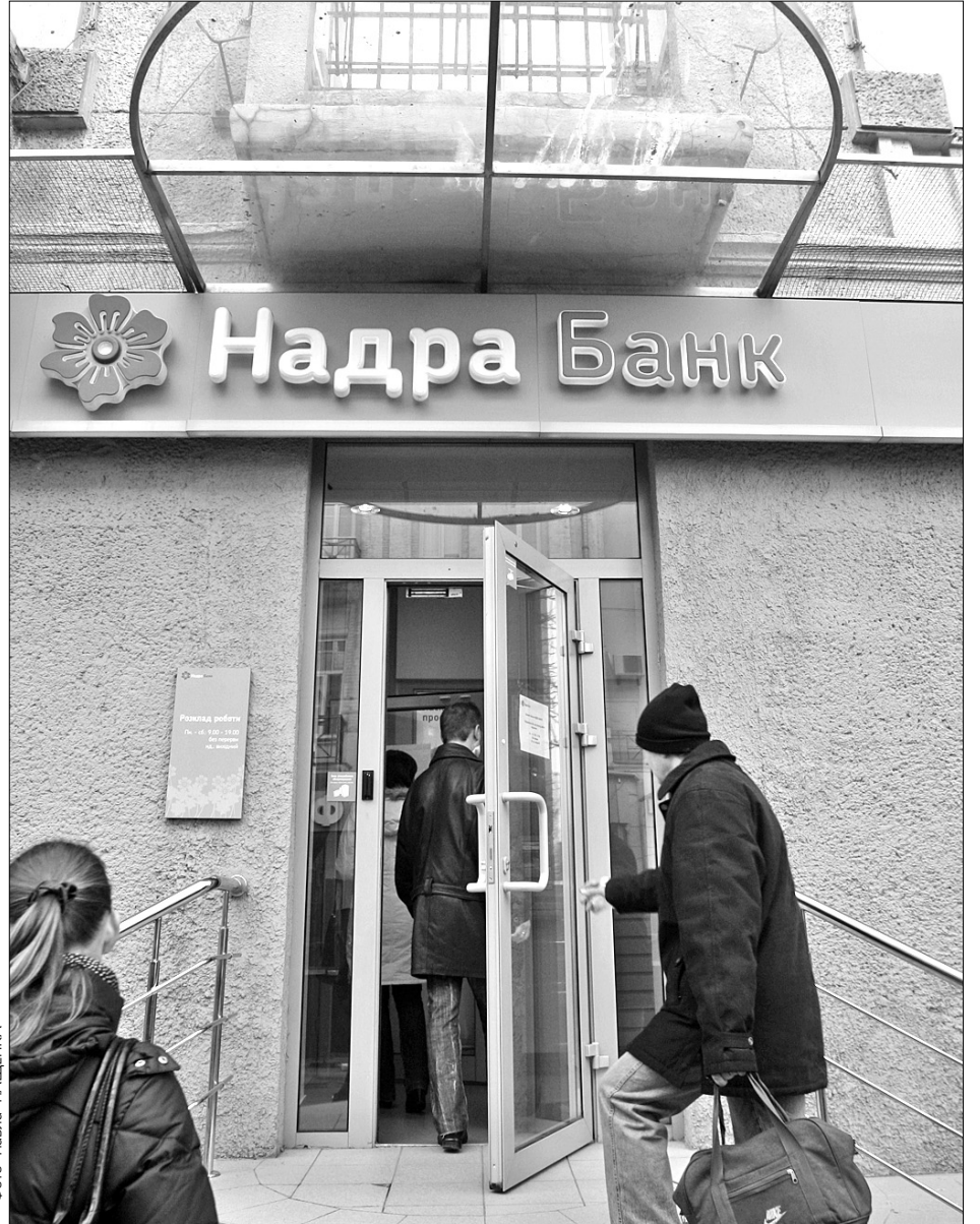
Банк “Надра” — шостий банк із тимчасовою адміністрацією НБУ і перший у черзі на націоналізацію

Варто зауважити, що, на відміну від п’яти інших банків, які перейшли під контроль НБУ за останні п’ять місяців, “Надра” був найпублічнішим. Окрім того, саме цей банк забезпечує виплату більшої частини пенсій, зарплат та стипендій у