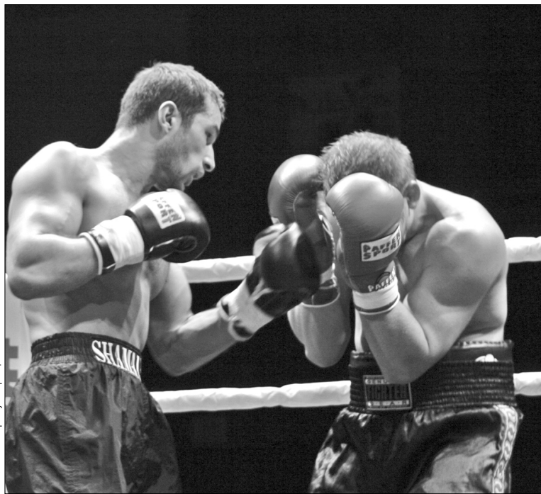
Спортсмени клубу "Еліт-боксинг" активно готуються до змагань

перегляд любителів, які мають шанс стати членами одного з найавторитетніших боксерських клубів столиці. Поєдинки міжнародного турніру відбудуться у семи вагових категоріях. На змагання запрошено боксерів із багатьох країн як ближнього, так і дальнього зарубіжжя. Бої будуть рейтинговими, тому в кожного спортсмена є чудова нагода піднятися вище у шаблях світової боксерської ієрархії. Як розповів "Хрещатику" сам Валерій Шумак, боксерський клуб "Еліт-боксинг" має намір виставити на змагання одразу сім пар у різних