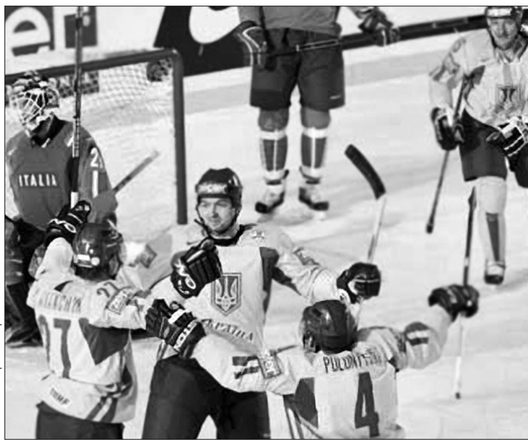
Гравці національної збірної України з хокею вже добре знають, як закидати шайби у ворота італійців

Головною ж топ-новиною прес-конференції стало призначення Анатолія Богданова консультантом збірної. Саме під керівництвом пана Богданова, який останнім часом працював у Фінляндії, наша хокейна команда виступала на Зимових олімпійських іграх в американському Солт-Лейк-Сіті, де посіла в підсумку десяте місце.