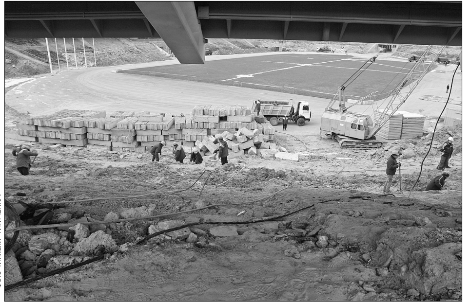
На реконструкцію головного столичного футбольного стадіону вже використали понад 18 млн євро, а ще 79 млн євро запланували влади нинішнього року

До кінця опалювального сезону кияни будуть з теплом, світлом і гарячою водою. Про роботу енергетичного комплексу міста в осінньо-зимовий період 2008 — 2009 років йшлося в п'ятницю на колегії столичної міськдержадміністрації. За словами начальника ГУ палива, енергетики