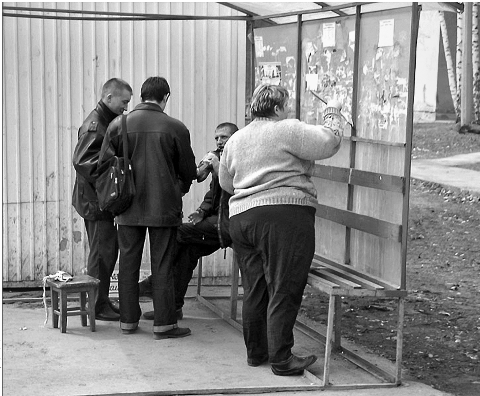
У разі дефолту весь тягар прорахунків органів влади ляже на пересічних громадян

А втім, як повідомляв "Хрещатик" (див. № 4 від 23.01.2009, № 7 від 29.01.2009), Україна не виконала низку вимог. Зокрема, в