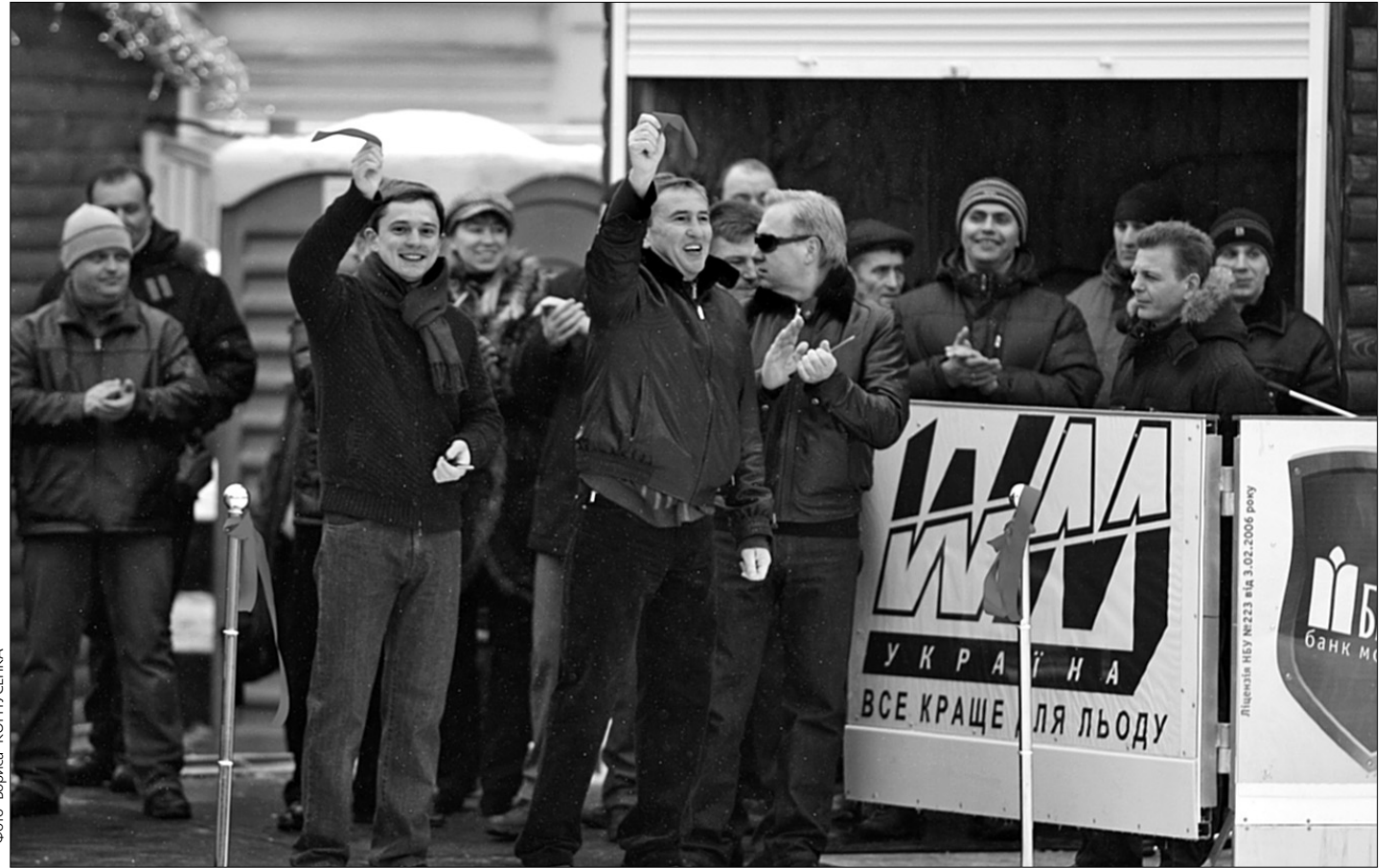
Столичний голова Леонід Черновецький разом із секретарем Київради Олесем Довгим запевнили, що відкрита ковзанка у центрі міста працюватиме краще за такі ж європейські

На центральній площі столиці мер Леонід Черновецький відкрив ковзанку