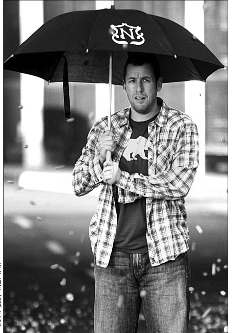
Кадр із фільму “Казки на ніч”

— Коли я знімав “Казки на ніч”, то був спокійний — приходив додому увечері, обіймав діток і почувався взірцевою людиною. Нині ж працюю над стрічкою “Смішні люди” Джад-