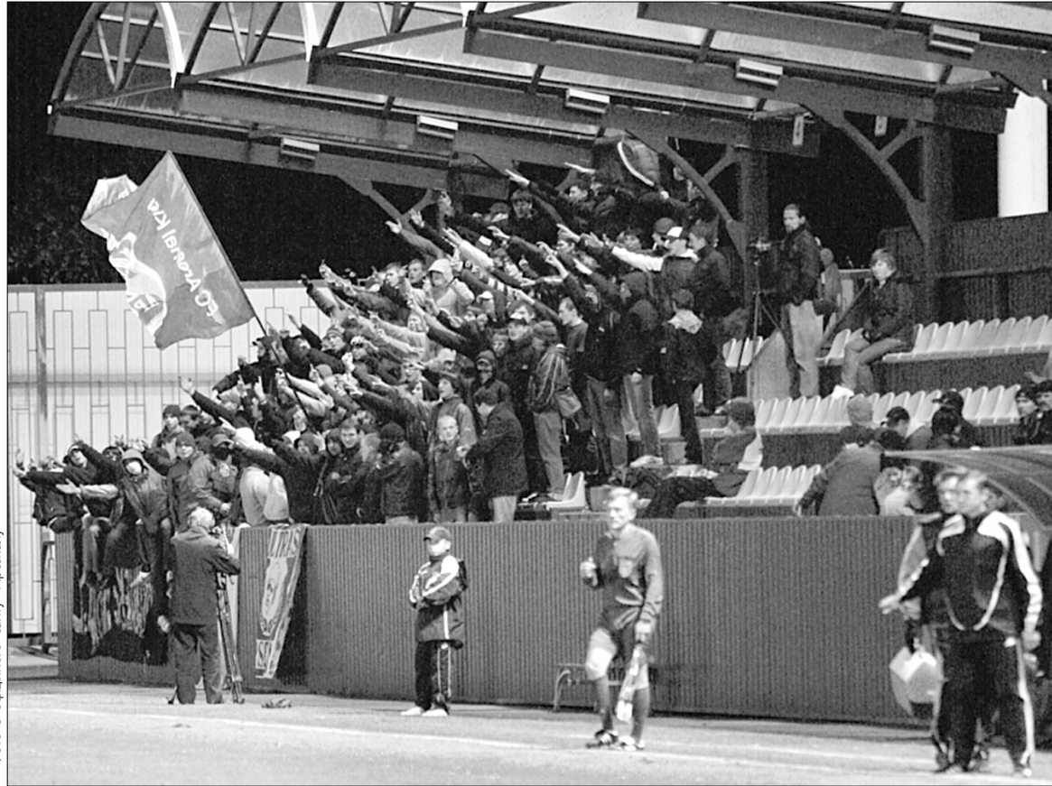
Кількість уболівальників столичного “Арсеналу” незабаром збільшиться

Однією з головних проблем “Арсеналу” є відсутність власного стадіону і тренувальної бази. Пан Черновецький пообіцяв, що проблем із цим не буде, але землі під будівництво він не збира-