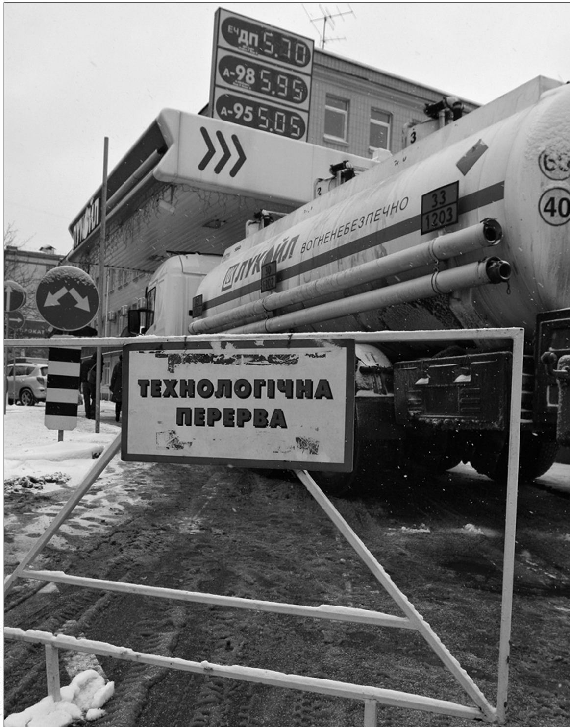
Після підняття акцизу на пальне бензин на АЗС привозитимуть у січні вже за новими цінами

Окрім того, деякі експерти, порівнюючи динаміку цін на пальне в Україні і в інших державах, не виключають, що провідні гравці ринку спекулюють на ціні бензину. "У інших країнах відбулося