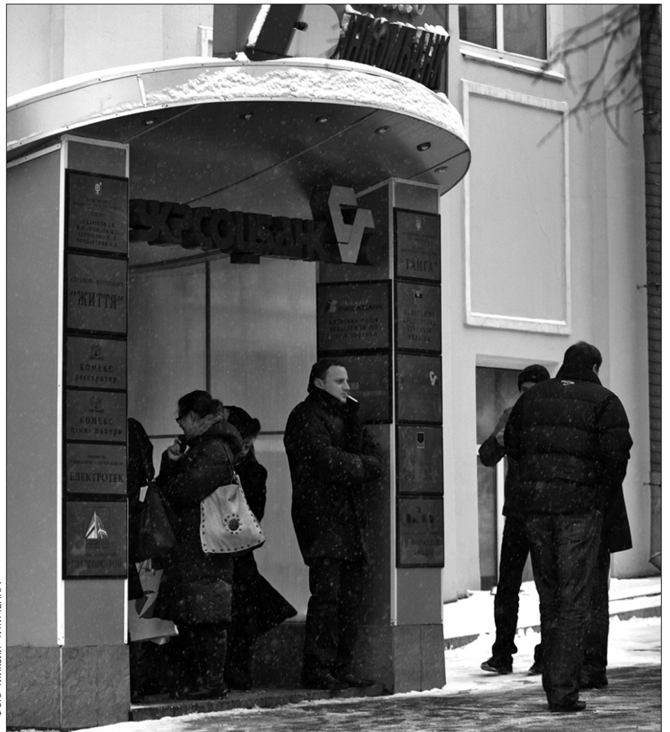
Банки через власну недалекоюглядність і жадібність змушують клієнтів переплачувати до 20 відсотків за кожний кредит

На початку року для банків ніщо не вішувало загрози: вони нарощували активи за рахунок прибутків від кредитування населення — іпотека, автокредити-