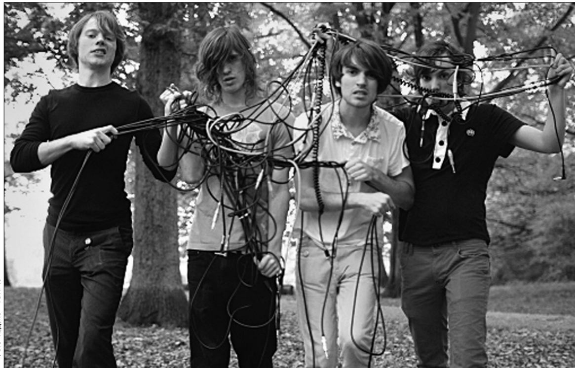
Late Of The Pier