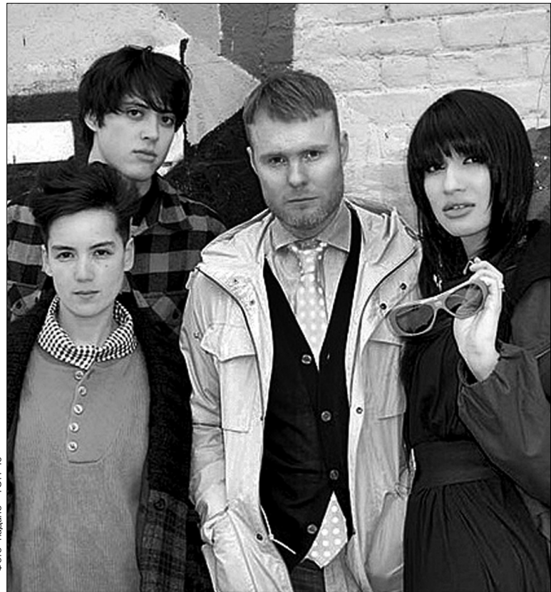
Hercules And Love Affair