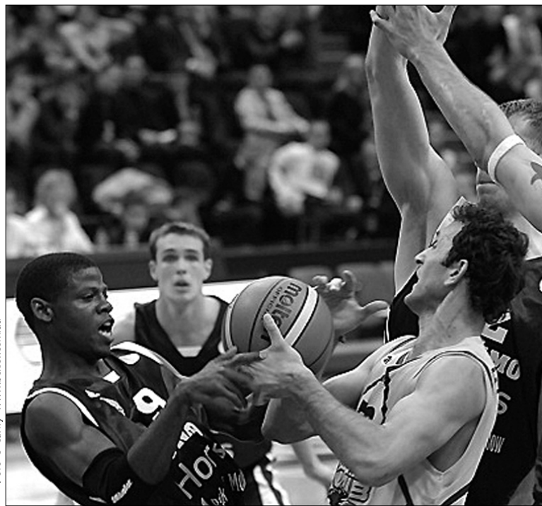
У матчі за третє місце Промо-Кубка Єдиної Ліги ВТБ між БК "Київ" та "Динамо" на майданчику було спекотно

У чвертьфіналі "беки" перемогли литовський "Жальгіріс" — 74:67, потім у 1/2 фіналу поступилися ЦСКА — 58:88 і, нарешті, в матчі за третє місце, досить