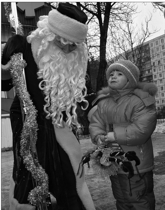
Дарницькі малюки радо зустрічали Святого Миколая

Цієї суботи на території "Дитячого пасажу", що на вулиці Малишка біля дитячого універмагу в Дарниці, Святого Миколая та Діда Мороза зі Снігуронькою зустрічали діти віком до 14 років із малозабезпечених сімей, діти-інваліди, вихованці дитсадку № 473, а також інші дітки, які проживають у Дніпровському районі столиці. Миколай із радістю послушав, як майбутні дорослі читали віршики, гралися в цікаві ігри та весело співали й танцювали. Народний депутат України Олександр Супруненко по-