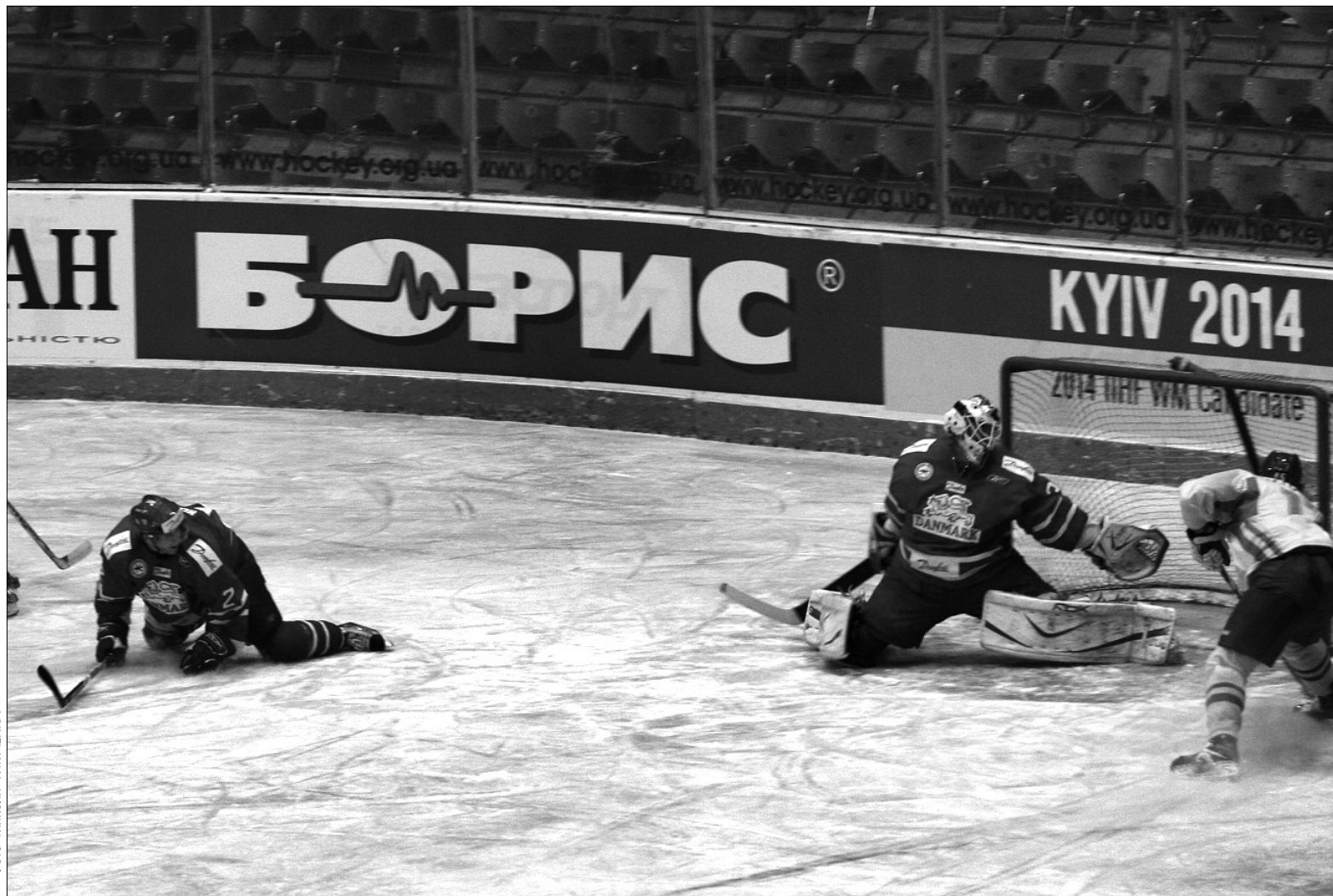
Поставити білорусів “на коліна”, на відміну від датчан, які зазнали від “синьо-жовтих” дві поразки, національна збірна України не змогла

Здивувала велика кількість охоронців у самій арені, які обшу-