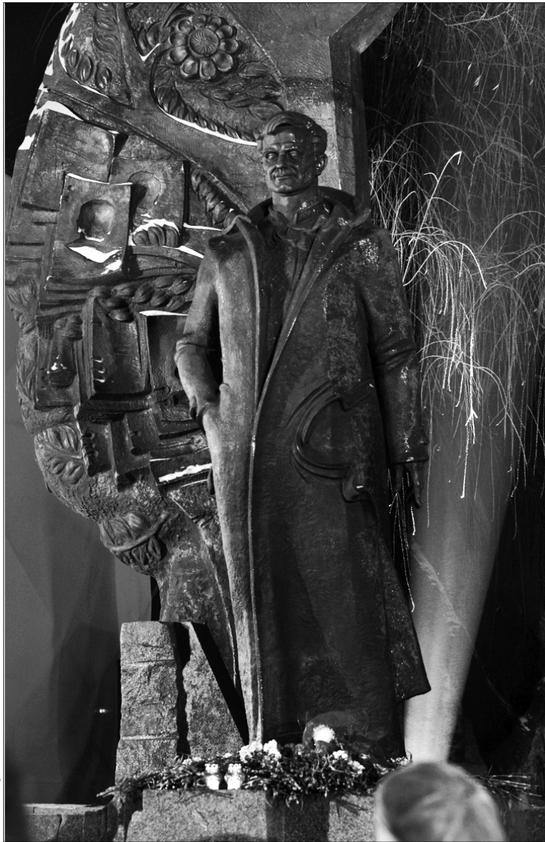
На думку людей, які добре знали Георгія Гонгадзе, скульпторам удалося відобразити характер журналіста

Цього року виповнилося вісім літ з часу зникнення журналіста Георгія Гонгадзе. Столична влада за сприяння та з ініціативи мера Києва Леоніда Черновецького увічнила світлу пам'ять видатної людини, встановивши йому та іншим майстрам пера, які загинули за свободу слова, пам'ятник у сквері біля Музею Марії Заньковецької. На його спорудження затрачено 8 млн грн. "Я щасливий з того, що мій трирічний задум реалізовано", — сказав міський голова. — Георгій Гонгадзе справжній герой, символ української незалежності, мужня людина". Назріло його ім'ям названо одну з головних вулиць столиці та навчальний заклад. Проте на цьому київські очільники зупинитися не планують. Автор найкращого матеріалу про Георгія Гонгадзе отримає премію міського голови, яку той виплачуватиме з особистих коштів. А кращі студенти факультетів журналістики країни отримуватимуть стипендії імені загиблого героя. "Ця стипендія буде значно