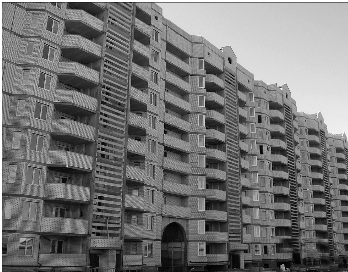
Попри кризу в будівельній галузі, компанія "Екобуд" не збирається перетворювати свої об'єкти на довгобуду