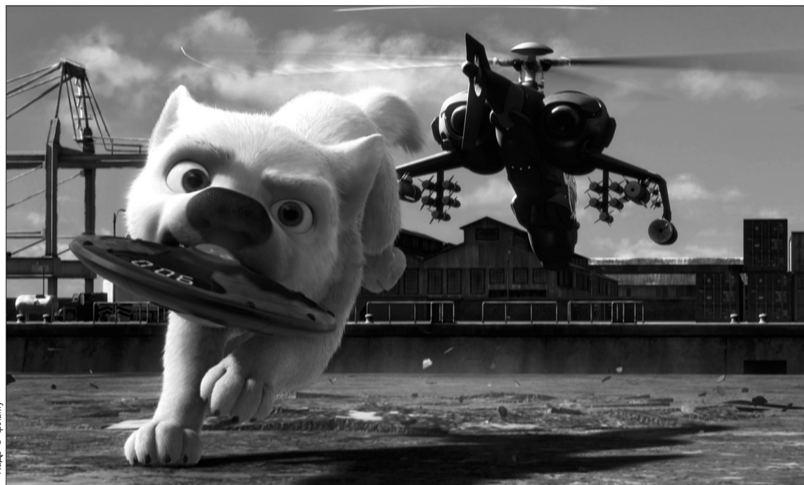
Кадр з фільму

ції загалом. Однак вони — діснеївські лише за маркетингом. Якщо ж відкинути успіх Ріхаг, то в компанії, що колись подарувала світові Міккі Мауса, з мультиплікацією була серйозна проблема ще з другої половини 1990-х — приголомшливий успіх мальованих “Аладдіна”, “Красуні та чудовиська” і “Король-лева” залишився далеко позаду, а в світі анімації, що стрімко трансформується, по-