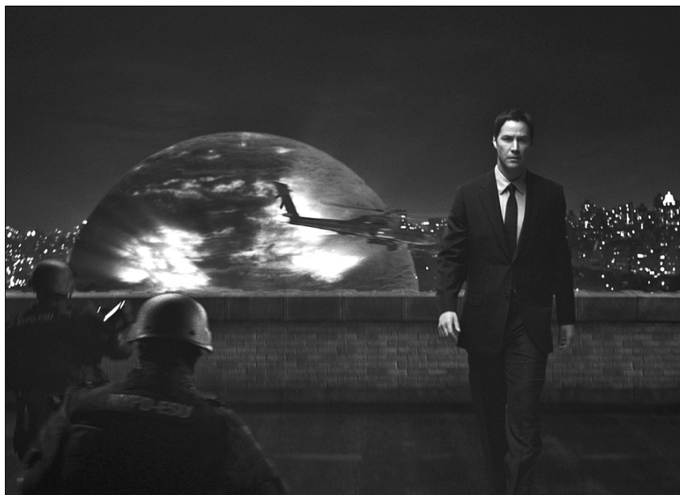
Кадр з фільму

Історія розповідала про інопланетянина Клаату, прибулого на Землю в розпал холодної війни, щоб попередити нашу планету про смертоносність атомної зброї не тільки для людства, а й для навколишніх планет. Земляни одразу ж побачили в гості агресора і відкрили по ньому вогонь тільки-но той зійшов зі своєї літаючої тарілки. А втім, Клаату не здався швидко — він, дуже схожий на простого homo sapi-