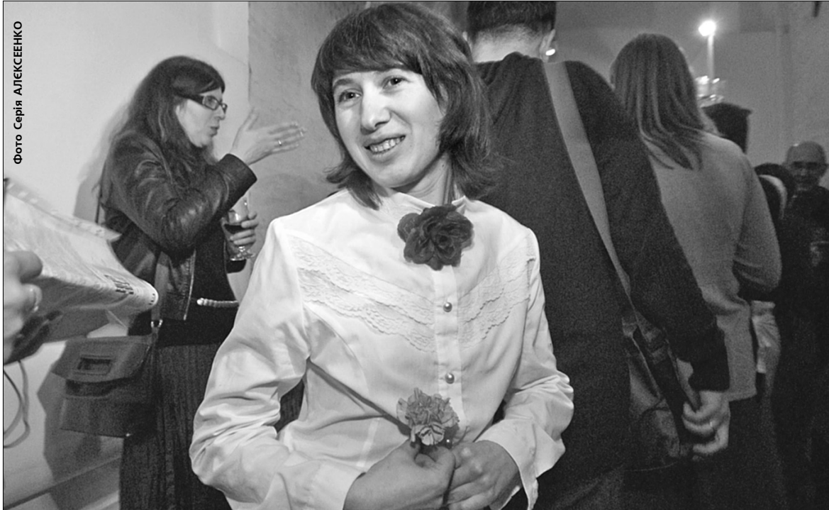
У своїй роботі «Очі мого чоловіка, як у Жанни Самарі» Алевтина Кахідзе поставила поруч відому репродукцію Огюста Ренуара «Жанна Самарі» та фотографію свого чоловіка

Киянка Алевтина Кахідзе отримала премію Малевича