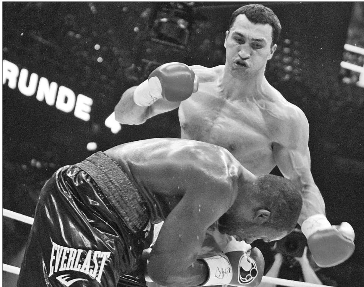
Хасим Рахман опиняється на настилі рингу після одного з могутніх ударів Володимира Кличка

Говорити можна скільки завгодно і що завгодно, але вже на зважуванні з вигляду обличчя Рахмана було видно — він боїться Володимира Кличка. Така ж думка закралася й під час виходу боксерів на ринг. Якщо український боксер вийшов на бій під оплески