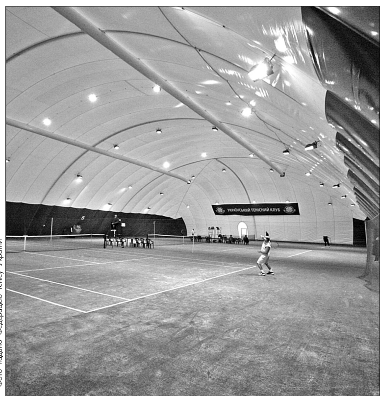
Корти спорткомплексу "Льодовий стадіон" готові прийняти всіх бажаючих займатися тенісом

Президент федерації тенісу Росії Шаміль Тарпищев відзначив, що для великих міст завжди актуальною є проблема нестачі тенісних кортів. Це насамперед б'є по дитячому тенісу: "Ми всі вихідці з радянського тенісу. Немає російського й українського тенісу. Він просто ще не міг визріти. Всі кращі тренери пройшли нашу спільну школу. І моя особиста думка, що в нас кращі тренери в світі. Їм лише потрібно створити умови для роботи. Українські тенісисти є тому прикладом. Успіхи Олени та Катерини Бондаренко, а також Сергія Стаховського змусили заговорити про