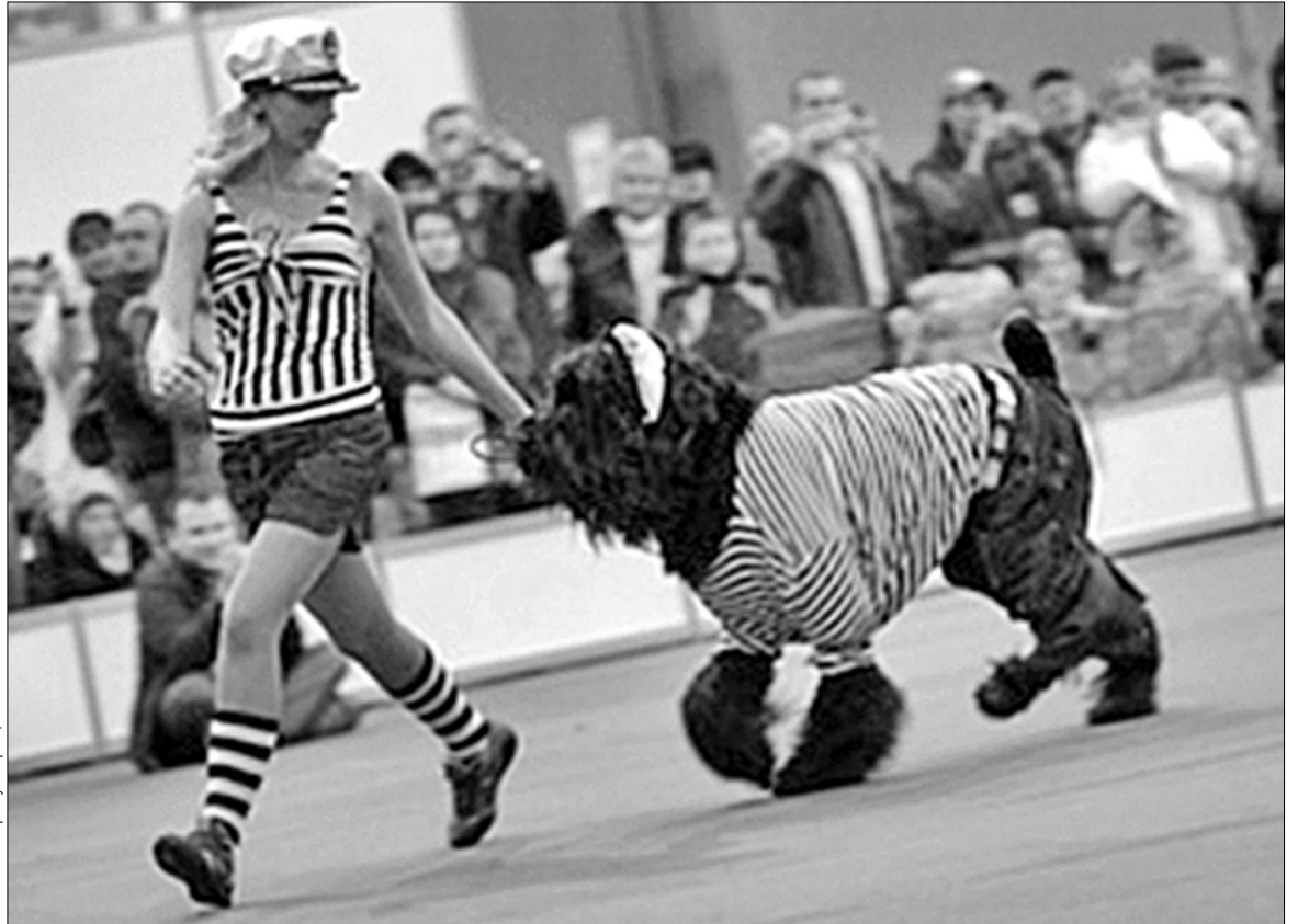
Чотирилапі друзі всіх розмірів виборювали звання найкращого

Щоб змагання були цікавими і для дітей, організатори влаштували конкурси, скажімо, на кращий костюм для собак "Гламур-Дог" чи на найкращий дитячий малюнок. Насамкінець відбулося грандіозне кінологічне шоу "Парад чемпіонів", де було представлено найкращих собак України та з-за кордону 163 порід. За словами організаторів виставок, частину коштів традиційно передають одному зі столичних дитбудинків ●