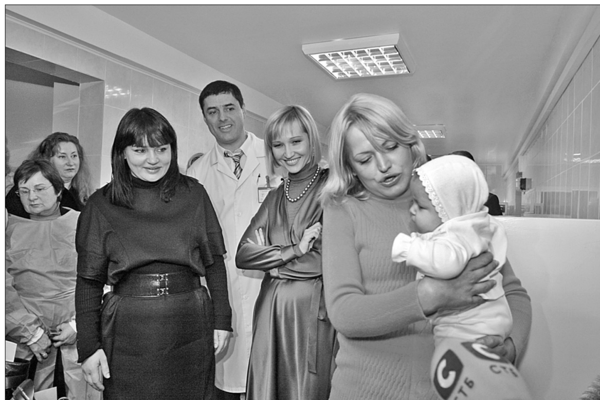
У відремонтованих палатах столичного акушерського інфекційного відділення для ВІЛ-інфікованих мам породіллям дозволять проводити перші години з малюком після народження

За 6 років в Україні кількість ВІЛ-інфікованих дітей зменшилася у чотири рази. Знизити ризик передачі вірусу від матері до дитини вдалося завдяки проведенню лікування ВІЛ-позитивних вагітних. Дотримуючись деяких правил, вони можуть у більшості випадків народити здорове немовля. Щоб їх забезпечити, у столиці провели масштабну реконструкцію акушерського інфекційного відділення для ВІЛ-позитивних мам у міському центрі репродуктивної та перинатальної медицини.