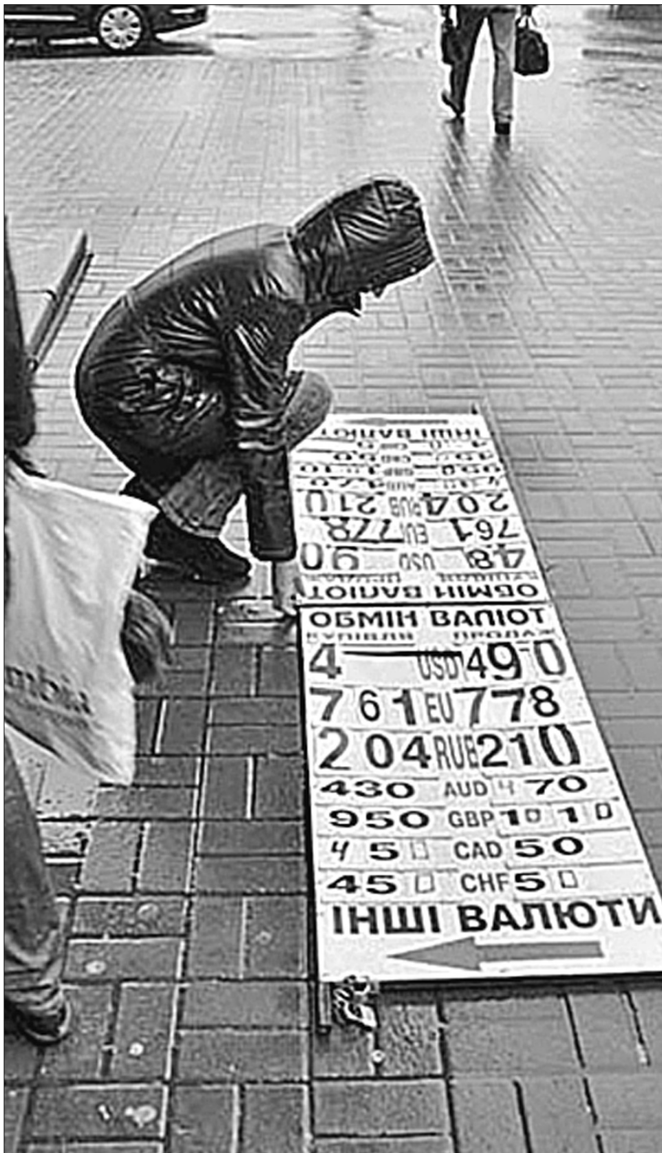
Попри негативні прогнози окремих експертів, до Нового року гривня може знову укріпитися