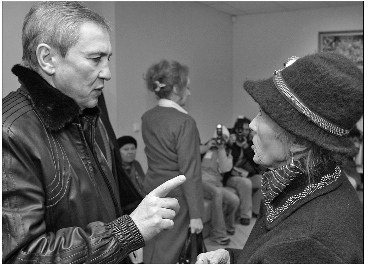
Під час відвідин «Будинку милосердя та здоров'я» Печерського району столиці мер Леонід Черновецький пообіцяв, що турбота про самотніх пенсіонерів та інвалідів завше буде у міській владі на першому місці

Організують для стареньких і свята. Наприклад, у останній день місяця влаштовують "День іменинника". Для тих, хто народився нинішнього місяця, готують подарунки та концертну програму. Кількість відвідувачів "Будинку милосердя та здоров'я" весь час зростає. А вже