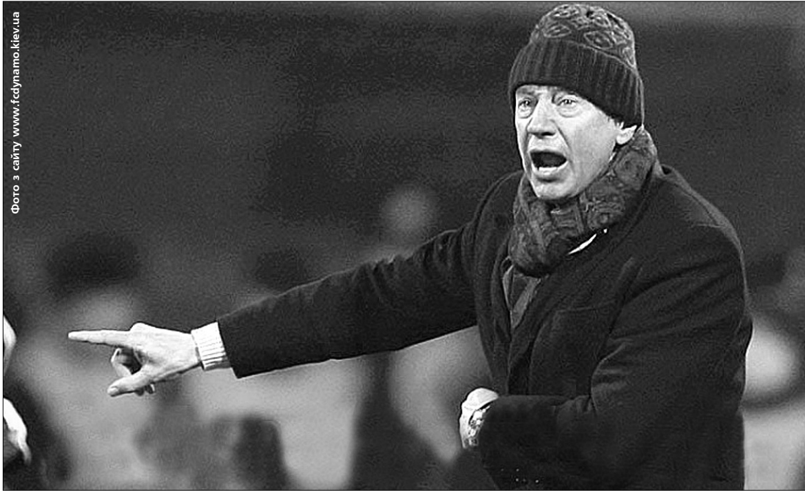
Головний тренер київського “Динамо” Юрій Сьомін завжди віддається грі сповна

Київський клуб під керівництвом Юрія Сьоміна пробився до 1/16 фіналу Кубка УЄФА