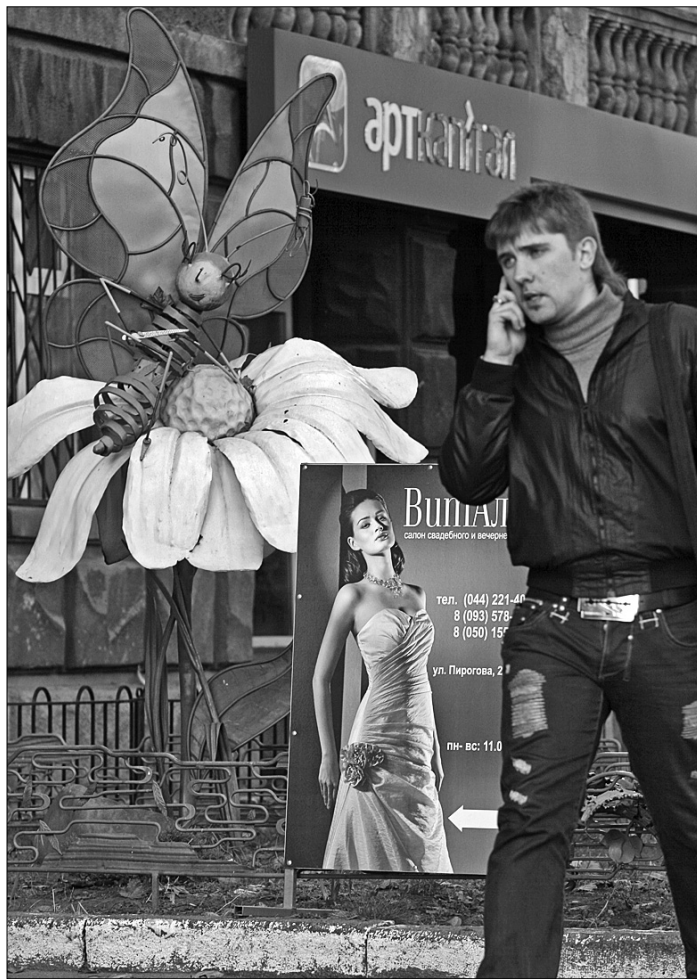
Наступного року доходи від зовнішньої реклами можуть додатково поповнити бюджет міста на 70 мільйонів гривень

Дещо в більшій мірі зросли орендні ставки на рекламу окремих носіїв. Зокрема, якщо раніше розміщення тимчасової конструкції коштувало, в залежності від її площі, 12–94 гривень, то згідно з новими тарифами ставки зросли до 40–240 гривень (150–230 %). З 47 до 100 гривень (на 113 %) подорожчала оренда вивіски, з 59 до 120 гривень (більш, ніж на 100 %) подорожчала реклама на спеціальних табло з бігучим рядком. До 200–400 гривень (на 70 %) зросла вартість використання для реклами торговельних павільйонів та кіосків. Реклама на вулиці (урни, лавки, таксофони та ін.) подорож-