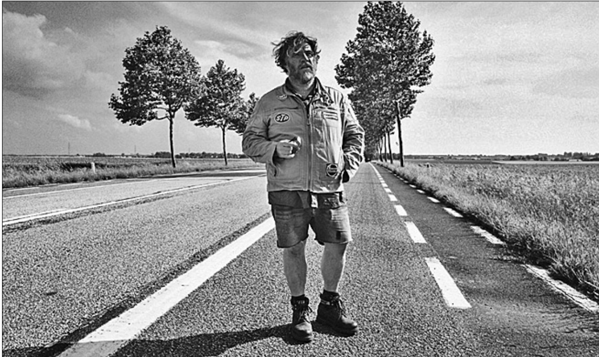
Кадр з фільму "Ельдорадо"

З 12 до 14 грудня в кінотеатрі "Київ" покажуть шість фільмів з Каннського фестивалю