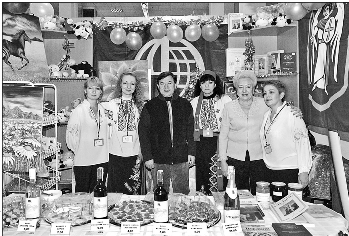
Генеральна дирекція з обслуговування дипломатичних представництв яскраво представила Київ та країну на добродійному ярмарку

Передноворічний міжнародний ярмарок, який відбувається за ініціатииви Міжнародного жіночого клубу, в цьому році проводять уже вшестнадцяте. Ідея ярмарків зародилася в дипломатичних колах, а саме серед дружин іноземних послів, які працюють в Україні. Учасником цього дійства від України вже вкотре виступила Генеральна дирекція з обслуговування дипломатичних представництв (ГДП).