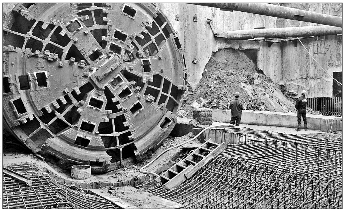
Метрополітенівці підготували три нові станції у бік Теремків на 97 відсотків, для завершення робіт їм не вистачає 350 мільйонів гривень

Попри це всі роботи зі спорудження нових станцій метро нині заморожено. “Будівництво призупинено, матеріали закінчилися, зарплат не платять з вересня, люди у відпустках, а де-