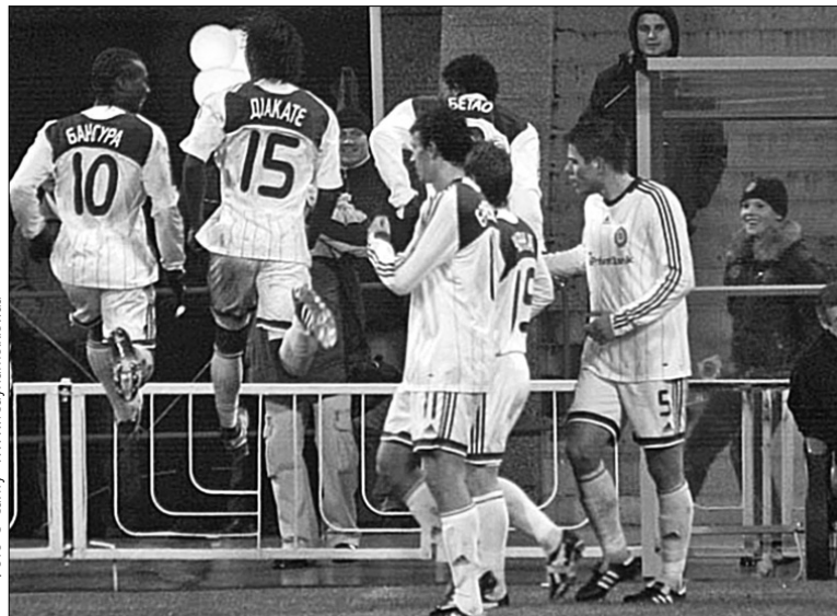
Нагоди для радощів у футболістів київського “Динамо” в нинішньому сезоні було вдосталь

Перенесеним поєдинком між мариупольським “Іллічівцем” і київським “Динамо” закінчилася осіння частина першого в історії чемпіонату України з футболу під егідою новоствореної Прем’єр-ліги. Перше місце посідають столичні “динамівці”, які випереджають на шість очок харківський “Металіст”. Ще один київський клуб, “Арсенал”, знаходиться лише на дванадцятому місці, маючи у своєму активі 12 очок.