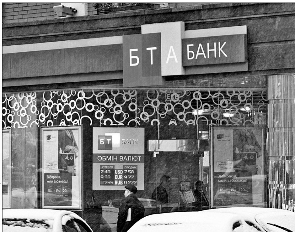
"БТА Банк" має намір надовго залишитися в Україні

"Наш бізнес розширює свої інвестиції у вашу країну, оскільки вірить у її майбутнє", — запевнив "Хрещатик" Мухтар Аблязов. За його словами, він завжди вимагає від підлеглих, які займаються проектами казахського інвестора, приділяти увагу не лише збільшенню капіталізації бізнесу, а й дбати про майбутнє України. На підтвердження своїх слів Мухтар