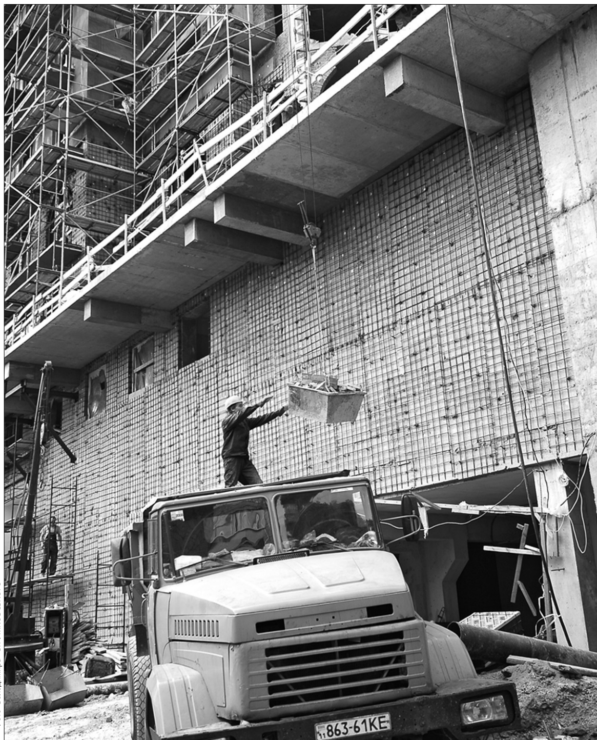
Непоступливі забудовники знижують ціни на нерухомість або підуть з ринку геть

У кризовій ситуації будівельники за прикладом колег із інших галузей промисловості скаржаться до державних органів влади. 12 листопада на загальнонаціональну антикризову нараду запросили самого Президента. Вікторів Ющенко оголосили цілий список прохань. Зокрема пропонують запровадити скасування податків для забудовників під час будівництва житла та соціальних об'єктів у разі призупинення будівництва. Окрім того, будинки, що готові на 50–70%, запропонували викупити державі і самій зайнятися їхнім продажем. При цьому ціну запропонували ту, яка була закладена у проект будівництва раніше. Тобто, з величезною надбавкою. Результатом візиту глави держави до забудовників став указ, яким Віктор Ющенко зобов'язав Кабмін ви-