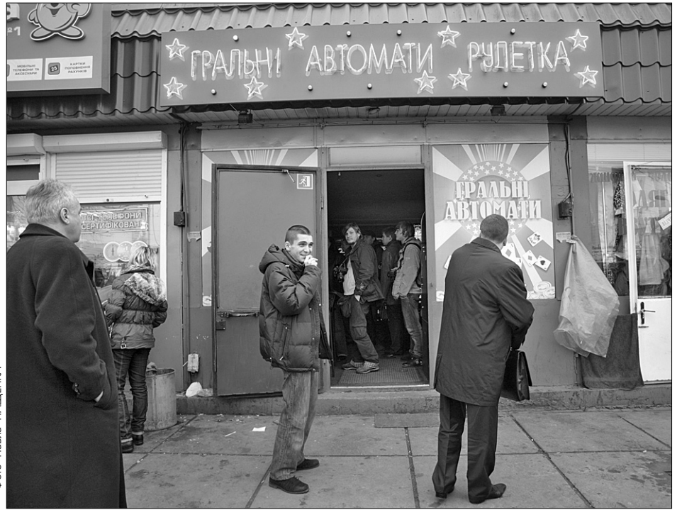
Попри позбавлення через численні порушення деяких ігрових павільйонів у столиці ліцензії вони продовжують свій нелегальний бізнес