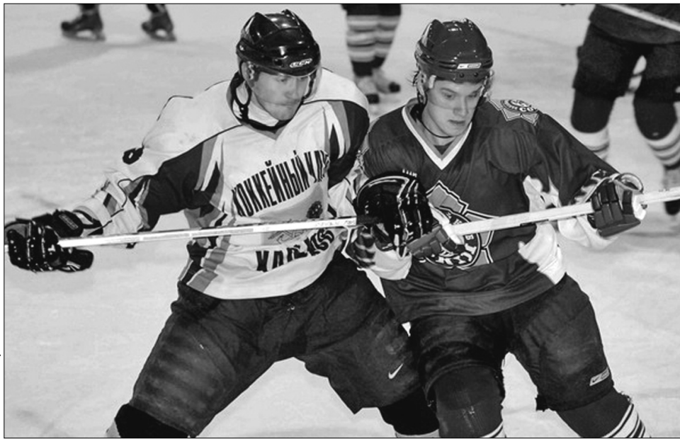
Матчі між квітським "Соколом" і ХК "Харків" стали справжньою окрасою нинішнього чемпіонату України з хокею

Найавторитетніша компанія зібралась у Центральному дивізіоні — квітські "Сокол", АТЕК, "Компаньйон", "Білий Барс" із Броварського району та "Харків". У складі всіх клубів грають хокеїсти, які брали участь не в одному престижному змаганні, а дехто виступав навіть у чемпіона-