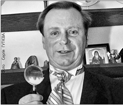
Олексій КУЖЕЛЬНИЙ, народний артист України спеціально для "Хрещатика"

Сьогодні в багатьох великих містах світу незнайомі люди вітаються одне з одним або обмінюються стриманими усмішками прихильності. В туристично напружених містах — менше, наприклад, у Парижі. А в Японії кланяються здалеку, наблизившись безпосередньо і ще навздогін. Звісно, не йдеться про норму поведінки, але й не про винятки. Так чи інакше це питання діалогу міських жителів передусім між собою, а далі ставлення до гостей як до земляків, хоча й на кілька днів.