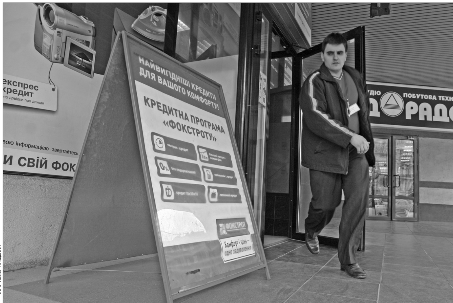
Брак кредитів змушує мережі електроніки йти з ринку

Раніше в низці ЗМІ поширилися чутки, буцімто мережа “Фокстрот” планує звільнити близько 2,5 тис. своїх працівників, вже закрила 20 своїх складів, зупинила діяльність кількох сервісних центрів та перевела частину роботи, яку виконували працівники “Фокстроту”, аутсорсинговим компаніям. Втім, у “Фокстроті” спростували цю інформацію та наголосили, що наразі йдеться про оптимізацію витрат на обслуговування торговельних мереж та оптимізацію роботи персоналу. Однак цифра 2,5 тис. звільнених — перебільшення, запевнили громадськість підприємці. “Група компаній “Фокстрот” підвищує ефективність своїх магазинів в умовах фінансової кризи: тимчасово призупинено набір персоналу, а всі управління змушені були переглянути штатний розклад та скоротити посади суміжних функцій”, — змушена була виправдовуватися прес-служба компанії у відповідному зверненні до ЗМІ. Однак у тому ж таки меседжі до споживачів та своїх конкурентів у “Фокстроті” не приховували, що вони “змушені оптимізувати основні видаткові статті, але в більш низькому процентному співвідношенні, ніж наші конкуренти, і поступово”. Що фактично означає те саме, що “Фокстрот” насправді не лише планує скорочувати людей, а й закривати магазини, тільки викладено все це в завульгованій формі. Втім, за словами менеджерів компанії, особливої уваги значному зменшенню кількості маркетів приділяти не слід, адже це нормальне ринкове явище — закриття нерентабельних точок, намагаються переконати во-