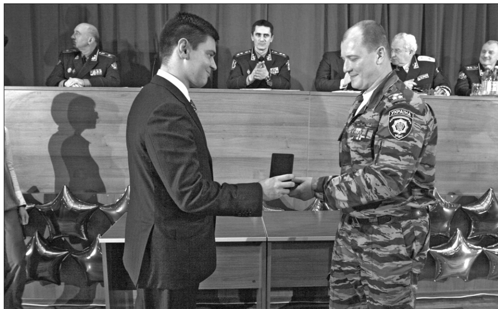
З нагоди ювілею "Беркута" перший заступник голови КМДА Денис Басс від імені столичної влади привітав найкращих бійців славетного підрозділу

Від Київської адміністрації столичні беркутівці дістали вчора у подарунок новенький автобус. Кращих бійців було відзначено нагородами МВС і Київського міського голови ●