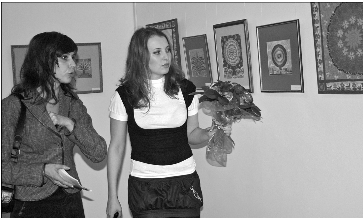
Роботи майстрині викликали неабиякий інтерес у столиці