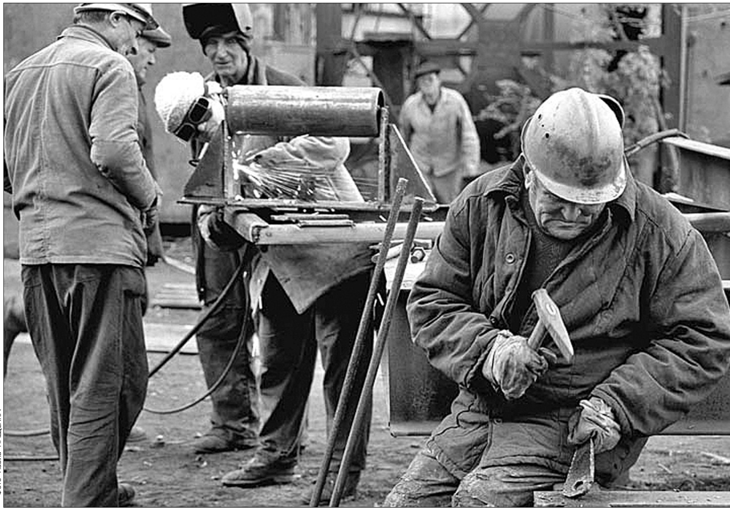
Замість модернізації виробництва металурги вимагають ще більше преференцій від уряду

"Насправді меморандум про взаєморозуміння між урядом України і металургійниками перестав діяти вже від дня його підписання. Цей документ не має юри-