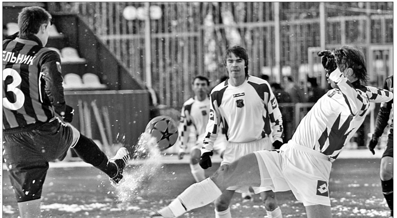
Футболісти кийвського “Арсеналу” і одеського “Чорноморця” провели поєдинок в екстремальних умовах

Доки футболісти кийвського “Динамо” готуються до виїзної гри Ліги чемпіонів із лондонським “Арсеналом”, нинішні конкуренти команди Юрія Сьоміна додали у скарбничку чергові пункти. Особливо треба звернути увагу на перемогу донецького “Шахтаря” над ФК “Львів”. Гірняки, хоч і відстають від “Динамо” на солідну дистанцію у дев’ять пунктів, при тому, що столичний клуб має гру в запасі, віддавати чемпіонський титул головному конкуренту в вітчизняних змаганнях явно не збираються •