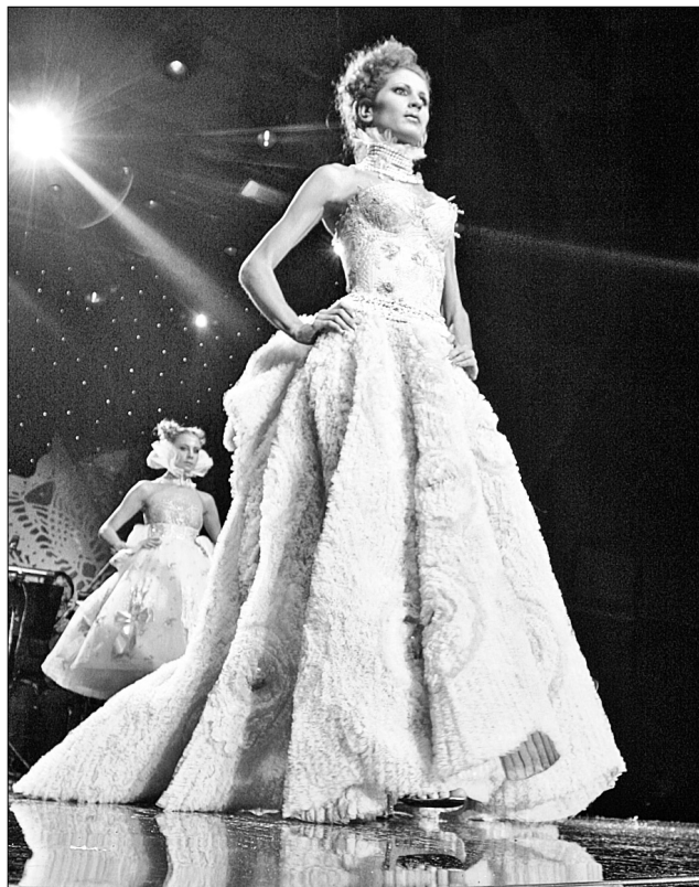
Вечірньому вбранню дизайнера притаманні жіночі силуети та незвичні тканини

Цього разу колекція присвячена улюбленій співачці та музі Єрмакова — Мадонні. Як розповів дизайнер