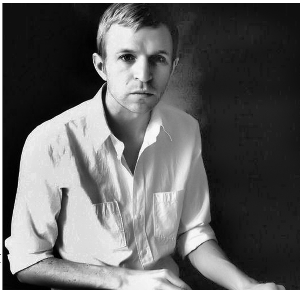
Jay Jay Johanson дотримав обіцянки виступити в Києві знову

Розігрівати знаменитого шведського гостя будуть харківські музиканти — гурт Люк, який уже має своїх фанатів не лише в Україні. Цікаво буде спостерігати, як позитивні та в цілому веселі мелодії “Люків” змінуюватимуться меланхолійними заспівами Джей Джей. Так чи інакше, але цю подію ліпше не пропускати. Час і місце зустрічі: сьогодні о 19.00, столична галерея “Лавра” ●