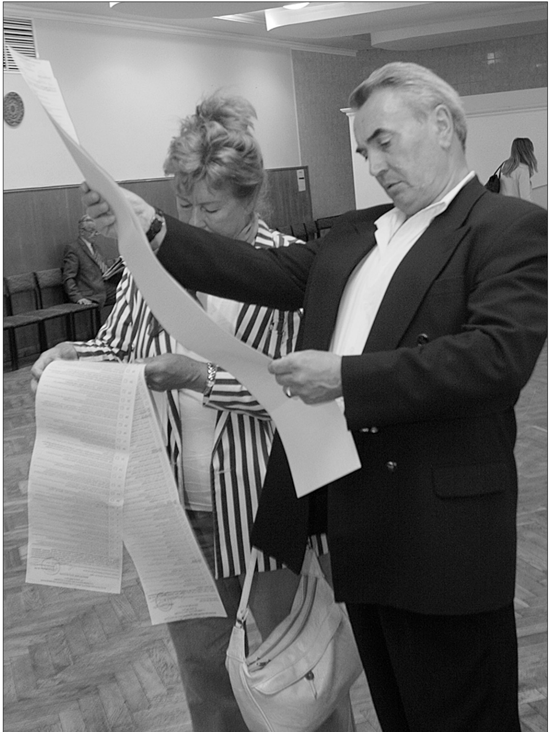
Виборці шукатимуть у бюлетені нові імена

Понад 50-відсоткова недовіра населення до діяльності старих політичних гравців свідчить про втому від них. Їхні гасла на виборах також передбачити не складно. За стрімкого погіршення життя людей, кожен з відомої трійці спробує умити руки і звинуватити