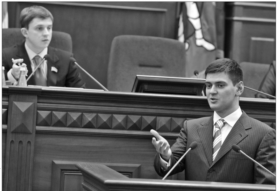
Перший заступник голови КМДА Денис Басс упевнений, що найближчим часом у столиці пасажирів обслуговуватимуть на найвищому рівні

Ефективний вихід із ситуації запропонував міський голова Леонід Черновецький. “Зважаючи на нинішню економічну ситуацію, доходи населення не підвищуються щонайменше два роки. Тому ми не маємо права перекидати цей тягар на киян. Підвищені тарифи повинні оплачувати юридичні особи. На їхніх статках це не позначиться, я знаю, про що кажу, бо й сам був бізнесменом. На вечерю в ресторані вони витрачають більше, ніж бабуся-пенсіонерка протягом місяця”, — сказав Леонід Черновецький. За його пропозицією тарифи для “високорентабельних, але нехороших” закладів, таких, як казино та стрипбари, мають підвищити в 10 разів, а решта юридичних осіб платитимуть у 5 разів більше. Проект рішення міського голови