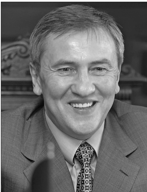
Шановні працівники соціальної сфери!

Київського міського голови з Днем працівників соціальної сфери