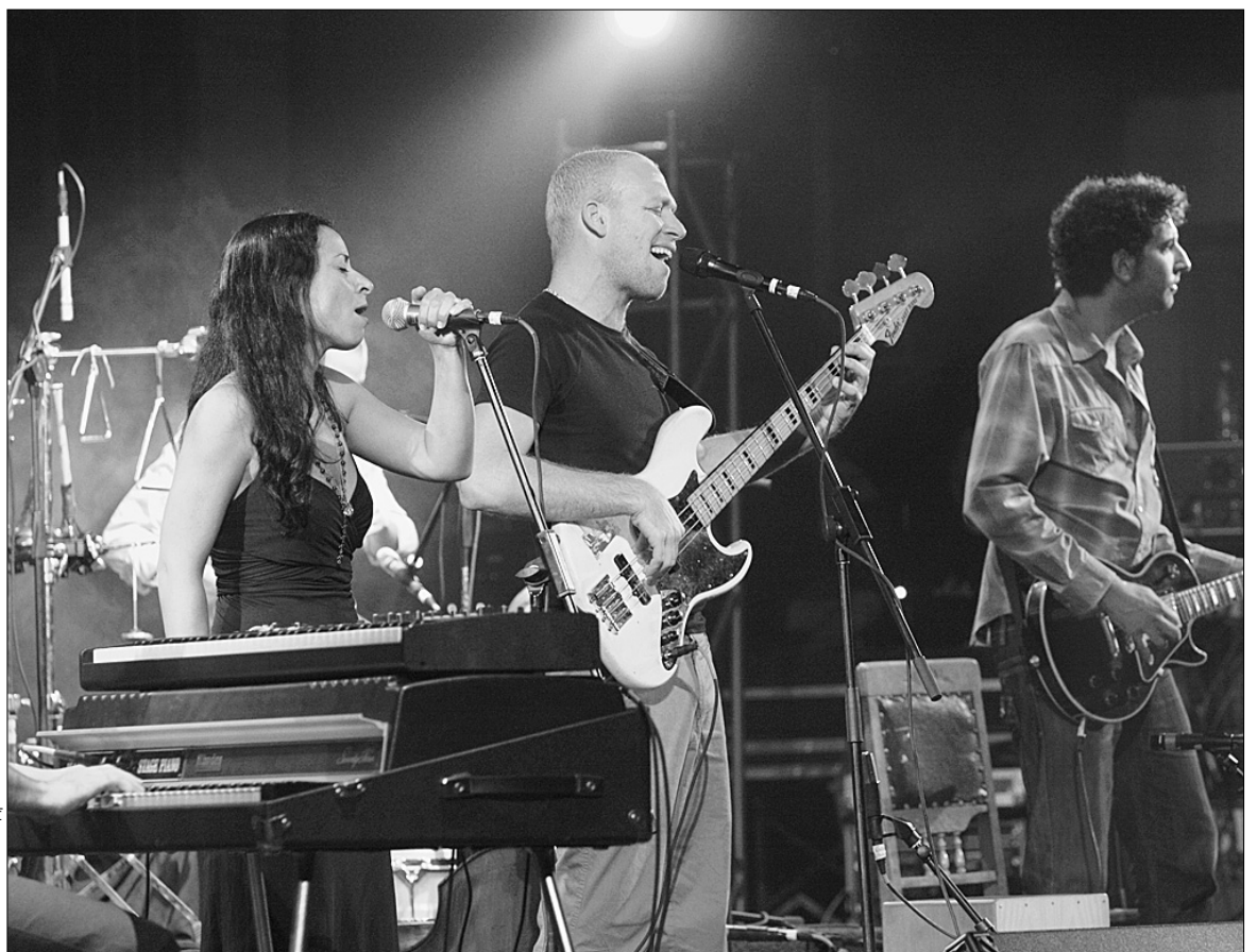
У легендарного контрабасиста Авішаї Коена, як і рік тому під час його київського виступу, не можна було не закохатися

А втім, публіка чекала на хедлайнера цього дня — ізраїльського контрабасиста Авішаї Коена.