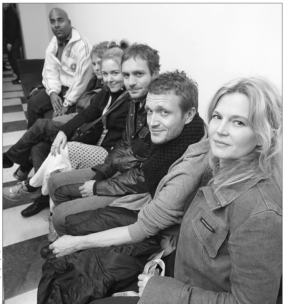
New Tango Orchestra своєю творчістю вміють змусити слухача і сміятися, й плакати. Ясна річ — від задоволення

Розмовляла Аля ФІЛІПОВА, спеціально для "Хрещатика"