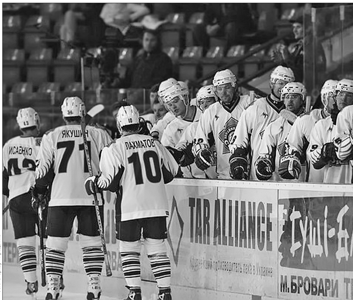
Хокеїсти "Сокола" налаштовані підкорити Європу

У чвертьфіналі кияни на одному подиху розібралися зі своїми суперниками. Спочатку в стартовому поєдинку "Сокил" був сильнішим за голландський клуб "Тілбург Трапперс" з рахунком 6:3. Наступною сходинкою, за присутності 2000 уболівальників, стала феєрична перемога над господарями турніру, клубом "Енергія Електренай" — 6:1. Путівку до наступного кола розігравали в матчі проти чемпіона Польщі команди "Краковія" (Краків), яка також обіграла литовську й голландську команди. Проте до вирішального дня українці підготувалися краще. Як не дивно, вже на 27 хвилині на табло го-