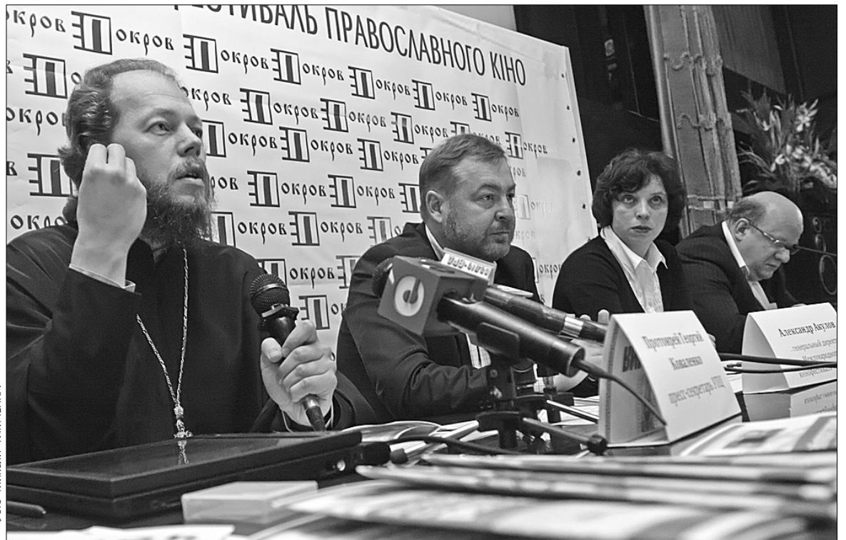
Нарешті Православна церква додумалась до відкриття рекламної агенції