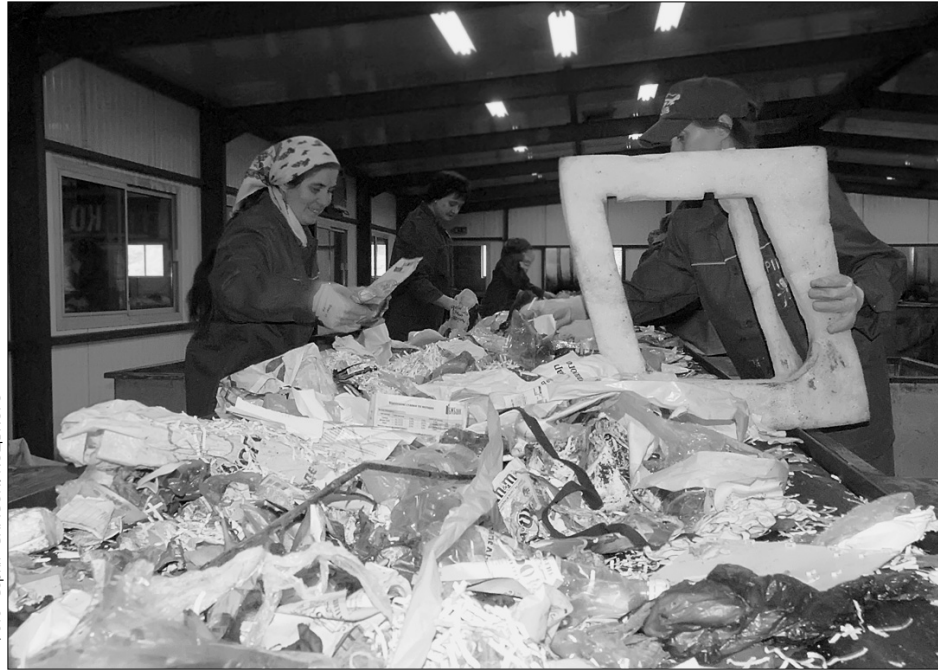
Щороку сміття може приносити понад $ 7 млн чистого прибутку

Тому перевізники своєю чергою вимагатимуть додаткових преференцій та