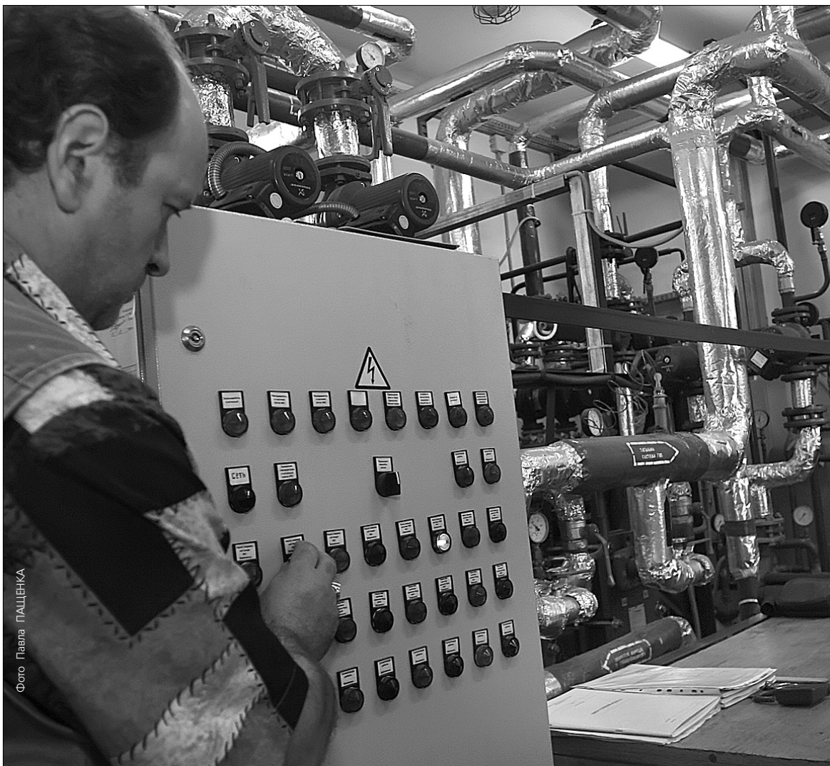
Хоча "Київенерго" вчасно підготувалася до початку опалювального сезону, в компанії скаржаться на незадовільне фінансування

Нині борг споживачів за світло і тепло вже перевищив 969 млн грн