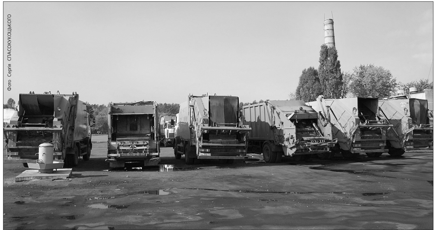
Незабаром кожна столична компанія-перевізник твердих побутових відходів має створити спеціальні мийки для смітєвозів і контейнерів

Машини та контейнери для відходів митимуть