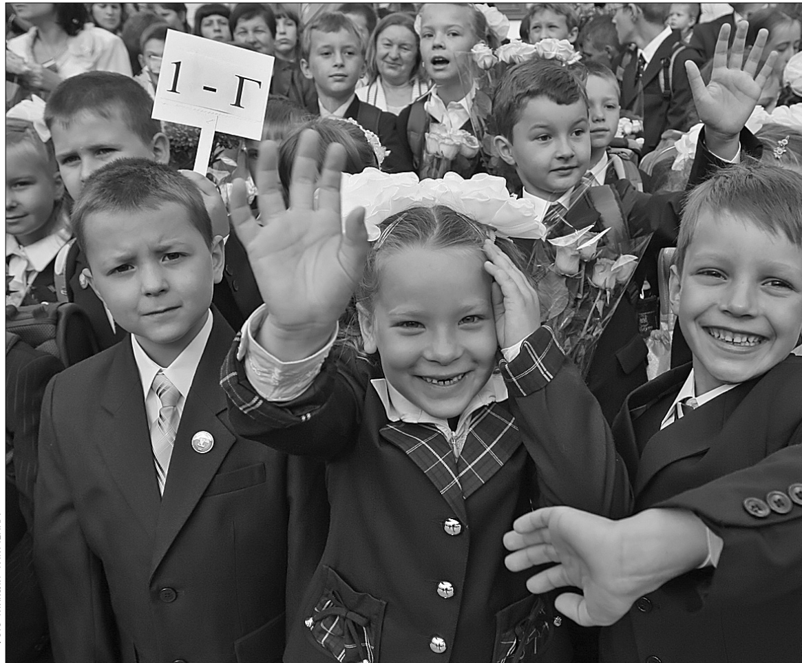
У перші роки навчання дітям дуже потрібна увага

Ідеться про те, чи готова до такого "напливу" учнів столична освіта. Адже вже нині освітяни говорять про "шок першого ве-