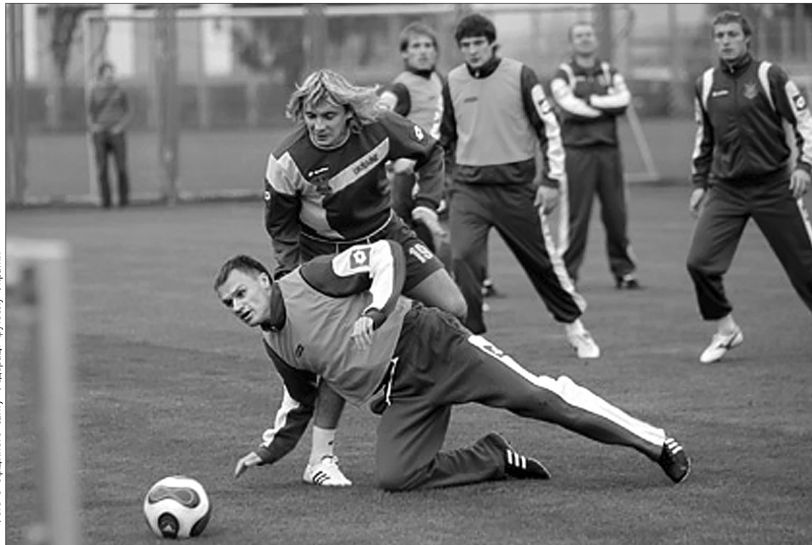
Футболісти збірної України перед грою із хорватами тренуються завзято

За словами головного тренера збірної України Олексія Михайличенка, про важливість цієї зустрічі зайвий раз не треба й говорити. Водночас, пан Михайличенко вважає, що поєдинки відбіркового турніру взагалі не можна поділяти на важливі й не надто важливі: "Як гра, наприклад, з тим же Казахстаном, так і зустріч із Хорватією мають однакову очкову вагу на шляху до виконання поставленого перед нами у відборі завдання. Відтак, на кожен поєдинок перед нами стоять конкретні цілі. У матчі з хорватами для нас