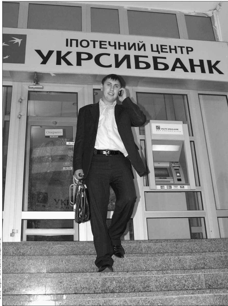
Іноземні банкіри “вносять” капітал з України