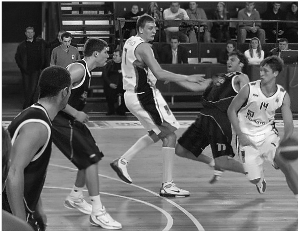
Столичні "Будівельник" і БК "Київ" опинилися по різні сторони барикад

У новостворену Українську баскетбольну лігу ввійшли десять клубів: київський "Будівельник", БК "Одеса", івано-франківська "Говерла", "Черкаські Мавпи", запорізький "Ферро-ЗНТУ", дніпропетровський БК "Дніпро", сімферопольські "Грифони", львівська "Політехніка", дніпродзержинський "Азот" і криворізький "Кривбасбаскет-Люкс".