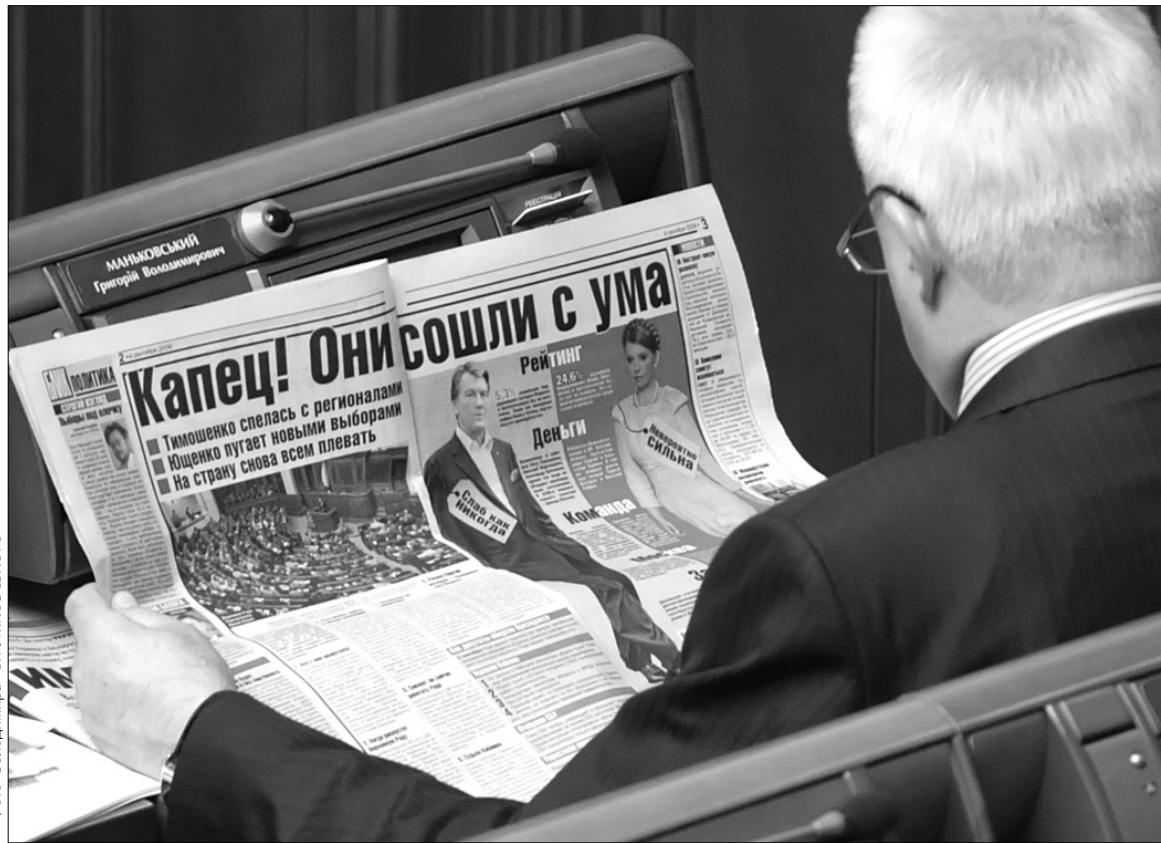
Преса глузує з політиків, але це не підштовхує їх до компромісу

Останній день роботи парламенту, після якого Верховну Раду може розпустити Президент, розпочався з майже тригодинної затримки через неузгоджений порядок денний між БЮТ, НУ—НС і Блоком Литвина. Цього разу не готовим виявився пан Литвин, який знову починає почуватися зайвим у міцних обіймах "заклятих друзів" БЮТ і НУ—НС. Від самого ранку ці дві сили захопилися з'ясуванням давніх стосунків замість того, щоб сформулювати нову коаліцію. Врешті-решт саме із залагодження образ між фракціями колишньої "демократичної" коаліції Арсенія Яценюк і розпочав засідання. Парламент перей-