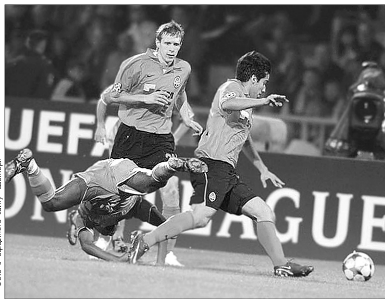
Останні хвилини у грі "Шахтар" — "Барселона" перевернули ситуацію на полі з ніг на голову

Серед інших матчів другого туру Ліги чемпіонів відзначимо кілька сенсаційних, а саме: перемогу кіпрського "Анартосіса" над грецьким "Панатінаїкосом" — 3:1, а також нічийні результати в зустрічах між білоруським БАТЕ