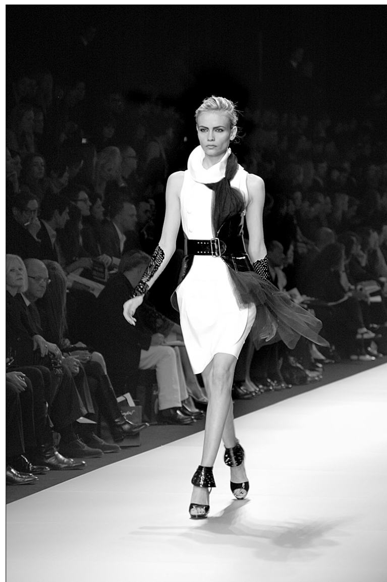
Показ Карла Лагерфельда для однойменного будинку Karl Lagerfeld