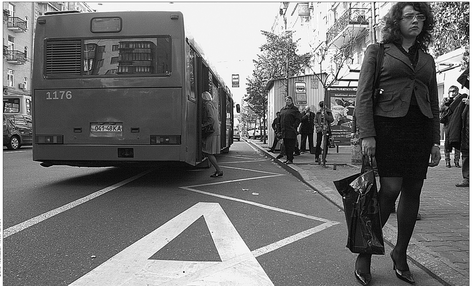
Нова розмітка на столичних вулицях наносилася за новітніми технологіями

Удосконалити розмітку планують і на інших вулицях. Приміром, виокремити смуги руху для маршрутних транспортних засобів на вулицях Гетьмана, Довженка, Олени Теліги, проспектах Ватутіна, Маяковського,