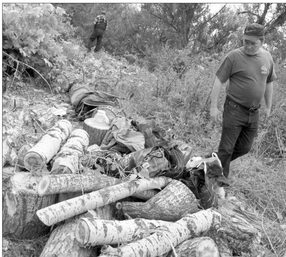
Ці дерева до вчора захищали прилеглі будинки від зсувів ґрунту