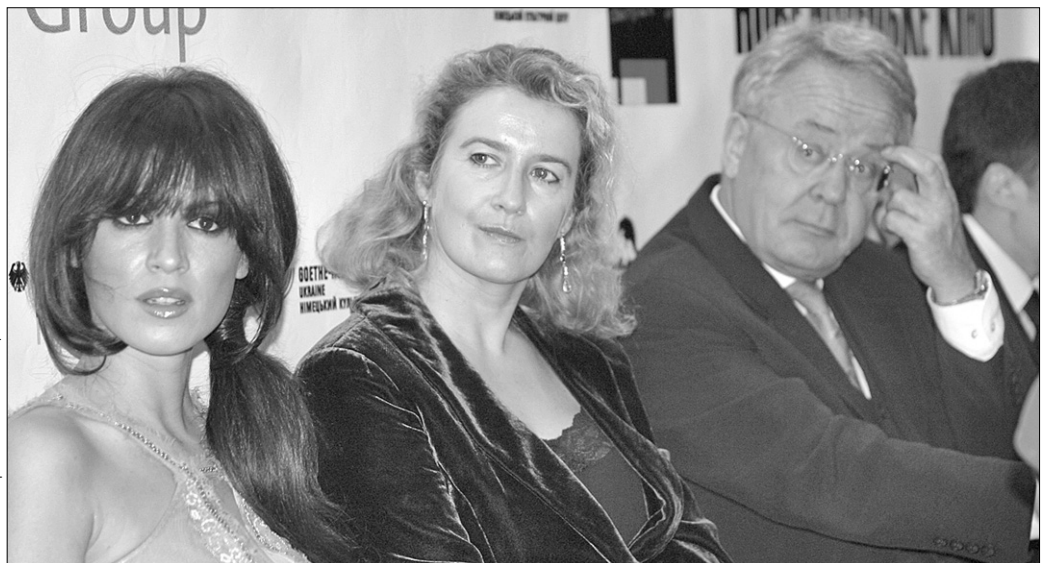
Німецька актриса Наталія Авелон, яка зіграла головну роль у фільмі "Свавільне життя", сама презентувала картину в Києві. Під час відкриття форуму разом із художнім керівником фестивалю Каті Ронке

Щодо останніх, то до Києва приїхало багато акторів і режисерів фільмів. Свою стрічку "Свавільне життя", яку показали на відкритті фестивалю, в Києві представляв режисер Ахім Борнак і виконавиця головної ролі Наталія Авелон.