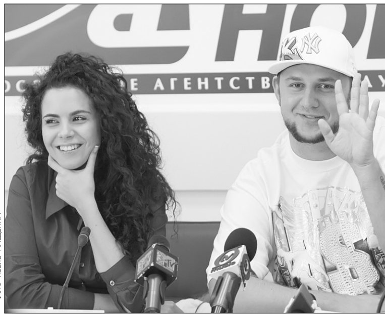
Потап і Настя Каменських обіцяють як слід завести публіку перш ніж свій виступ почне американська поп-діва Крістіна Агілера

Сольна кар'єра співачки розпочалася в 1994 році. Її дебютний альбом Christina Aguilera з'явився в 1999-го. За нього Агілера отримала "Греммі" як найкращий новий виконавець. Нині на рахун-