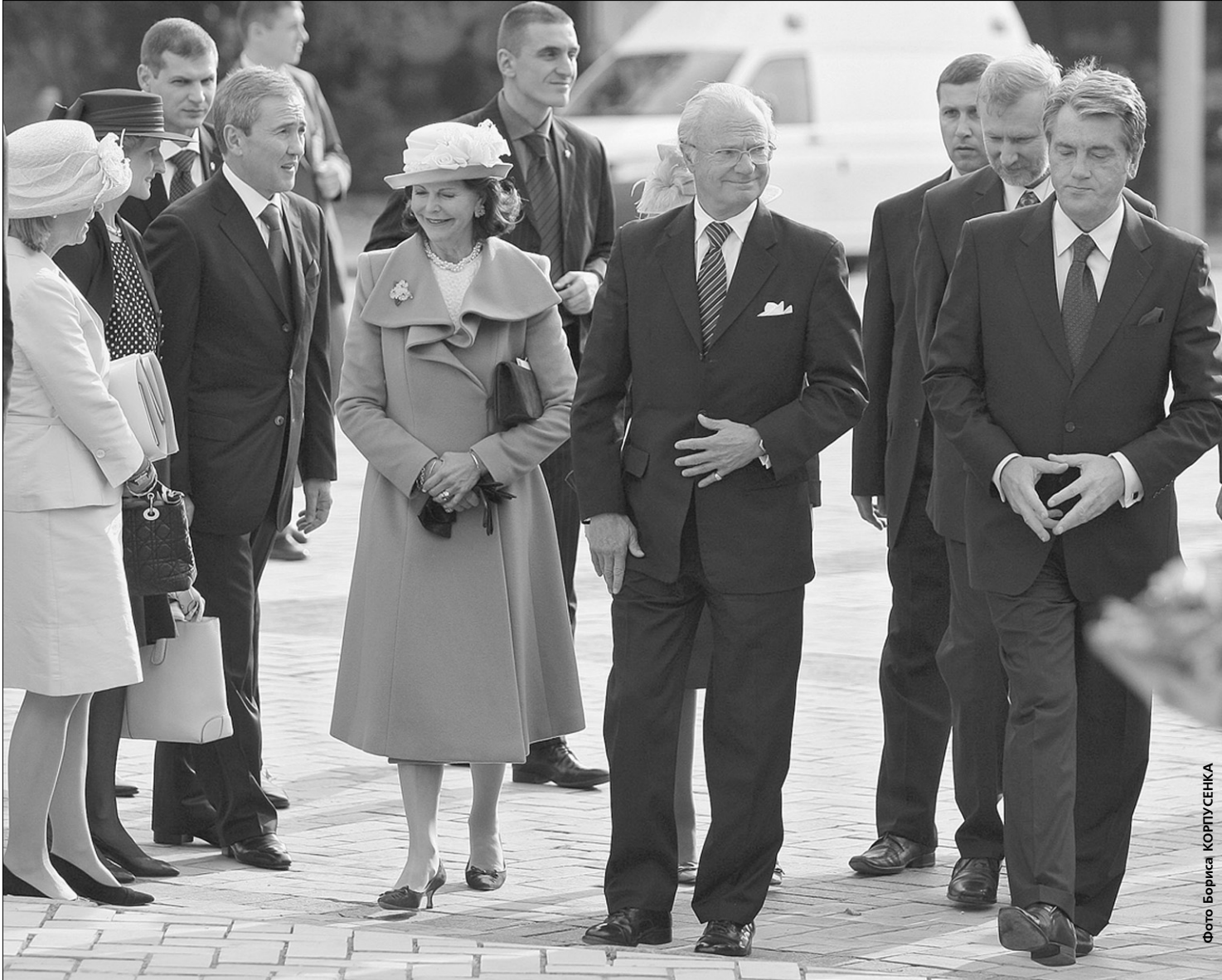
Учора керівництво нашої держави та міста зустрічало короля Швеції Карла XVI Густава та королеву Сільвію. У рамках свого візиту високоповажні гості відвідають Національний заповідник «Софія Київська» та Національну оперу України.