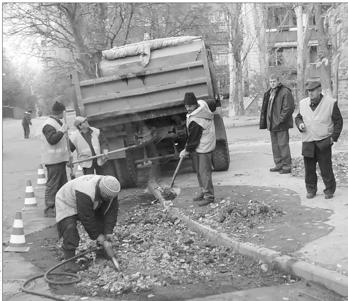
Після осіннього місячника з благоустрою вулиці міста матимуть охайніший вигляд

Уздовж маршруту об'їзду Святошинського району, починаючи від приміщення райдержадміністрації, можна було побачити комунальників, які бадьоро ремонтували дороги, підмітали вулиці,