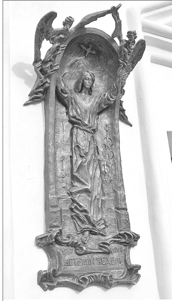
Портретів Артемія Веделя не збереглося. Тому митці, зображуючи його, намагаються передати трагізм долі свого героя, а не його зовнішність

Оскільки портретів не збереглося, у зображеннях композитора художники та скульптори намагаються передати трагізм долі цього чоловіка. Незрозумілий і трохи дивакуватий, він надзвичайно гостро відчував недосконалість світу. І писав фантастичні мелодії. Йому закидали, буцімто живе не так, як