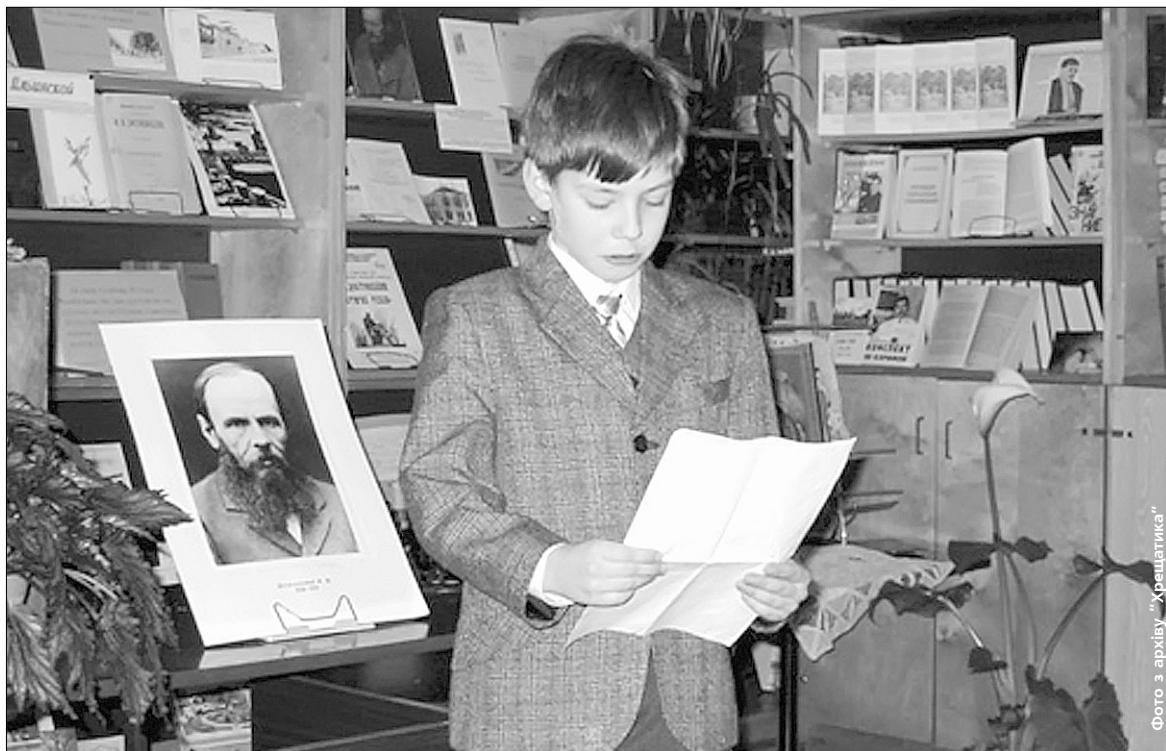
Головне — привернути увагу школярів до класики, перевіреної часом

Головна дитяча книгозбірня міста отримала літературу від видавництва і фінського посольства