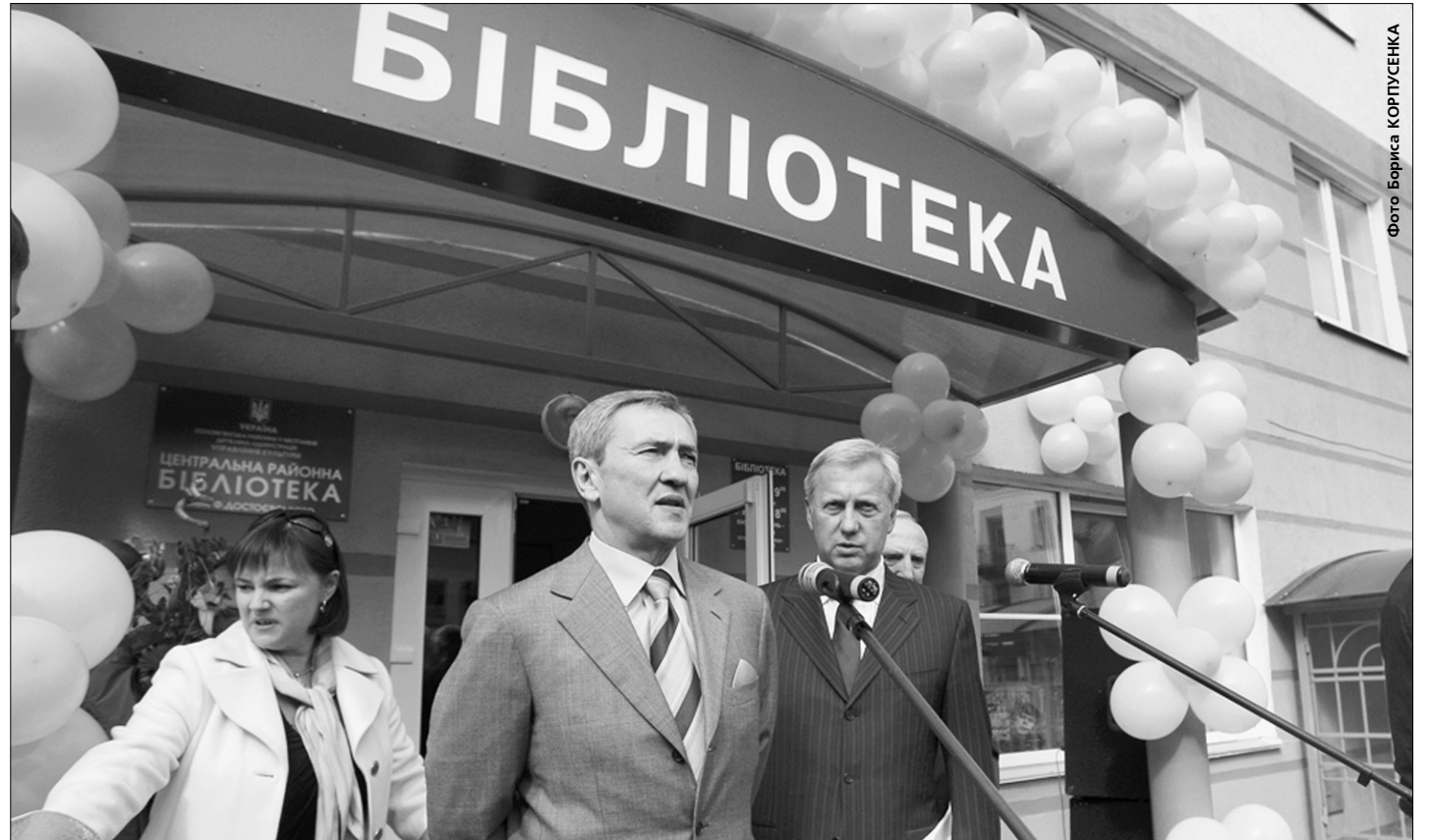
З приходом нової міської влади фінансування бібліотек у Києві подвоїли з 20 до 40 мільйонів гривень

Напередодні Дня бібліотекаря Київський міський голова відкрив новий «храм книжки»