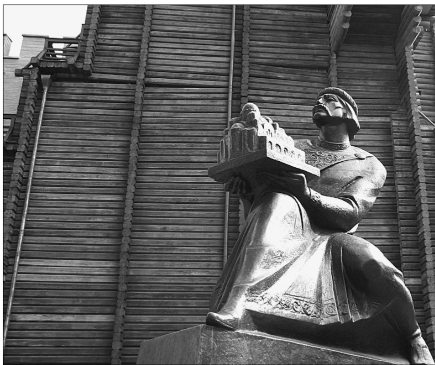
Золоті ворота — залишки фортечної системи Києва давньоруських часів. Збудовані за князя Ярослава Мудрого. В 1240 році зруйновані монголо-татарами