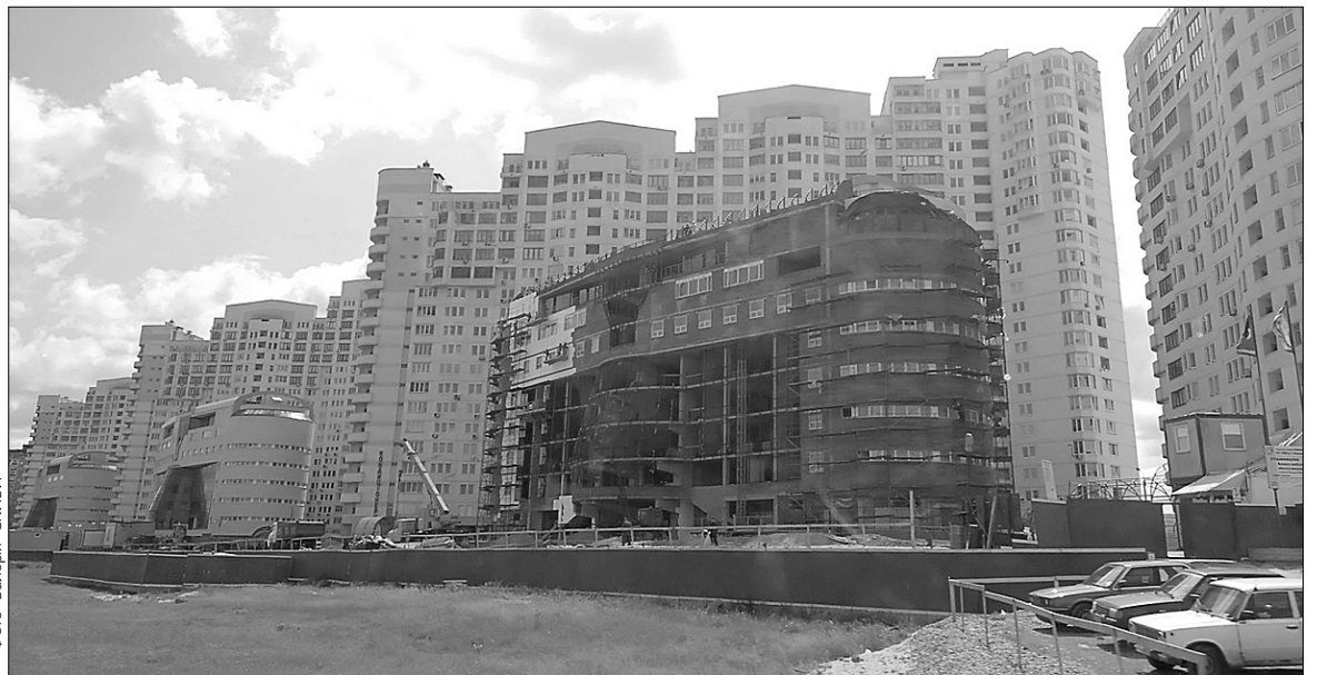
Врятувати холдингову компанію "Київміськбуд" можуть лише серйозні реконструкції

Остаточо розбив міфи про міць "Київміськбуду" віце-пре-