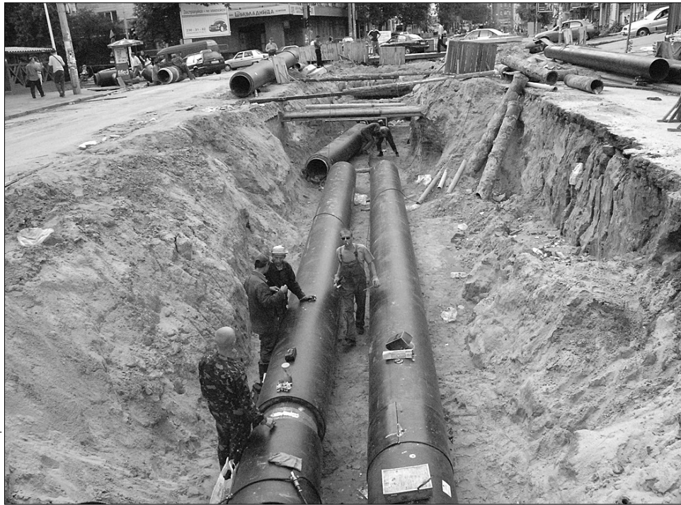
Інтенсивне та безконтрольне включення систем опалення може призвести до аварійної ситуації

"Така ситуація турбує "Київенерго", оскільки неготовність балансоутримувачів будинків може призвести до збою гідралічних випробувань трубопровідних систем опалення, їх промивання, очищення та, як наслідок, до зниження їхньої теплопровідності майже наполовину", —