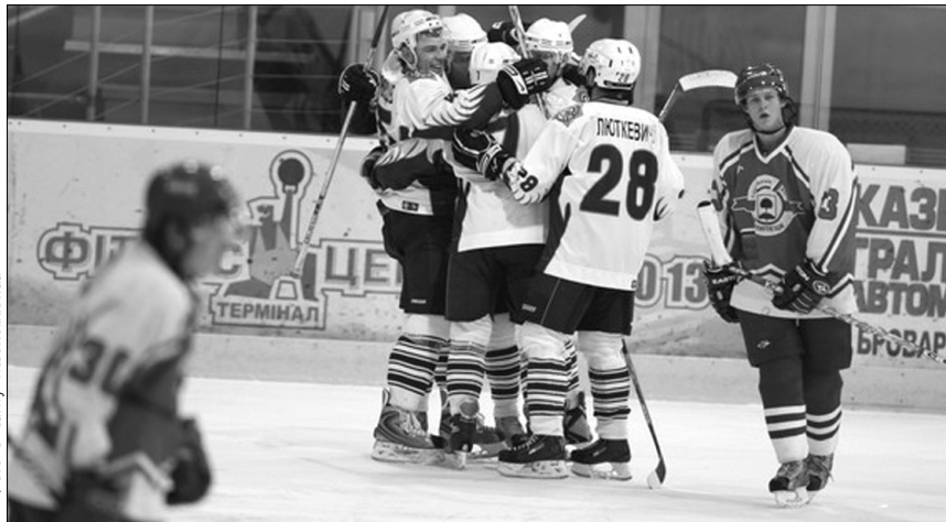
Хокеїсти "Сокола" святкують черговий гол у ворота ХК "Липецьк"