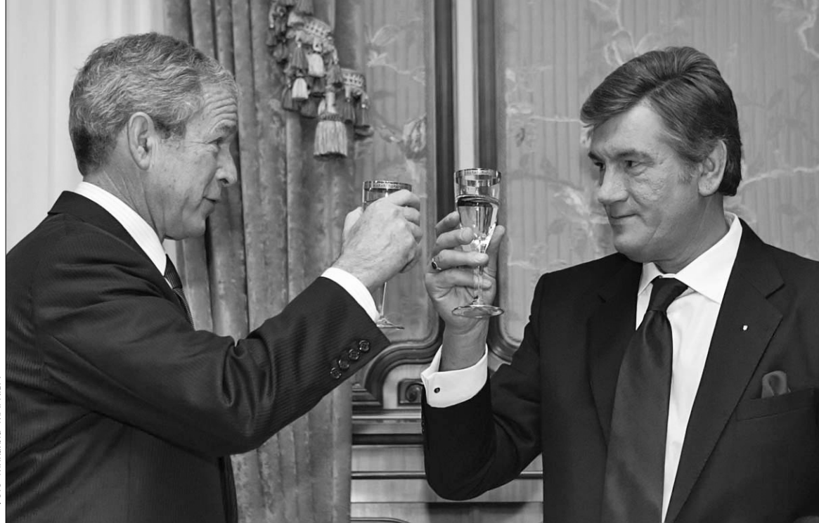
Не дивлячись ні на що, президенти України та США дивляться на події в Україні з оптимізмом

Недооцінювати вояжі вітчизняних посадовців не варто, переконаний і політолог Володимир Фесенко. "За надзвичайно напруже-