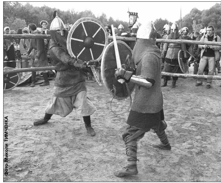
Кремезні парубки у масивних кольчугах із щитами у руках випробовують на міцність свою зброю та витривалість одне одного

У вихідні це село під Києвом перетворилося на маленьке вікно в середньовічне минуле — там відбувався фестиваль клубів історичної реконструкції "Парк Київська Русь"