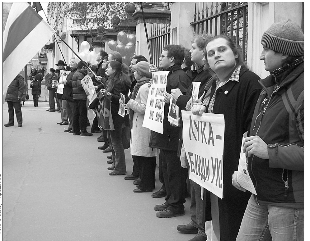
Білоруська опозиція так і не спромоглася докритися до власних громадян

Поки що потепління у відносинах між офіційним Мінськом і ЄС не найкращим чином відобразилося саме на білоруському опозиційному русі. Без зовнішньої фінансової підтримки він фактично був позбав-