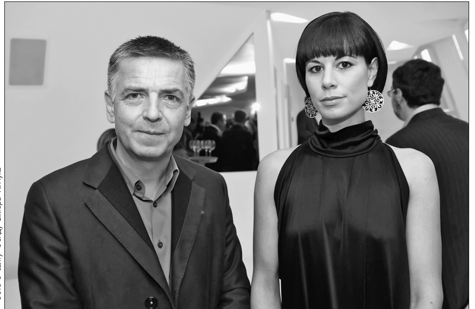
Найдорожчий німецький фотограф Андреас Гурскі і колекціонерка Джулія Стошек живуть у Дюссельдорфі, де минулого року відкрили музей сучасного мистецтва у приміщенні колишнього заводу

Виставка розмістилася на трьох поверхах центру і нараховує 24 фотографії Андреаса Гурскі та 18 відео-інсталяцій, серед яких є роботи європейських митців останніх років і класика жанру. Назва "Рейн на Дніпрі" виникла у організаторів тому, що Гурскі та Стошек, які особисто представили виставку в українському місті на Дніпрі, живуть у Дюссельдорфі, що на Рейні. До того ж до Києва привезли однойменну фотографію Гурскі із зображенням Рейну, який розтинає зелені луки на два береги. На четвертому поверсі виставлено роботи автора, на