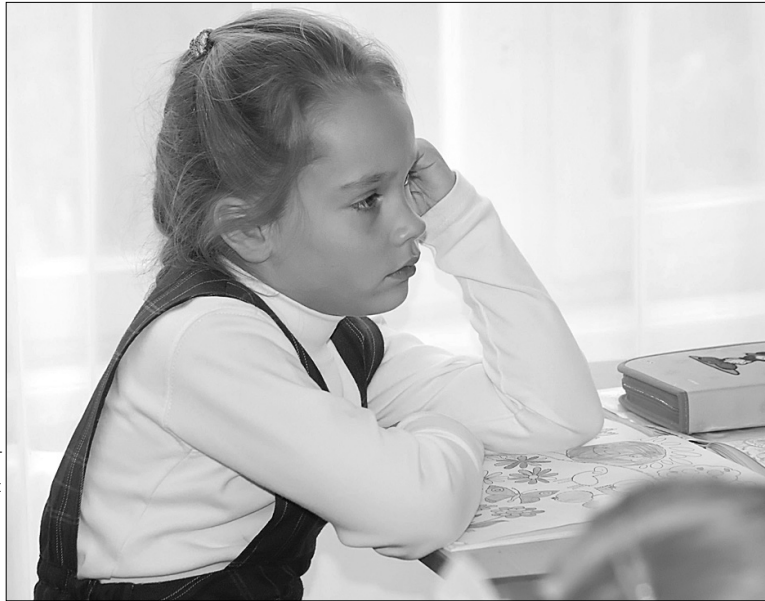
Деякі конфлікти можуть тривати довгий час, що призводить до нервового напруження дитини і заважають їй нормально вчитися

Створення Центру розв'язання шкільних конфліктів — один із проектів благодійної організації "Український центр порозуміння", до якої входять психологи, соціологи та соціальні працівники. Такі проекти уже розроблено і запроваджено в низці середніх навчальних закладів Вінницької й Львівської областей, а також у Житомирі. У столиці України школа № 255 залишається поки що єдиною, де діє центр.