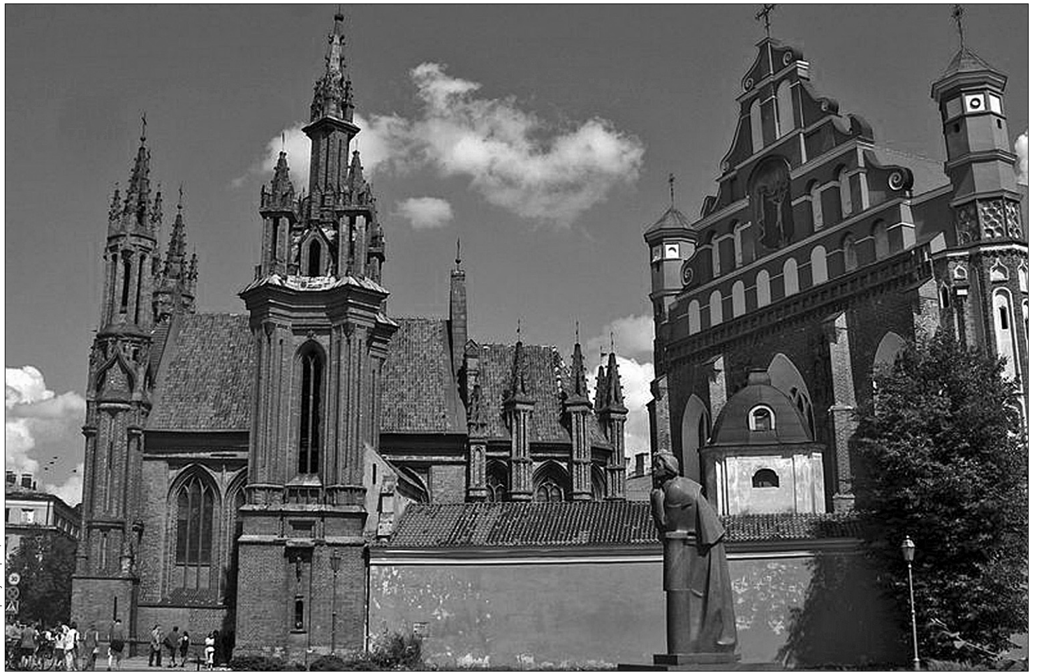
Литовська столиця стане культурним центром континенту

Режим "зеленої хвилі" налаштують згідно з умовам інтенсивності дорожнього руху. Підраховано, що середня швидкість велосипедистів становить майже 20 км/год. Поширити нововведення в межах усього міста планують до 2015 року.