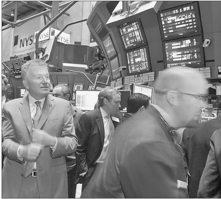
Рейтингове агентство Fitch вважає, що для української фінансової системи настали не найліпші часи

ні папери та емітенти з рейтингами групи В належать до доволі ризикованих для довгострокових інвестицій. У травні 2006 року Moody's підвищив прогноз України з В1 до Ва3 у зв'язку із введенням нової методології присвоєння рейтингів.