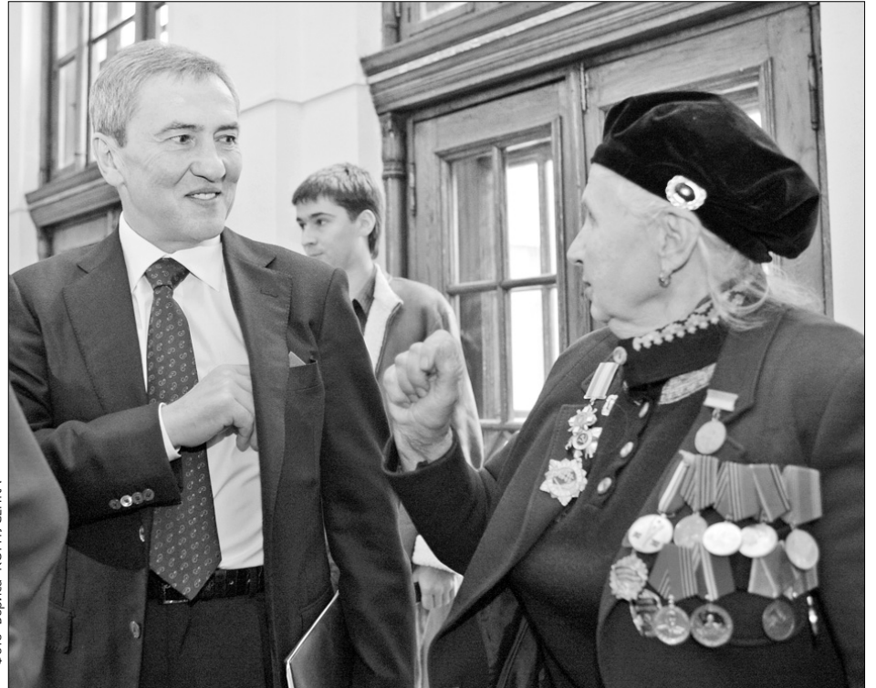
Мер Леонід Черновецький запевнив, що столична влада завжди пам'ятатиме подвиг Праведників Бабиного Яру та піклуватиметься про них

новецький зазначив, що кияни завжди пам'ятатимуть про цей великий подвиг. Починаючи з 2006 року, всі Праведники Бабиного Яру отримують адресну матеріальну допомогу в розмірі 200 грн. Щороку столична влада вшановує цих людей у мерії напередодні роковин страшної трагедії в Бабиному Яру.