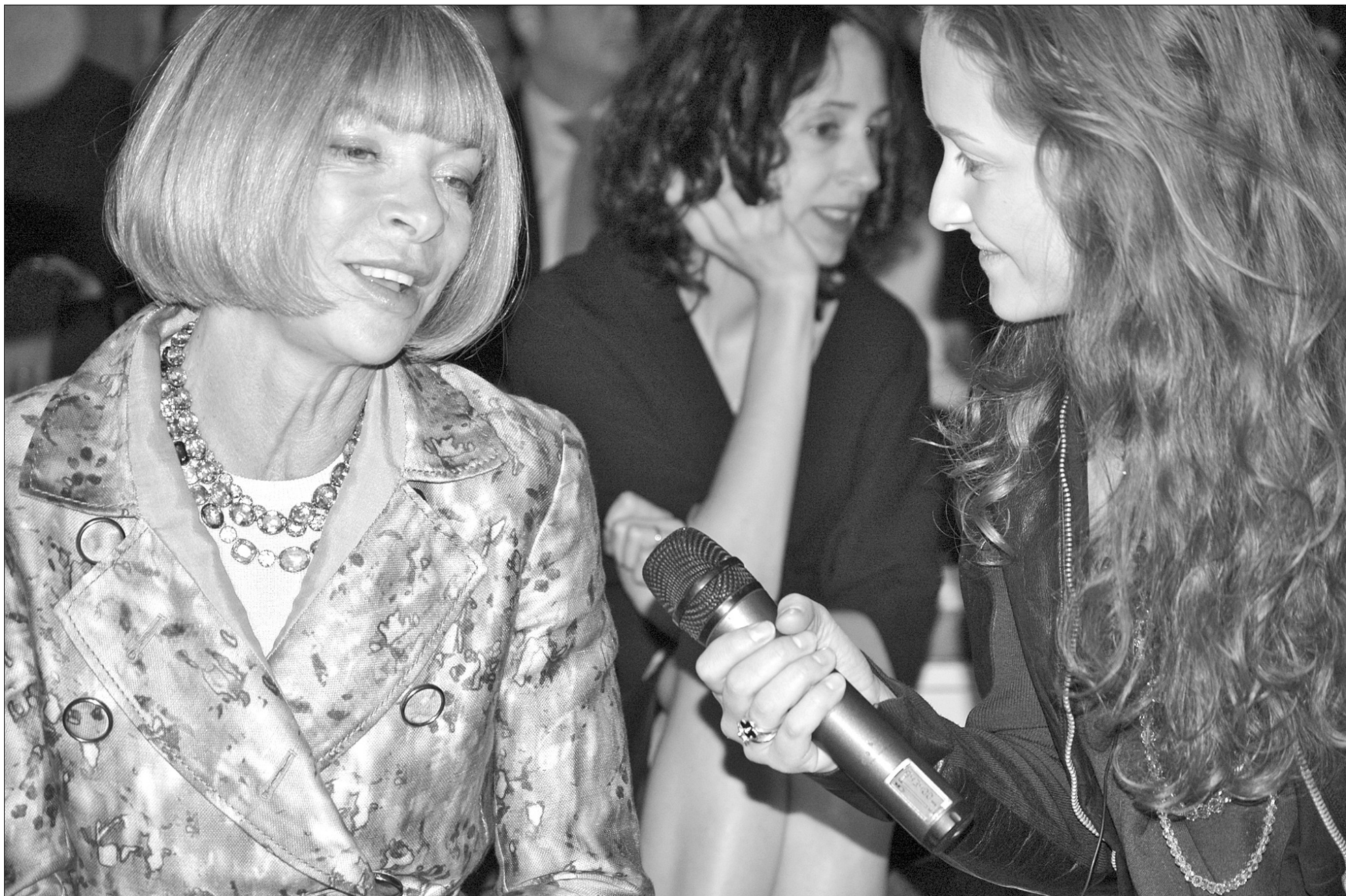
Автор і ведуча програми “Тиждень моди з Дар’єю Шаповаловою” вперше бере інтерв’ю для українського телебачення в легендарного редактора американського VOGUE Анни Вінтур

Автор і ведуча програми “Тиждень моди” Дар’я Шаповалова про тенденції на міланських подіумах