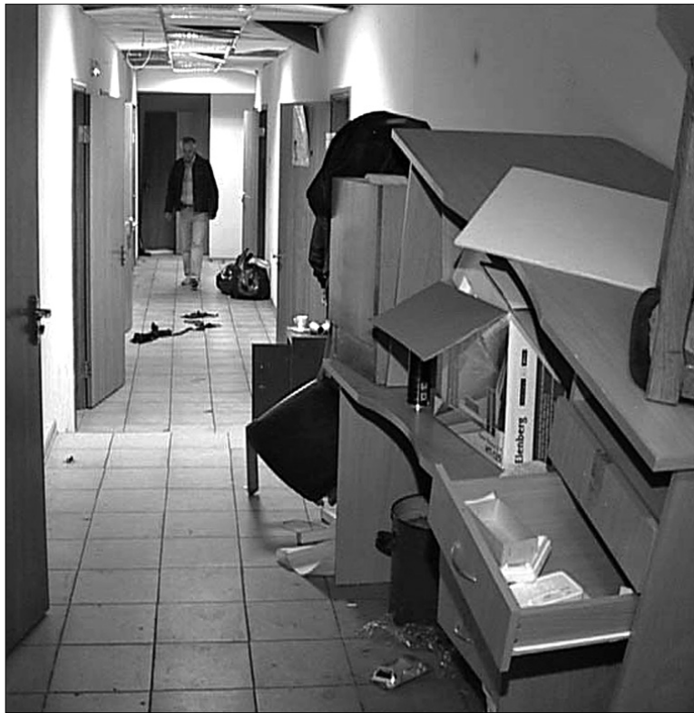
Розгром на підприємстві керівництво, що повернулося, списує на рейдерів

Зрозуміло, що, дізнавшись про реальну ситуацію, нові