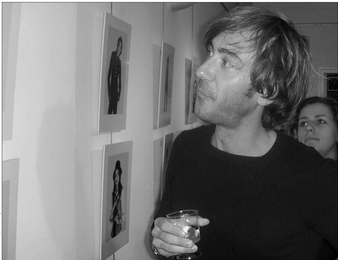
Фотограф Стефан Жізар сам представив киянам власну виставку "Дрес-код: занурення і світ моди паризької молоді"

Роботи навряд чи можна назвати "психологічними". Акцент у них зроблено на зовнішності, одягу. Але це все ж таки не поверхневий погляд. Стефану вдалося передати особистісні риси, характер, темперамент своїх моделей, які явно видно під екзотичними зачісками і екстравагантним одягом та аксесуарами. Щоб усе це побачити, потрібно знати "мову" цього покоління, вникнути в спосіб життя і мислення. Власне, Жізар зі своїм завданням справився. Він зміг показати, що саме говорять своїм одягом юні парижани. А це не так і легко зробити.