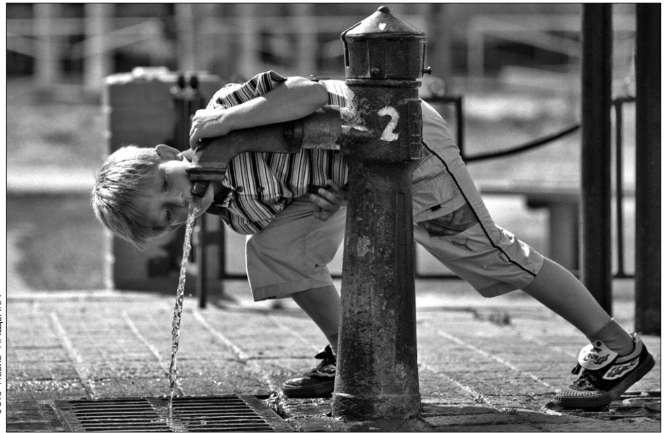
У трьох столичних бюветах незабаром з'явиться "жива вода", її очищуватимуть сімома фільтрами