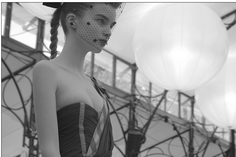
Показ модного дизайнера Луелли Бартті