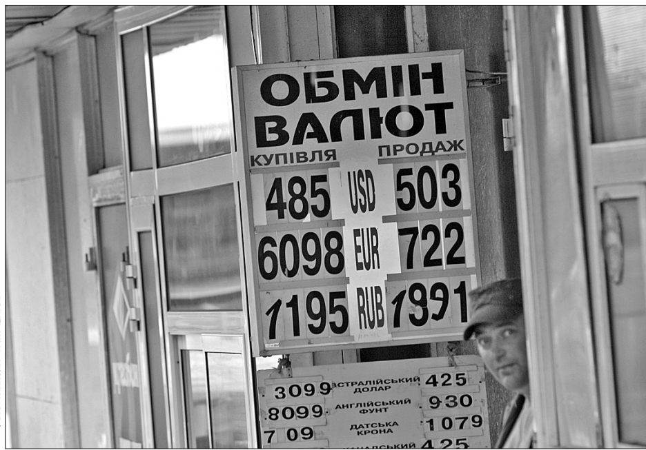
Українська валюта втримала курс нижче, ніж п'ять гривень за долар