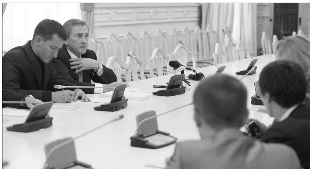
Леонід Черновецький близько сприймає проблеми незаконної забудови міста і сподівається на підтримку киян у цьому питанні

Міський голова Леонід Черновецький учора запросив до себе на особистий прийом активістів спільноти, що виступає проти незаконної забудови у столиці. Під час зустрічі мер укротє наголосив, що проблема залишається найактуальнішою. Закривати на неї очі він не збирається. Водночас повністю сподівається на підтримку міської громади.