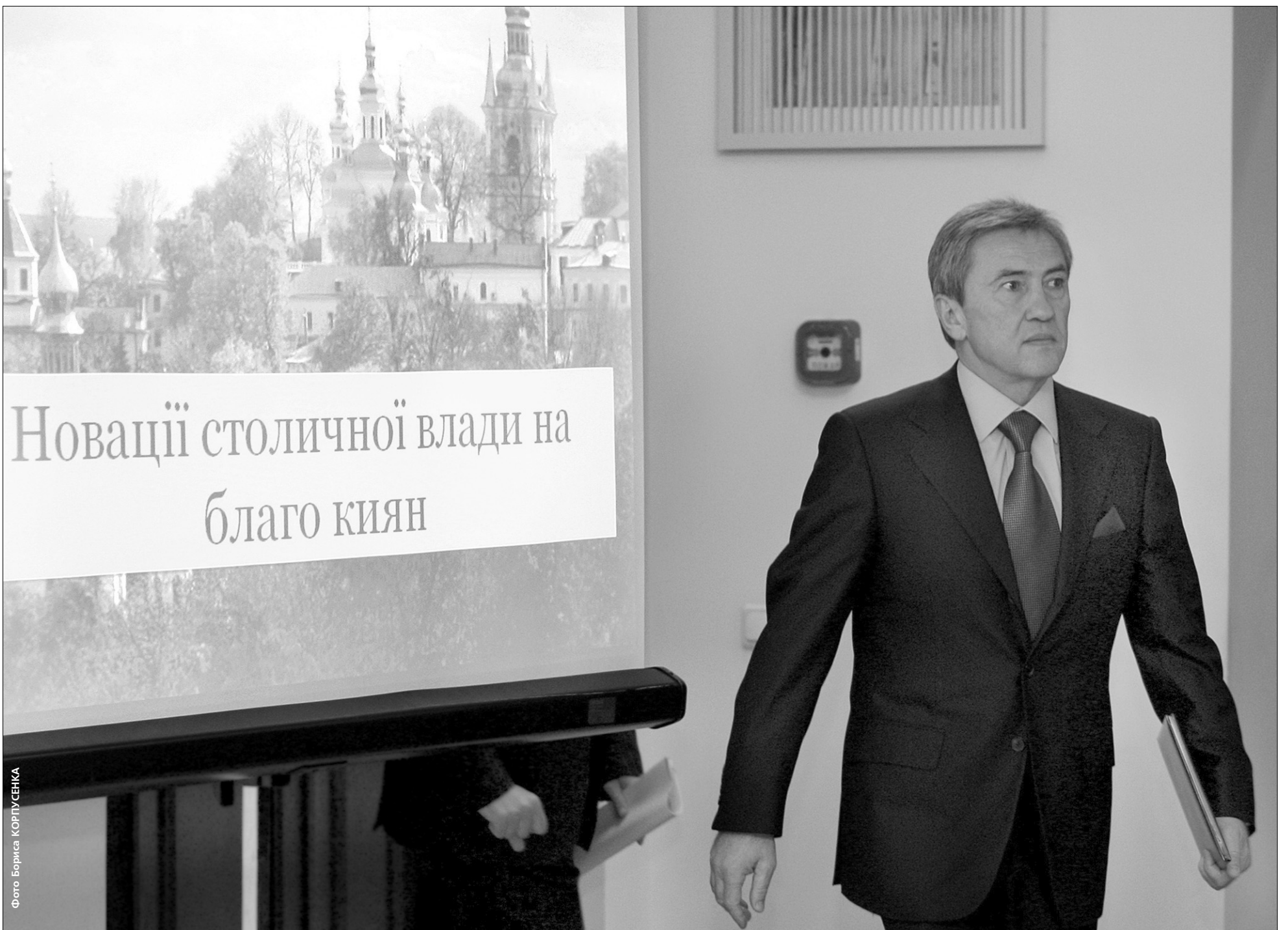
Мер Леонід Черновецький не збирається зупинятися на впроваджених новаціях в житті міста, а розвивати Київ до рівня європейської столиці

Щотижня мер розповідатиме хороші новини киянам