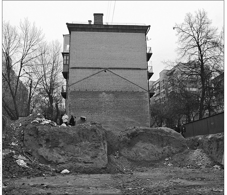
Будівництва дешевого житла тут доведеться чекати не один рік

Крім того, для поліпшення життя будівельників уряд планує освоїти 1 млрд грн з держбюджету на іпотечку в поточному році, а також зовнішні запозичення в розмірі 13,5 млрд грн на програму доступного житла. До того ж у проекті бюджету на 2009 рік Кабмін планує збільшити в шість разів (до 6 млрд грн) фінансування іпотеки для громадян.