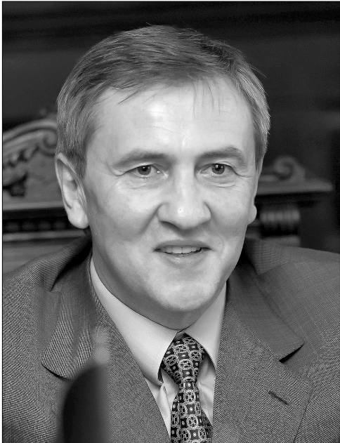
Шановні спортсмени, тренери, ветерани, фахівці та шанувальники фізичної культури і спорту!

Привітання Київського міського голови з нагоди святкування Дня фізичної культури та спорту