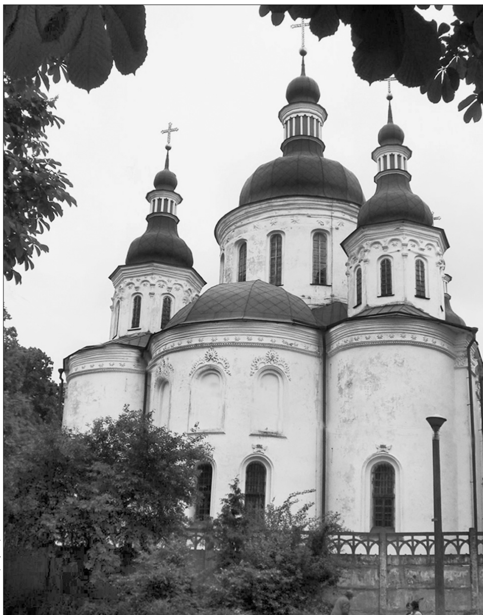
Після реставрації Кирилівський монастир став виглядати помітно привабливішим

Стіни головного храму монастиря — Кирилівської церкви — прикрашені фресками XII—XVIII сторіч, а також розписами Михайла Врубеля.