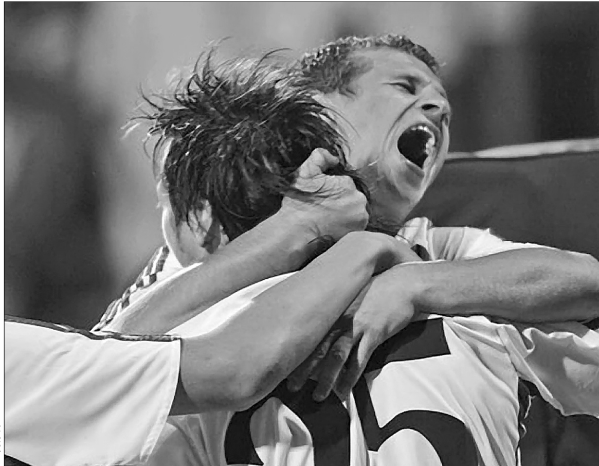
Після кожного забитого гола емоційне піднесення динамівців сягало апогею

Після того, як московський “Спартак” у першому матчі третього кваліфікаційного раунду вдома поступився з рахунком 1:4 і втратив головного тренера Станіслава Черчесова, якого відправили у відставку, шанси “червоно-білих” на вихід до основної сітки прирівнювали до нуля. Добре це розумів і виконуючий обов’язки керманіча команди Ігор Ледяхов, який, щоправда, на прес-конференції за день до гри пообіцяв, що його підопічні намагатимуться відіграти цей солідний гандикап. Знала б зірка “Спартака” 90-х років, що чекає на його підопічних у столиці України, напевно, не закидав словами, які, інакше, ніж бравада не навеш.