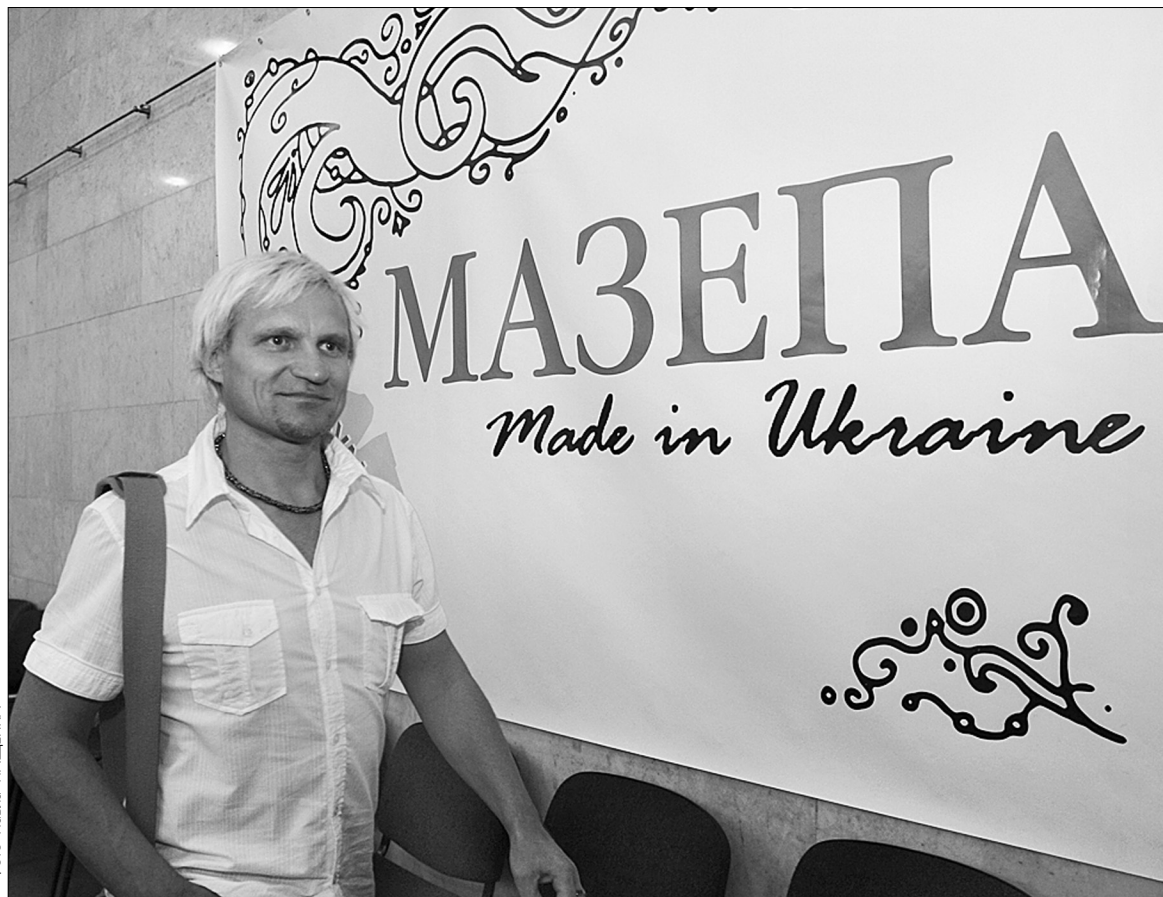
Організатори проекту “Мазепа. Made in Ukraine” вирішили представити для сучасності легендарного гетьмана таким, яким він був насправді

Сама назва проекту видається трохи дивною. Принаймні друга її половина вперто нагадує про промислові та продовольчі товари українського виробника, зроблені переважно для експорту за кордон. Однак завдання організатори перед собою поставили надто складне: спроба деміфологізації постаті гетьмана Івана Мазепи. Тобто повне заперечення зручного образу “іуди”, “зрадника”, в тому числі й романтичного героя, яким Мазепа зображений у більшості мистецьких творів. Натомість — показ його таким, яким був насправді. Завдання для насого з вами сучасника, котрого з